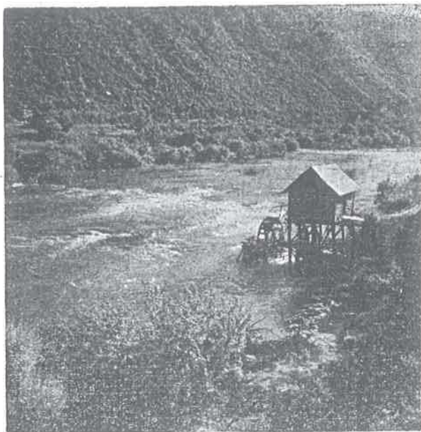
Una ispod Bihaća