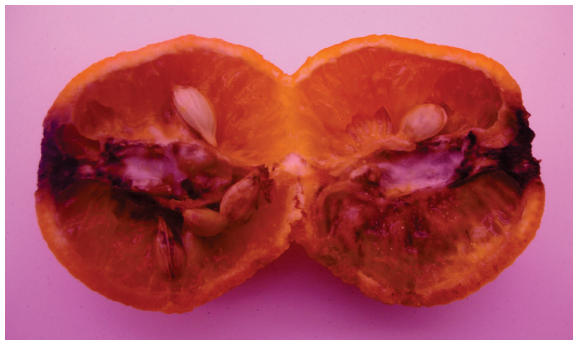
Slika 2. Unutrašnji simptomi crne truleži na plodu klementine inokuliranom na disk čaške izolatom Alternaria alternata MB-ALT13.

Picture 2. Interior symptoms of black rot on clementine fruit inoculated on button with Alternaria alternata MB-ALT13 isolate.