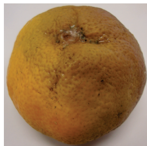
Slika 4. Siva plijesan ( Botrytis cinerea ) – prirodna zaraza na plodu mandarine.

Picture 3. Clementine fruit 18 days after inoculation with Colletotrichum gloeosporioides MB-COLL4 conidial suspension into the peel.