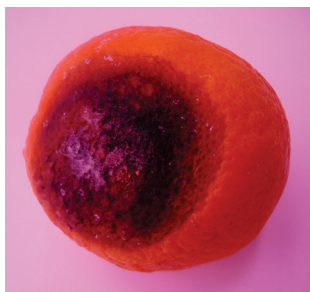
Slika 3. Plod klementine 18 dana nakon inokulacije suspenzijom spora u koru izolatom Colletotrichum gloeosporioides MB-COLL4.

Picture 2. Interior symptoms of black rot on clementine fruit inoculated on button with Alternaria alternata MB-ALT13 isolate.