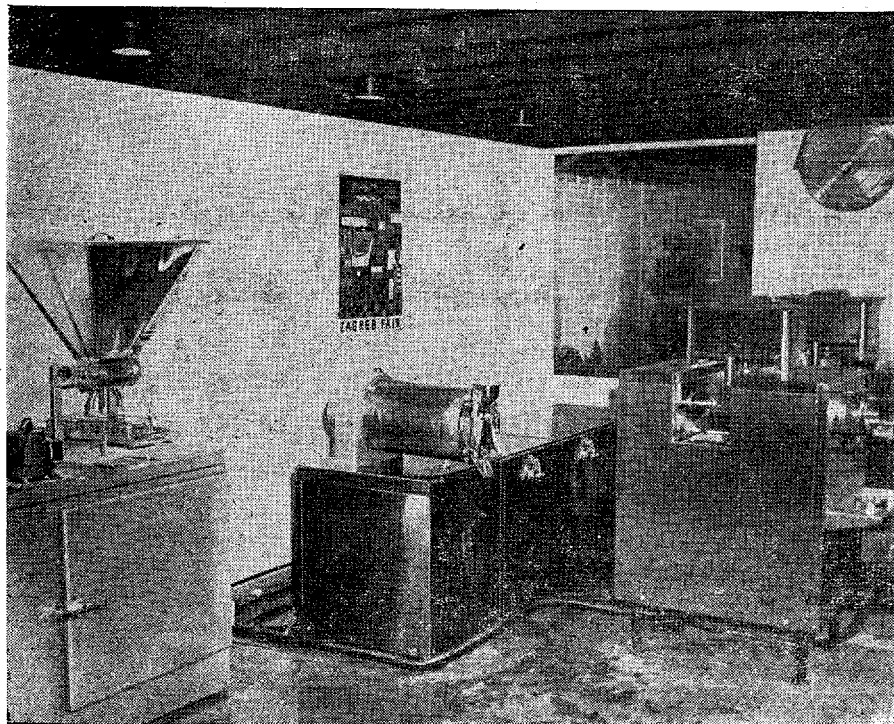
Уређаја за производњу сладоледа