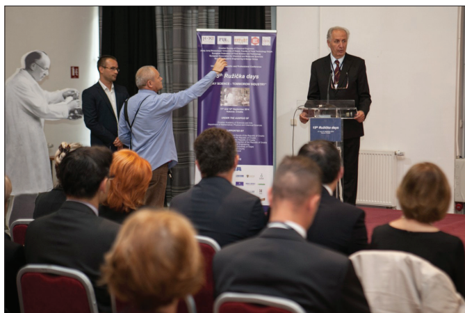
Slika 3 – Akademik Vitomir Šunjić otvara Skup

Hrvatsko društvo kemijskih inženjera i tehnologa povodom održavanja jubilarnih, 15. po redu "Ružičkinih dana" uručilo je i priznanja na otvaranju Skupa, za posebni doprinos u radu i razvitku dosadašnjih skupova "Ružičkini dani", i to kako slijedi: