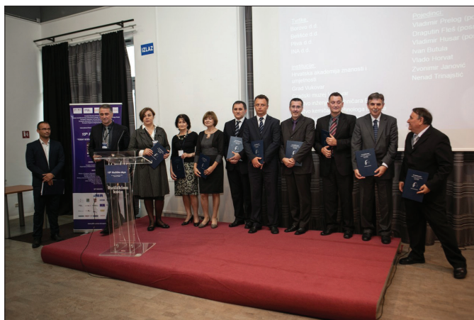
Slika 4 – Dodjela priznanja za poseban doprinos u radu i razvitku dosadašnjih skupova "Ružičkini dani"

Znanstveni i stručni radovi na Skupu prezentirani su kao plenarna predavanja, pozvana predavanja, usmena priopćenja te posterska priopćenja (tablica 1), unutar sljedećih sekcija: