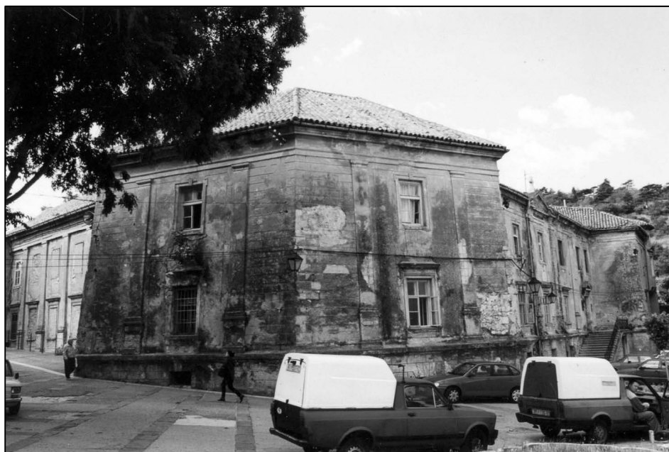
Sl. 1. Ožegovićianum u Senju (foto: Mirko Raguž, 2008.)

Uz samu zgradu Senjskog muzeja više godina stoji ruševina koja nagruđuje taj okoliš svojim izgledom. Glavičić je želio da se na tom prostoru izgradi prirodoslovni muzej Velebita. Kao veliki ljubitelj prirodnih i raskošnih ljepota te bogatstava ove najljepše hrvatske planine držao je da je u tome potrebna velika zainteresiranost grada Senja. No u tome, kao i mnogim drugim kulturnim projekcijama nedostaje podrška i pomoć, ove ideje ostaju samo želje koje će pričekati neka nova promišljanja i novčane potpore.