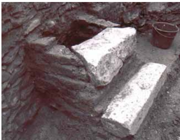
5 Struktura prepoznata kao dimnjak, unutrašnjost kružnog objekta uz župnu crkvu sv. Jakova u Prelogu tijekom istraživanja 1998. godine

Structure identified as a chimney, interior of the circular structure along the parish church of St. Jacob in Prelog in the course of research in 1998