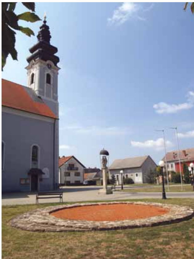
1 Pogled na prezentirani kružni objekt i župnu crkvu sv. Jakova u Prelogu

View of the presented circular structure and the parish church of St. Jacob in Prelog