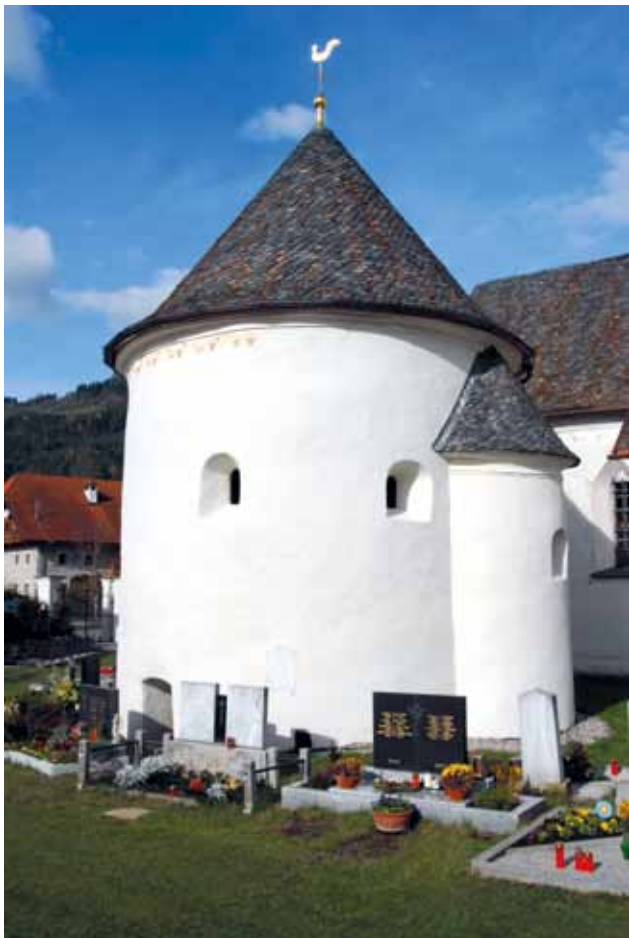
8 Pogled na karner u Glantschachu

View of karner in Glantschach