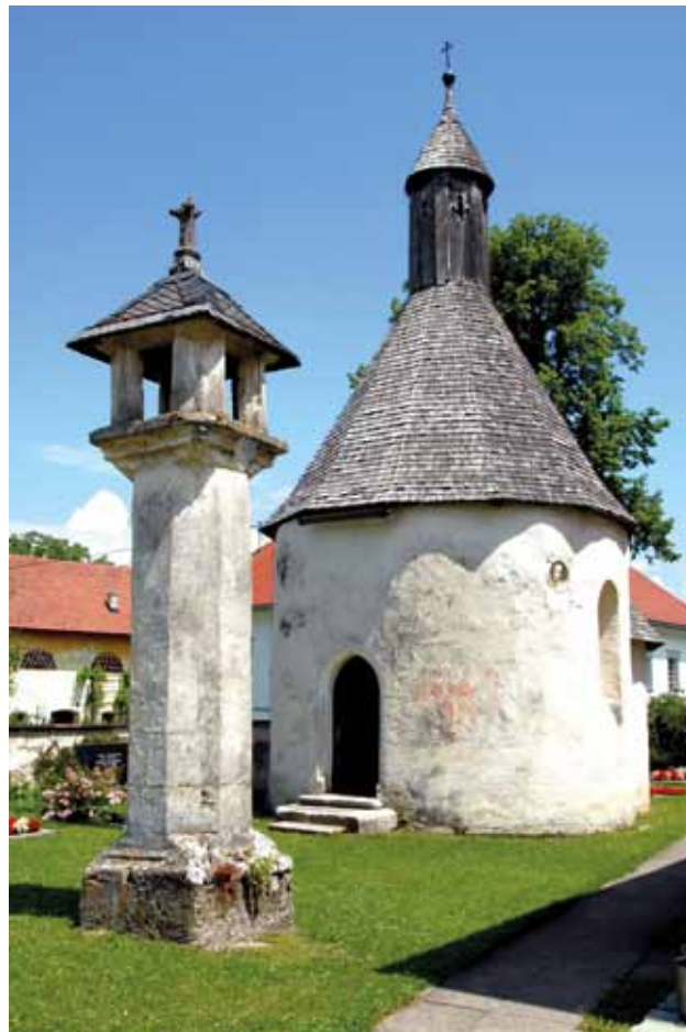
9 Karner na groblju u Globasnitzu

View of karner in Glantschach