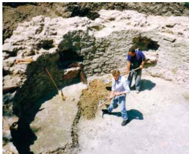
4 Temelji kružnog objekta uz župnu crkvu sv. Jakova u Prelogu tijekom istraživanja 1998. godine

Foundations of the circular structure along the parish church of St. Jacob in Prelog in the course of research in 1997