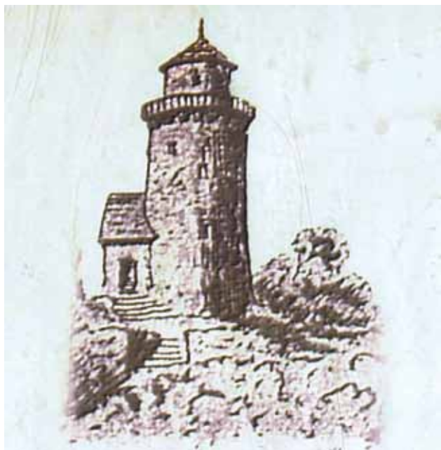
7 Prikaz „kule“ na informativnoj tabli uz prezentirane ostatke kružnog objekta uz župnu crkvu sv. Jakoba u Prelogu

Display of the „tower“ on the information board along with presented remains of the circular structure by the parish church of St. Jacob in Prelog