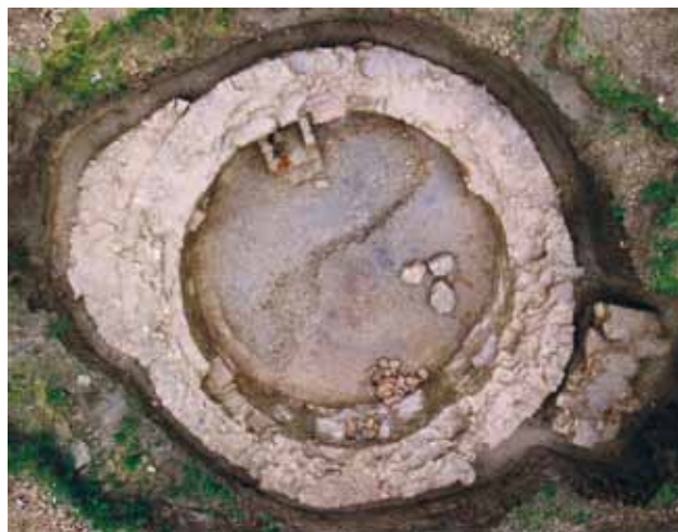
6 Temelji kružnog objekta uz župnu crkvu sv. Jakova u Prelogu nakon istraživanja 1998.; na istočnoj strani vidi se polukružni istak (apsida), a na zapadnoj urušenje zida (Fototeka Arheološkog odjela Muzeja Međimurja u Čakovcu)

Structure identified as a chimney, interior of the circular structure along the parish church of St. Jacob in Prelog in the course of research in 1998 (Photo archive of the Archaeological Department of the Museum of Međimurje in Čakovec)