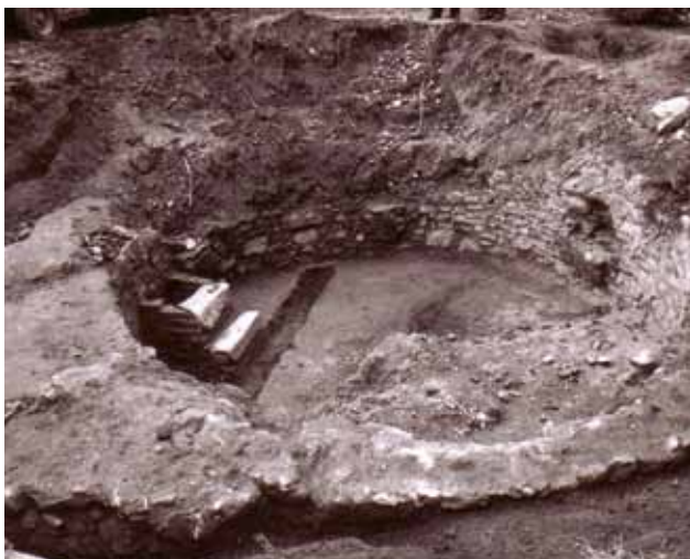
3 Temelji kružnog objekta uz župnu crkvu sv. Jakova u Prelogu tijekom istraživanja 1997. godine

Foundations of the circular structure along the parish church of St. Jacob in Prelog in the course of research in 1997