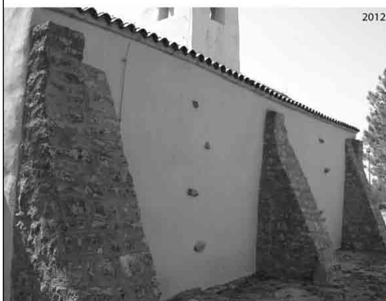
T. V. Starigrad Paklenica - sv. Petar, završen konzervatorski zahvat na crkvi.