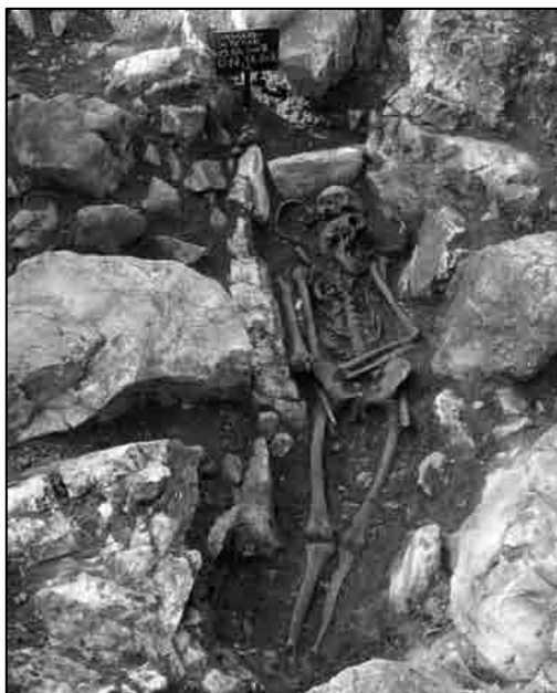
T. I. Starigrad Paklenica - sv. Petar, istraživanje groba 207