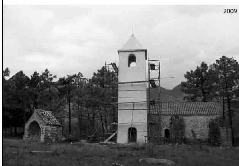
T. IV. Starigrad Paklenica - sv. Petar, konzervatorski zahvat na zvoniku.