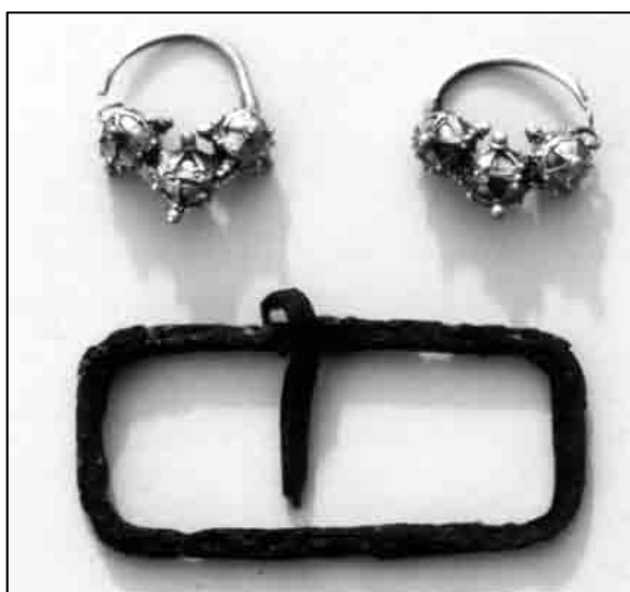
T. III. Starigrad Paklenica - sv. Petar, nalazi iz grobova.