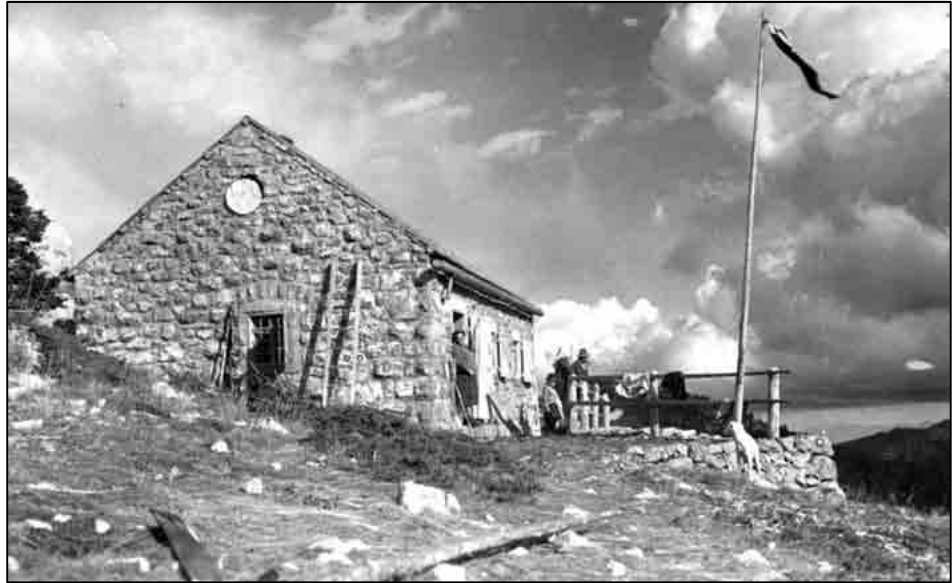
Sl. 5. Krajačeva kuća

veze). Još ilustrativniji je primjer da sam 1959. kao urednik planinarskog časopisa morao iz bibliografije 1898-1958. izbaciti članke politički nepoćudnih osoba. Među njima bilo je najviše Krajačevih, pa tako i svi njegovi članci o Premužićevoj stazi. Na moj prigovor da su to ključni članci bez kojih je bibliografija bezvrijedna, postignut je kompromis: naslovi članaka mogu biti uvršteni ali ne i imena njihovih autora. Zavrjeđuje da se citira bilješka koja je o tome objavljena u broju 1-2, 1959. str. 2.: "Redakcioni odbor "Naših planina" donio je odluku da se iz ovog pregleda izostave ratni brojevi "Hrvatskog planinara" (1941-1944) koji sadrže 90 članaka. Osim toga je iz predratnih godišta eliminirano 12 autora (sa 18 članaka), koji su se kompromitirali ili bili osuđeni od Narodnih sudova." Danas više nema zapreke da obnovimo sjećanje na Krajača, tim više što je u svoje doba bio istaknuta ličnost hrvatske kulture. O toj planski zanemarivanoj, ali zanimljivoj i osebujnoj ličnosti, napisao je planinar, glumac i publicist Vladimir Jagarić (1925-2011) knjigu Ivan Krajač – Život i djelo političara, ekonomista, pravnika i planinara koju je 2009. tiskao Hrvatski planinarski savez. Ona sadrži i izbor Krajačevih tekstova, tako da će je svatko tko se zanima za hrvatsku povijest između dva svjetska rata sa zanimanjem pročitati jer je temeljito dokumentirana a usto pisana na vrlo čitak način.