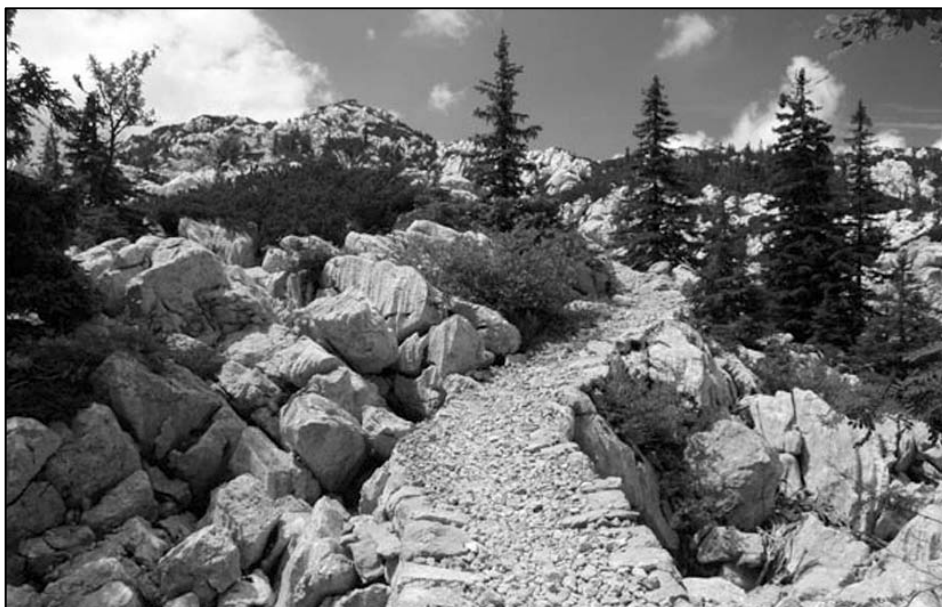
Sl 1.-2. Premužičeva staza