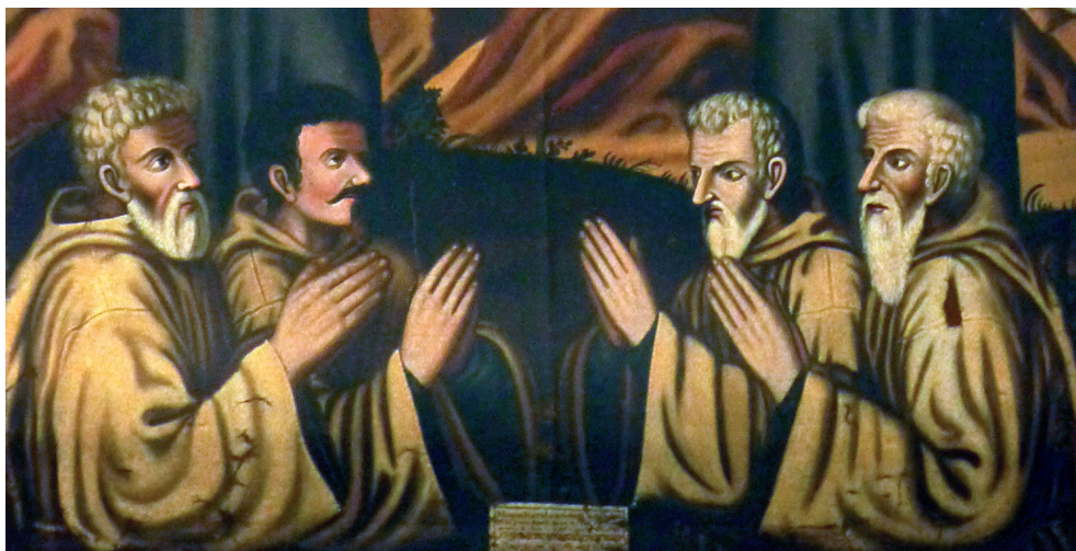
Bratimi Duha Svetoga na pali "Bogorodica sa sv. Franom i Antonijem", sakristija Hvarske katedrale

procesijama vezanim uz Kristovu muku, pa tako se u spomenutom pravilniku navodi: „Svaki bratim, samo ako ne bude odsutan, ili bolestan, ili opravdano zapriječen, bit će dužan prisustvovati s bratimskom haljinom i dotičnim obilježjem: a) procesiji u Veliki četvrtak i Veliki petak poslije podne za ophod svetih grobova; b) procesiji u nedjelju poslije podne Velike sedmice, za jednosatni pohod Svetootajstvu izloženom za 40 sati u stolnoj crkvi; c) svečanoj procesiji Svetootajstvom u Veliki petak večer“. U nastavku se nabraja još sedam procesija u kojima imaju sudjelovati članovi bratovštine Sv. Nikole. 113