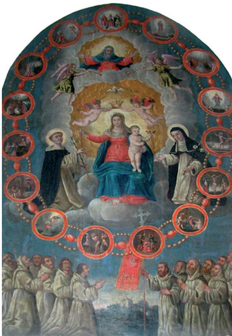
Martin Benetović: Pala Kraljice Presvetog Ruzarija iz 1598. godine, župna crkva u Dolu

sestrimu. Izgon je punovažeći, kada za to glasuje većina bratima, a znak da je netko izgnan iz bratovštine daje se brećanjem bratimskog zvona 4-5 puta. 14