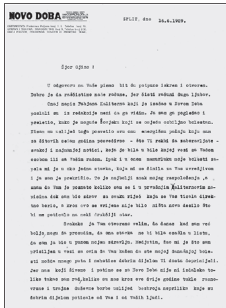
Slika 2. Prva stranica pisma upućenog Ivi Tartaglii u vezi s člankom Fabijana Kaliterne, 16. lipnja 1929.