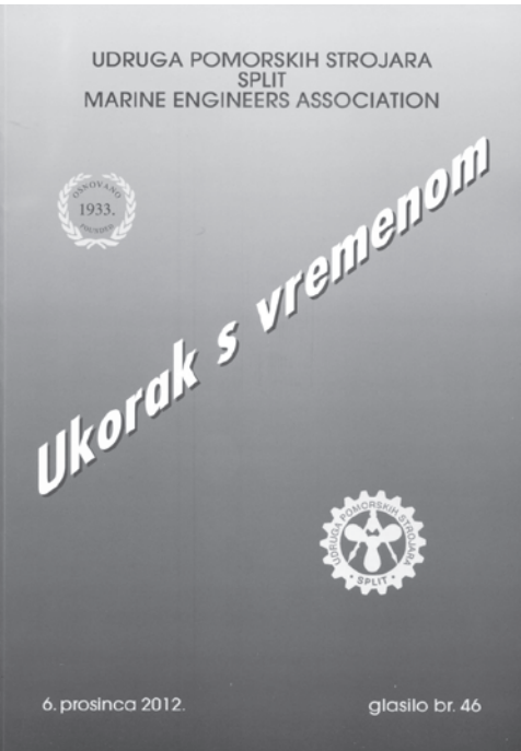
Slika 4. Naslovnica glasila Ukorak s vremenom iz prosinca 2012.