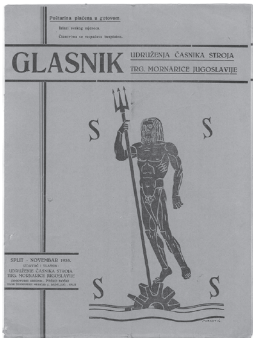
Slika 1. Naslovnica Glasnika Udruženja časnika stroja trg. mornarice Jugoslavije. Split, studeni 1935.