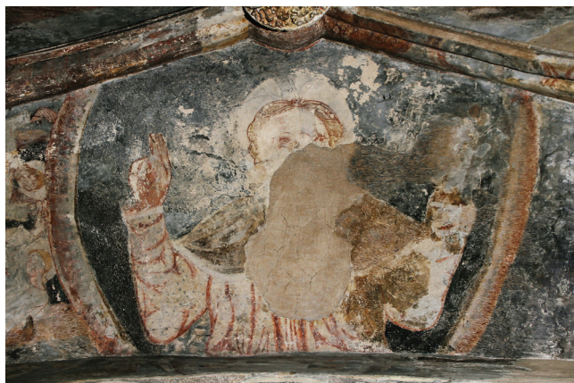
Sl. 5 Murska Sobota, Stolna crkva, prikaz Pantokratora kao Tricephalosa , 14. stoljeće

polju, uz trijumfalni luk, nadzirući ulaz u svetište (svevideći!).