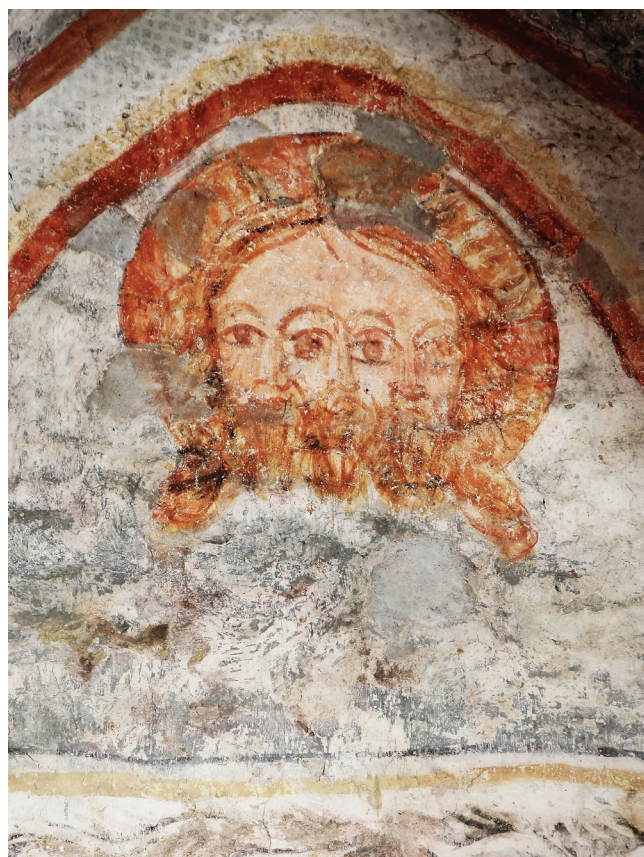
Sl. 4 Kalnik, Sveti Brcko, prikaz Svetog Trojstva kao Tricephalosa , 16. stoljeće