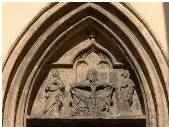
Sl. 2 Ptuj, prošteniška crkva svetog Jurja, luneta sjevernog portala s prikazom Prijestolja milosti , 15. stoljeće

potpuno odgovara teološkoj doktrini bit će u kasnijim ikonografskim tipovima drastično narušena.