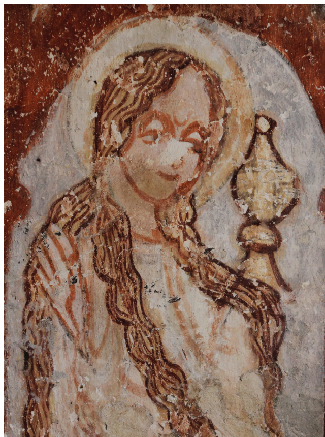
Sl. 10 Kalnik, Sveti Brcko, Sveta Magdalena , 16. stoljeće Fig. 10 Kalnik, St. Brice, St. Mary Magdalene, 16 th century

ne ukazuje na neku žilavu nit koja bi povezivala više od stoljeća vremenske razlike i naraštaje slikarskih radionica, nego prije na slikara koji je, prije zahtjevnog zadatka oslikavanja svetišta, napunio blok skicama drugih svetišta sa sličnim tematskim zadacima. Ovo ujedno može biti objašnjenje kako bi se neobičan lik trostrukog lica našao pod kistom provincijalnog neobrazovanog majstora.