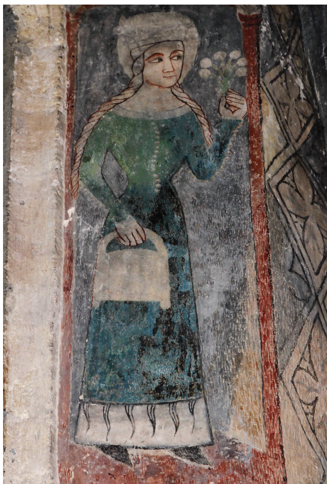
Sl. 11 Murska Sobota, Stolna crkva, Sveta Doroteja , 14. stoljeće Fig. 11 Murska Sobota, cathedral, St. Dorothy , 14th century