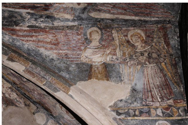
Sl. 9 Murska Sobota, Stolna crkva, Anđeli svirači , 14. stoljeće Fig. 9 Murska Sobota, cathedral, Angel musicians, 14 th century

površina, mada su same dekoracije različitog tipa i različite razine likovnog promišljanja. Sve ovo, naravno,