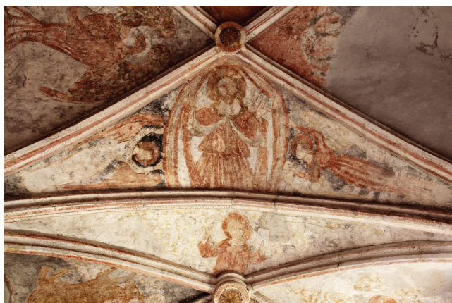
Sl. 6 Kalnik, Sveti Brcko, prikaz Krista u slavi, 16. stoljeće

Kalnički Tricephalos dio je ciklusa slikarija kojima je oslikano čitavo svetište izgrađeno početkom 16. stoljeća, 27 točnije 1518., 28 što ujedno daje okvir za datiranje ovih slika. Ciklus zidnih slikarija ispunjava svod na dva križnorebrasta jarma, te zidove. Dio oslika je uništen vlagom, te pregradnjama koje je svetište otrpjelo kroz stoljeća. Na svodu su prikazani anđeli i evanđelisti oko Krista u slavi, te sunce i mjesec (sl. 6). Upada u oči potpuno asimetričan raspored evanđelista,