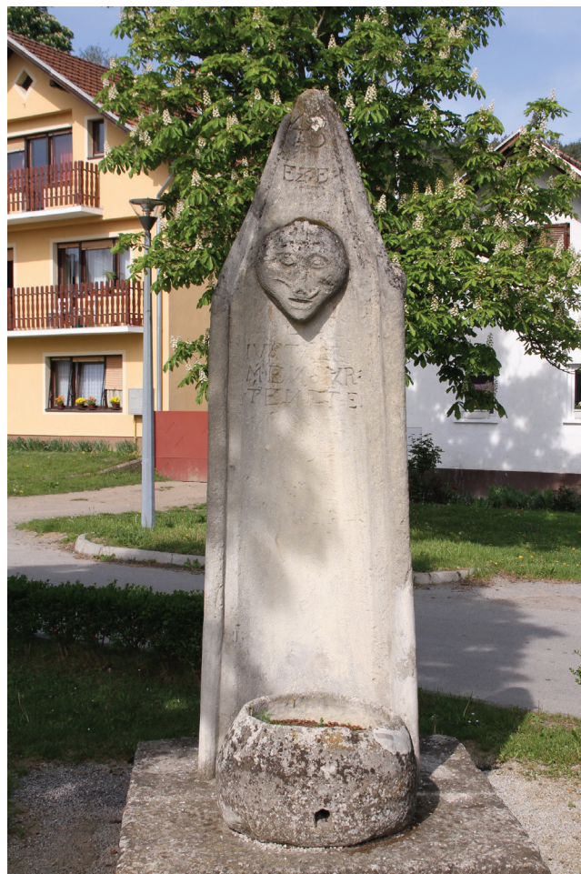
Sl. 15 Vinica, sramotni stup 'pranger'