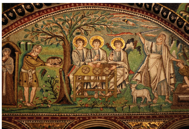
Sl. 1 Ravena, San Vitale, Tri mladića kod Abrahama, Abrahamova žrtva , 6. stoljeće

stoljeća – dakle nedugo nakon Nicejskog sabora koji verificira učenje o Svetom Trojstvu – prikazuje Boga kao velikodostojanstvenika na prijestolju, kojemu lijevo i desno stoje dva muškarca jednakog izgleda. Kako se doista radi o trima božanskim osobama, svjedoči njihovo usklađeno sudjelovanje u stvoriteljskom činu. I dok će na Zapadu nakon ovog prvog primjera ovaj tip prikaza Boga nestati na gotovo tisuću godina, on će živjeti dalje u Bizantu i kasnije na području Istočne crkve, gdje će razviti različite inačice. Popularan će biti prikaz Boga, kao trojice anđela (ili tri mladića). Podsjećamo na prikaz tri mladića kod Abrahama u lijepoj sinkronoj sceni u crkvi San Vitale u Raveni (Post 18:1-15) (sl. 1), 5 a iz kasnijeg razdoblja ortodoksne crkve,