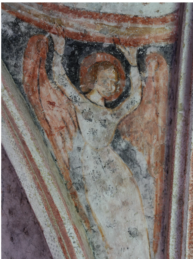
Sl. 8 Kalnik, Sveti Brcko, Anđeo koji podržava mandorlu , 16. stoljeće

Iako ova dva ciklusa zidnih slikarija dijeli poldrug stoljeća, ima više nego jedan razlog da tražimo moguće poveznice: Ponavljanje lika Krista u slavi na vrhu trijumfalnog luka i kontaktnog svodnog polja u Murskoj Soboti – od kojih je u jednom objedinjen ikonografski tip Tricephalosa – jedanko se ponavlja na dva svodna polja koja se dodiruju u crkvi na Kalniku. Na Kalniku se ponavlja i lik Tricephalosa –doduše nešto drugačije lociran, na zidu apside – činjenica koja nas je i potakla na dalje komparativno istraživanje oba ciklusa. Kaotičan raspored anđela i evanđelistâ u Kalniku, ne nalazi, doduše svoj pandan u Murskoj Soboti, ali sami prikazi simbola evanđelista i anđela oblikom su veoma slični. Ima i drugih detalja: način kako anđeli podignutim rukama podržavaju mandorlu Kristove slave, potpuno je jednak na oba ciklusa slikarija, zatim krila i obrada perja na krilima simbola evanđelistâ i anđela, te način kako krila popunjavaju segmentne oblike svodnih polja (sl. 8-9), potom detalji likova svetica, poput pletenica koje se spuštaju niz ramena (sl. 10-13). Tu je također i veći dio polja dekorativno popunjenih