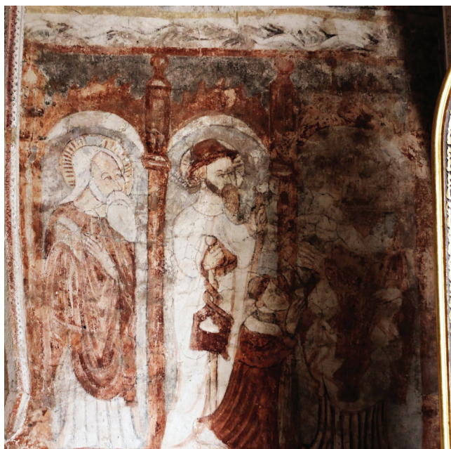
Sl. 12 Kalnik, Sveti Brcko, Sveci i donator , 16. stoljeće Fig. 12 Kalnik, St. Brice, Saints and the donor , 16th century