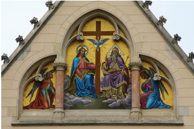
Sl. 3 Križevci, katedrala Svetog Trojstva, mozaik na pročelju, Sveto Trojstvo , 19. stoljeće

svih ostalih, pa čak i od Isusa (sl. 3). 12 Ukazuje li ovaj mali detalj likovnim jezikom na poseban položaj Boga Oca, kojega on zauzima u Svetom Trojstvu, unatoč dogmi o potpunoj jednakosti sve trojice? Neki se, naime, navodi u Novom zavjetu mogu raznoliko tumačiti, čak i kao dovođenje u pitanje jednakosti božanskih osoba, npr. Iv 14:28 najizravnije: Moj je otac veći od mene . Jednako tako i Mt 24:36, A o onom danu i času nitko ne zna, pa ni anđeli nebeski, ni Sin, nego samo Otac .