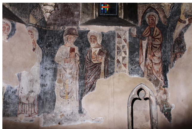
Sl. 13 Murska Sobota, Stolna crkva, Povorka svetaca i svetica , 14. stoljeće