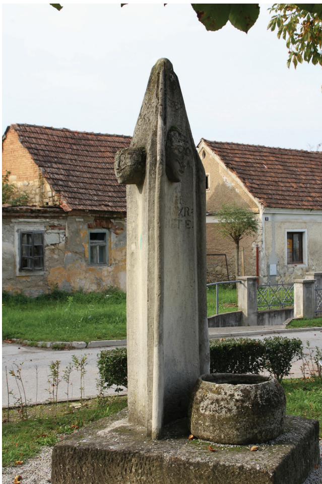
Sl. 14 Vinica, sramotni stup 'pranger'