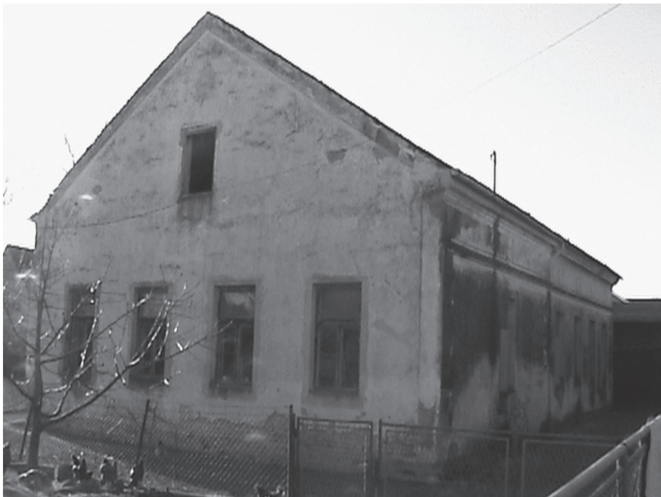
Sl. 6 Zgrada Djevojačke pučke škole u Martinskoj Vesi iz 1900. god.