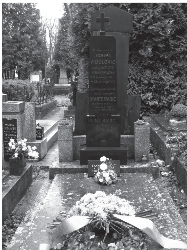
Sl. 6 – Grob Antuna Radića na Mirogoju u Zagrebu Fig. 6 Grave of Antun Radić at the Mirogoj cemetery in Zagreb

interesa kroz njihove vlastite organizacije.