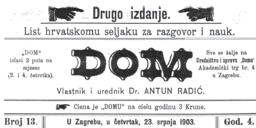
Sl. 4 Cenzurirana naslovnica Radićevih novina Dom iz 1903. godine