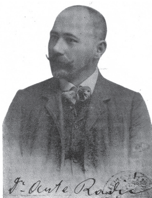
Sl. 1 Antun Radić (preuzeto iz: Murgić: Život, rad i misli dra Antuna Radića , 1937.)

Fig. 1 Antun Radić (source: Murgić: Život, rad i misli dra Antuna Radića [The life, work and thought of Dr Antun Radić], 1937)