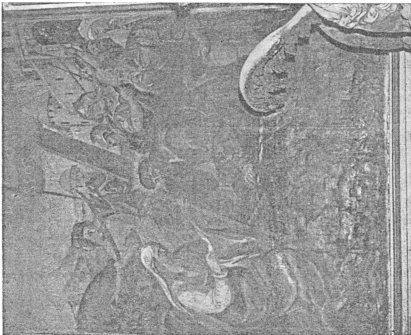
Sl. 5 Martin Benetonić, Susret s Veronikom, Hvar, franjevačka crkva