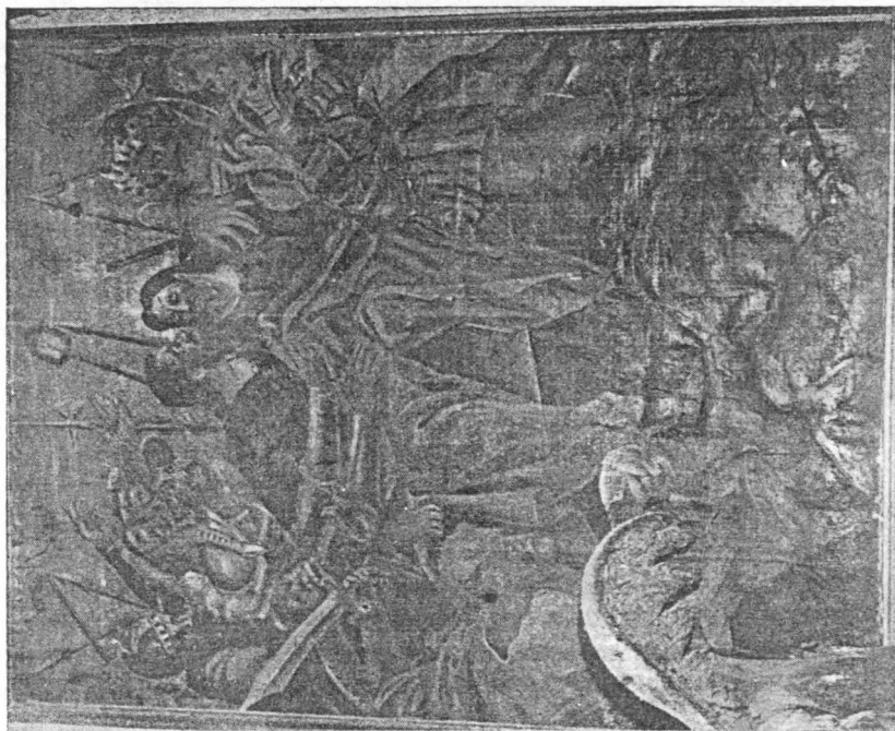
Sl. 2 Martin Benetović, Judin poljubac, Hvar, franjevačka crkva