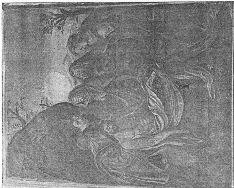
Sl. 6 Martin Benetonić, Polaganje u grob, Hvar, franjevačka crkva