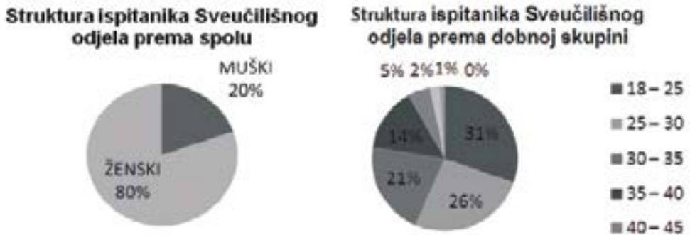
Slika 2. Struktura ispitanika Sveučilišnog odjela prema spolu i dobi