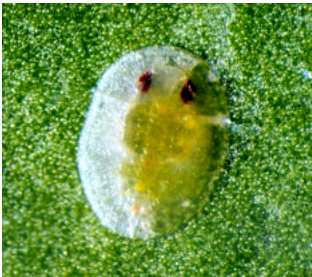
Slika 4. Kukuljica (stvarna duljina 1.41 mm-original) Figure 4. Pupa (natural length 1.41 mm-original)

tijela je gola, bez debelih seta, voštanih nakupina i slično.