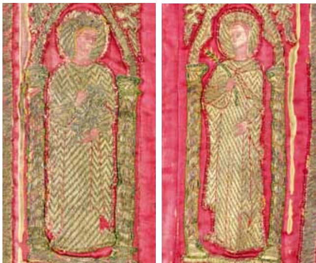
2. Sv. Katarina Aleksandrijska (lijevo) i Sv. Margareta (?) (desno) na antependiju iz crkve Sv. Krševana St Catherine of Alexandria (left) and St Margaret (?) (right), altar frontal from the Church of St Chrysogonus

iz Zbirke Zsigmunda Bubicsa, 9 donesen u Muzej 1909. godine, no uslijed određenih sporova oko Bubicseva nasljedstva u Inventarnu knjigu Muzeja biva unesen tek 1931. godine. Nasreću, podrijetlo antependija ostalo je