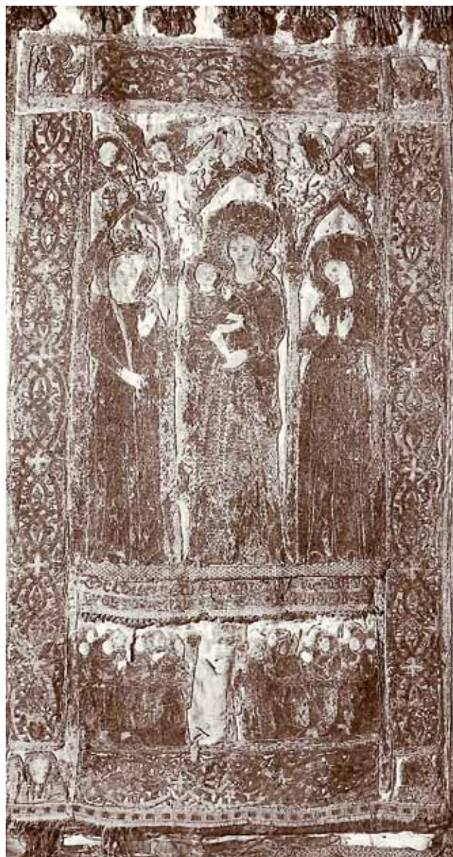
19. Barjak Sv. Foske, Museo Provinciale, Torcello

da je bio posebno čašćen. Naime, navodi se da se na oltaru osim škrinje sa svečevim tijelom nalazila i časna ikona s prikazom Sv. Krševana. 46 Od dragocjenosti zatečenih u sakristiji crkve ovdje se može izdvojiti barjak od „pozlačene crvene svile” s likom Sv. Krševana, koji se na svečev blagdan po gradu nosio u svečanoj procesiji. 47 Nažalost, nedostaje opis predmeta u kojem bi se mogao prepoznati naš antependij, ali možemo pretpostaviti da je to iz razloga što je vjerojatno bio pohranjen drugdje unutar samostana. A da se nastavio čuvati u samostanu, i to brižljivo, otkriva nam jedan naizgled sporedan detalj: crveni svileni saten