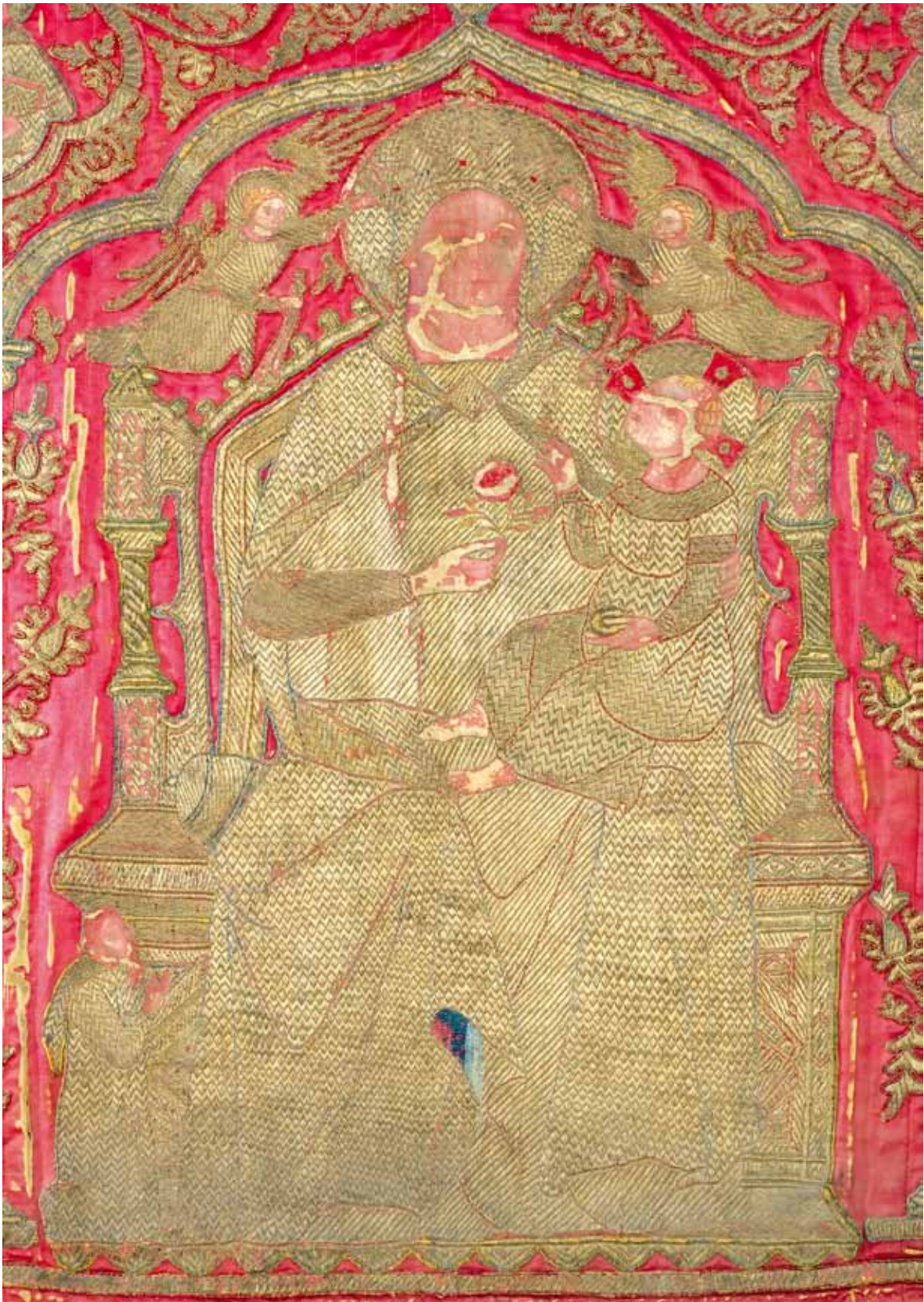
3. Središnje polje antependija iz crkve Sv. Krševana Central field of the altar frontal from the Church of St Chrysogonus