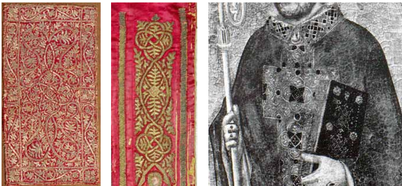
14. Detalj veza s motivom četiri učvorene kružnice na pretpostavljenom dijelu bordure antependija iz crkve Sv. Marije u Zadru (lijevo, foto: Ž. Bačić); na borduri antependija iz crkve Sv. Krševana (u sredini, foto: Iparművészeti Múzeum) te na misnici Sv. Nikole (desno; Bernardo Daddi, Triptih iz crkve Ognissanti u Firenci, 1328., detalj, Galleria degli Uffizi, Firenca. Izvor: RUTH GRÖNWOLDT /bilj. 31/, 28)

Detail of the embroidery with four interconnected circles on the assumed border section on the altar frontal from the Church of St Mary at Zadar (left); on the border of the altar frontal from the Church of St Chrysogonus (centre) and on the chasuble of St Nicholas (right: Bernardo Daddi, Triptych from the Ognissanti Church in Florence, 1328, detail. Galleria degli Uffizi, Florence)