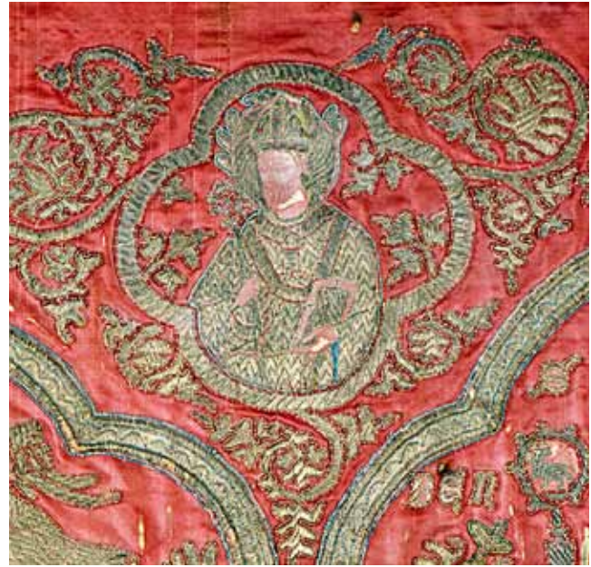
9. Sv. Grgur Papa (lijevo) i Sv. Donat (desno), detalji antependija iz crkve Sv. Krševana St Gregory the Pope (left) and St Donatus (right), details, altar frontal from the Church of St Chrysogonus