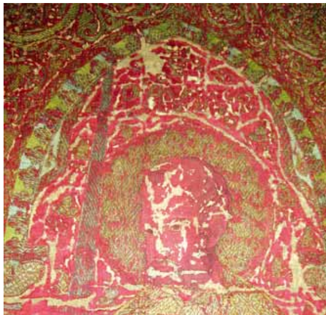
7. Sv. Pavao, detalj antependija iz katedrale Uznesenja Blažene Djevice Marije u Krku, Victoria & Albert Museum, London

polju antependija Bogorodica sjedi na jastuku, na raskošnu prijestolju čiji su postolje i naslon bogato profilirani, a bočne su mu stranice i perforirane (sl. 3). Odjevena je u dug zlatni hiton , a kopča koja joj na prsima učvršćuje maforion prikazana je u obliku većeg,