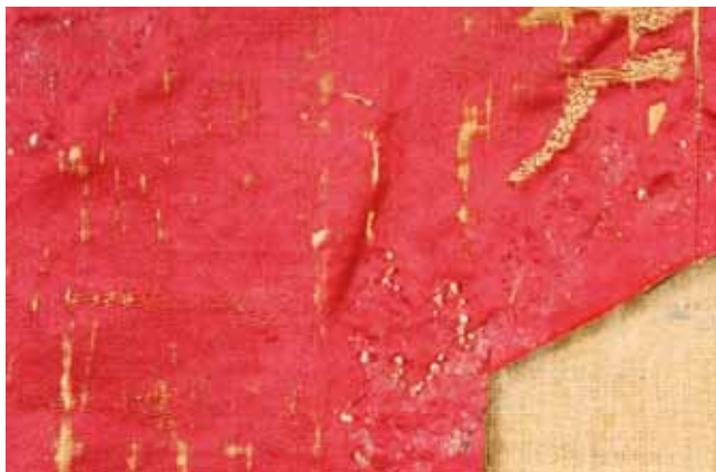
18. Uklonjena satenska podloga antependija iz crkve Sv. Marije u Zadru - detalj središnjeg dijela

Detail of the silk satin that until recently served as the ground for the embroideries of the altar frontal from the Church of St Mary at Zadar