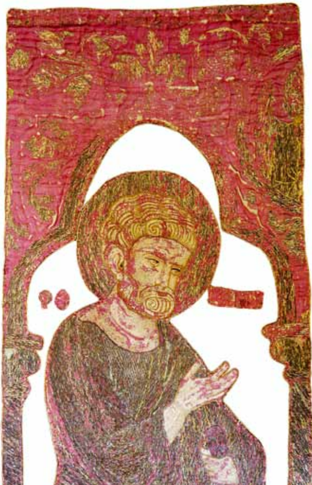
16. Detalj polja antependija s likom Sv. Petra pronađenog u župnoj crkvi Sv. Filipa i Jakova u Grobniku, Muzej za umjetnost i obrt, Zagreb

Detail of the field of an altar frontal with the figure of St Peter, found in the parish church of Ss. Philip and James at Grobnik. Museum of Arts and Crafts, Zagreb