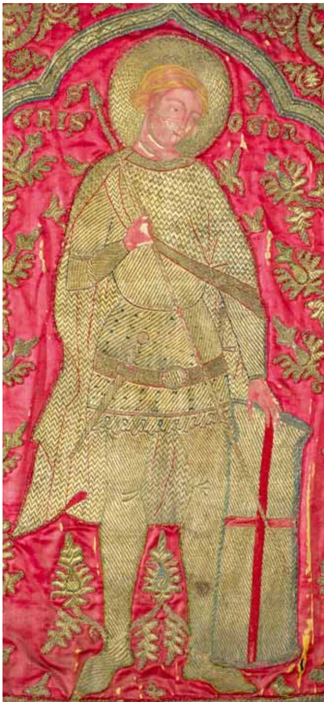
6. Sv. Krševan, lijevo polje antependija

St Chrysogonus, left field of the altar frontal