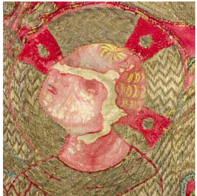
5. Dijete Isus, detalj središnjeg polja antependija iz crkve Sv. Krševana Christ Child, detail of the central field of the altar frontal from the Church of St Chrysogonus

su blago okrenute svecima u glavnom prikazu. 13 S lijeve strane je Sv. Katarina Aleksandrijska. Odjevena je u dugačku haljinu preko koje je prebačen plašt zakopčan na prsima. U blago podignutoj desnici razaznaje se ostatak palmine grane dok u lijevoj ruci drži kotač s oštricama (sl. 2, lijevo). Njezin pandan s desne strane mlada je svetica s krunom na glavi i palminom granom u desnoj ruci. Jednako kao i Sv. Katarina, zaogrnutu je plaštom ispod kojeg je duga nabrana haljina (sl. 2, desno). Iako je moguće da je riječ o Sv. Luciji - koja je uz Sv. Katarinu Aleksandrijsku prikazana i na glasovitom gotičkom ophodnom raspelu iz zadarskog samostana Sv. Frane - čini se izvjesnijim da je ovdje prikazana Sv. Margareta. Sv. Katarina Aleksandrijska, Sv. Margareta i Sv. Barbara su tri djevice-mučenice koje pripadaju skupini Četrnaest svetih pomoćnika , grupi svetaca koji se zajedno počinju štovati u 14. stoljeću. Budući da su se osobito zazivali u životnim nevoljama i bolestima, smatra se da je začetak ove pobožnosti potaknut velikim epidemijama kuge u Europi. Kako je sredinom 14. stoljeća ova bolest „izbrisala” i značajan dio stanovništva Zadra, strah od njezinog ponovnog izbijanja mogao bi biti razlog uprizorenja ovih dviju svetica. 14 U središnjem