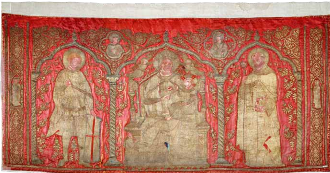
1. Antependij podrijetlom iz samostanske crkve Sv. Krševana u Zadru, Muzej primijenjenih umjetnosti (Iparművészeti Múzeum), Budimpešta

Altar frontal originating from the Church of the Benedictine Monastery of St Chrysogonus at Zadar, Iparművészeti Múzeum (Museum of Applied Arts), Budapest