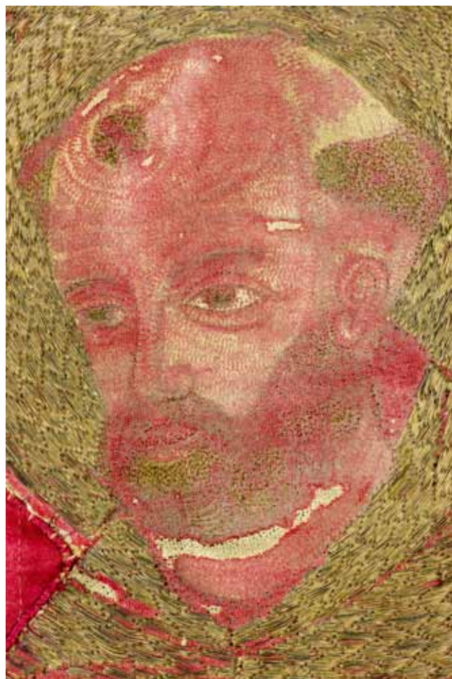
8. Sv. Benedikt, total (lijevo) i detalj (desno) desnog polja antependija iz crkve Sv. Krševana St. Benedict, total (left) and detail (right) of the right field of the altar frontal from the Church of St Chrysogonus