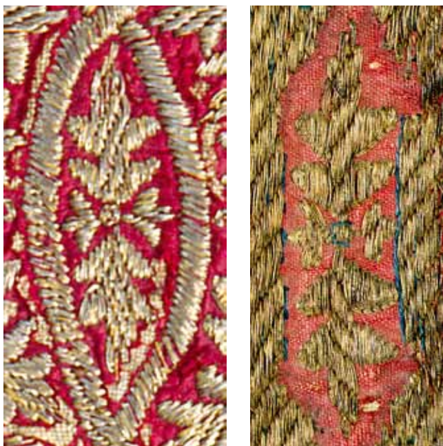
15. Detalj veza s motivom četiri ukrštena lista na pretpostavljenom dijelu bordure antependija iz crkve Sv. Marije u Zadru (lijevo) i na bočnim stranicama Bogorodičina prijestolja na antependiju iz crkve Sv. Krševana (desno)

Detail of the embroidery with four interconnected circles on the assumed border section on the altar frontal from the Church of St Mary at Zadar (left); on the border of the altar frontal from the Church of St Chrysogonus (centre) and on the chasuble of St Nicholas (right: Bernardo Daddi, Triptych from the Ognissanti Church in Florence, 1328, detail. Galleria degli Uffizi, Florence)