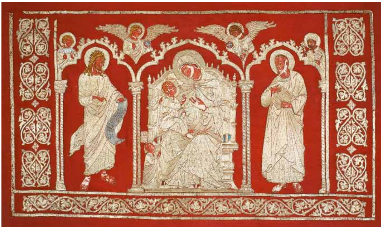
10. Antependij iz crkve samostana benediktinki Sv. Marije u Zadru, stanje nakon posljednjeg konzervatorsko-restauratorskog zahvata

Altar frontal from the Church of the Benedictine Convent of St Mary at Zadar, the condition after the last conservation and restoration works