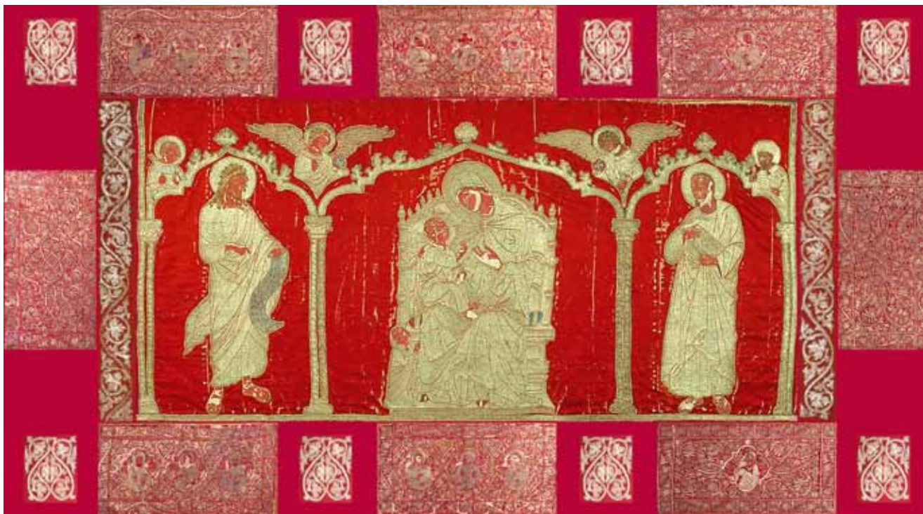
11. Prijedlog (rekonstrukcija) približnog izvornog izgleda antependija iz crkve Sv. Marije u Zadru Reconstruction proposal for the original appearance of the altar frontal from the Church of St Mary at Zadar

Naposlijetku ističem da je motiv petlje koju tvore četiri učvorene kružnice, 31 koji je izvezen na onim dvama „dijelovima baldahina” iz crkve Sv. Marije na kojima nema svetačkih likova (sl. 14, lijevo), izvezen i na antependiju iz crkve Sv. Krševana: tako su oblikovana dva pandana kvadrilobima s likovima Sv. Grgura i Sv. Donata, a više takvih petlja vidi se u ukrasnome obrubu (!) uzduž lijevoga i desnog ruba antependija (sl. 14, sredina). Kod obiju cjelina prepoznaje se i motiv stilizirana vegetabilnog ukrasa koji podsjeća na četiri ukrštena lista. Uočavamo ga na spomenutim dijelovima veza iz Sv. Marije (sl. 15, lijevo) te kao ornament Bogorodičina prijestolja na antependiju iz Sv. Krševana (sl. 15, desno). Dakle, zbog primjene istih materijala te srodnih ornamentalnih shema kod obaju antependija može se pretpostaviti da su nastali u istom ambijentu, u relativno kratku vremenskom razmaku. Ne može se tvrditi da su proizvod iste vezilačke radionice, ali su oba sasvim sigurno – jednako kao i dva antependija s otoka