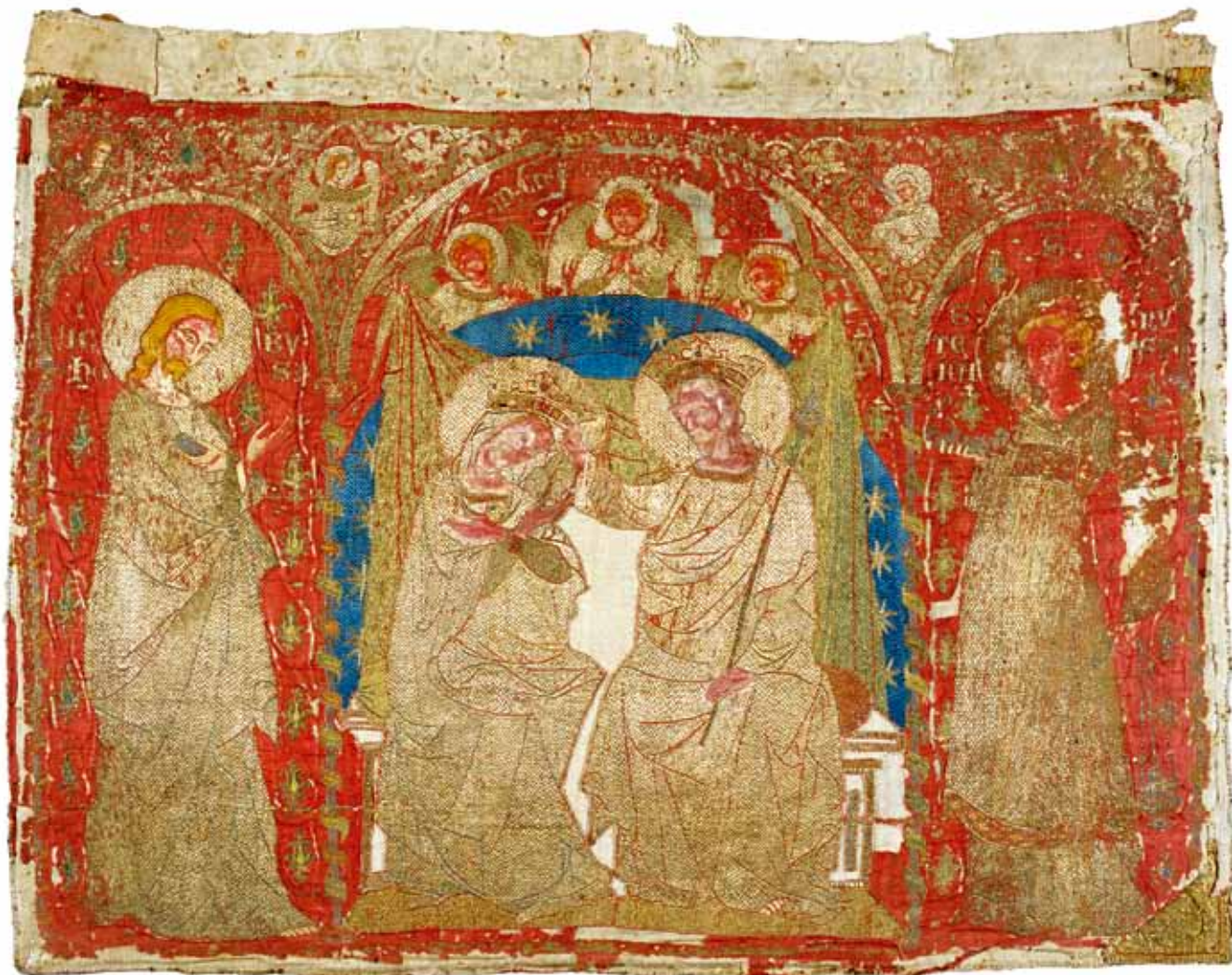
12. Antependij u župnoj crkvi Sv. Stjepana u Dobrinju na otoku Krku, stanje prije posljednjeg konzervatorsko-restauratorskog zahvata

antependija. Lice Sv. Petra kvalitetno je vezeno svilenim nitima, bodom punto raso i punto spaccato . Prikazan je sa svjetlom, kratkom valovitom kosom i svjetlom bradom, krupnih bademastih očiju i malih rumenih usana. Lijevo od glave su vezena slova PE, a s desne TRVS (visina slova 1.6 centimetra). Odjeven je u jednostavnu haljinu preko koje ima prebačen nabran plašt. Na stopalima mu se vide remeničići sandala. U lijevoj ruci drži svitak i uzicu o koju su ovješena dva ključa. Desna ruka blago je podignuta i pružena udesno. Središnji prikaz antependija očito se nalazio desno od njega. Da je riječ o ostatku antependija, dosad nije bilo uočeno, iako u prilog tomu idu i dimenzije vezanih dijelova. 33 Isječak se sačuvao zahvaljujući tome što je bio sekundarno prišiven na leđnu stranu misnice koja je 1875. godine zatečena u crkvi Sv. Filipa i Jakova u Grobniku. Biskup Josip Juraj Strossmayer ju je iste