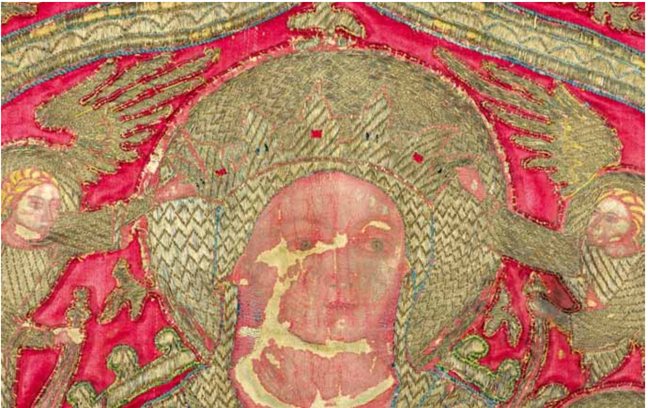
4. Krunjenje Bogorodice, detalj središnjeg polja antependija iz crkve Sv. Krševana Coronation of the Virgin, detail of the central field, altar frontal from the Church of St Chrysogonus

su blago okrenute svecima u glavnom prikazu. 13 S lijeve strane je Sv. Katarina Aleksandrijska. Odjevena je u dugačku haljinu preko koje je prebačen plašt zakopčan na prsima. U blago podignutoj desnici razaznaje se ostatak palmine grane dok u lijevoj ruci drži kotač s oštricama (sl. 2, lijevo). Njezin pandan s desne strane mlada je svetica s krunom na glavi i palminom granom u desnoj ruci. Jednako kao i Sv. Katarina, zaogrnutu je plaštom ispod kojeg je duga nabrana haljina (sl. 2, desno). Iako je moguće da je riječ o Sv. Luciji - koja je uz Sv. Katarinu Aleksandrijsku prikazana i na glasovitom gotičkom ophodnom raspelu iz zadarskog samostana Sv. Frane - čini se izvjesnijim da je ovdje prikazana Sv. Margareta. Sv. Katarina Aleksandrijska, Sv. Margareta i Sv. Barbara su tri djevice-mučenice koje pripadaju skupini Četrnaest svetih pomoćnika , grupi svetaca koji se zajedno počinju štovati u 14. stoljeću. Budući da su se osobito zazivali u životnim nevoljama i bolestima, smatra se da je začetak ove pobožnosti potaknut velikim epidemijama kuge u Europi. Kako je sredinom 14. stoljeća ova bolest „izbrisala” i značajan dio stanovništva Zadra, strah od njezinog ponovnog izbijanja mogao bi biti razlog uprizorenja ovih dviju svetica. 14 U središnjem