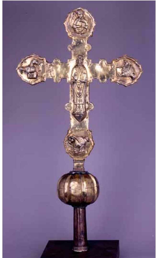
3. Pavao Petrov iz Kotora, ophodni križ iz Božave, revers, Stalna izložba crkvene umjetnosti u Zadru (SICU)

Paulo di Pietro da Cattaro, croce processionale da Bozava, verso, Mostra permanente d'arte sacra a Zara (SICU)