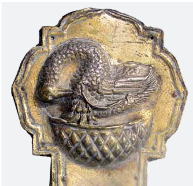
10. Ophodni križ iz Ugljana, detalj aversa s prikazom pelikanova gnijezda

Croce processionale da Ugljan, dettaglio del verso con l'immagine del nido di pellicano