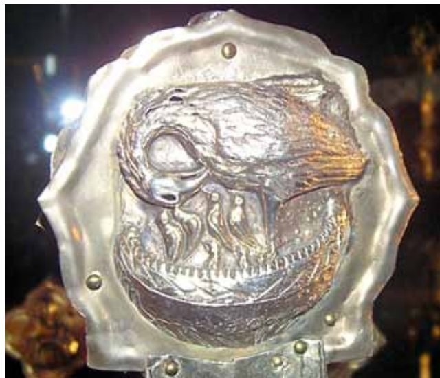
9. Ophodni križ iz Božave, detalj aversa s prikazom pelikanova gnijezda