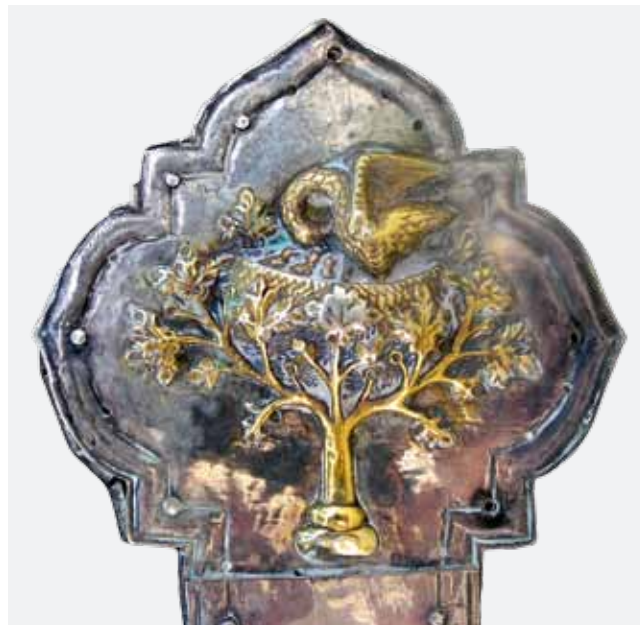
11. Ophodni križ iz Kali, detalj reversa s prikazom pelikanova gnijezda