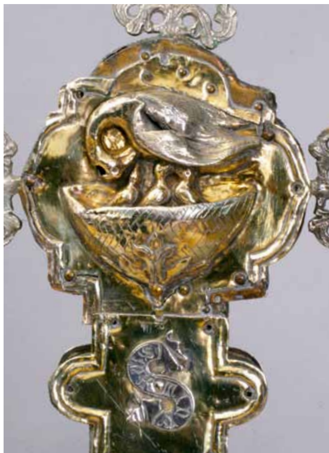
8. Ophodni križ iz Nina, detalj reversa s prikazom pelikanova gnijezda

Croce processionale da Bozava, dettaglio del recto con l'immagine del nido di pellicano