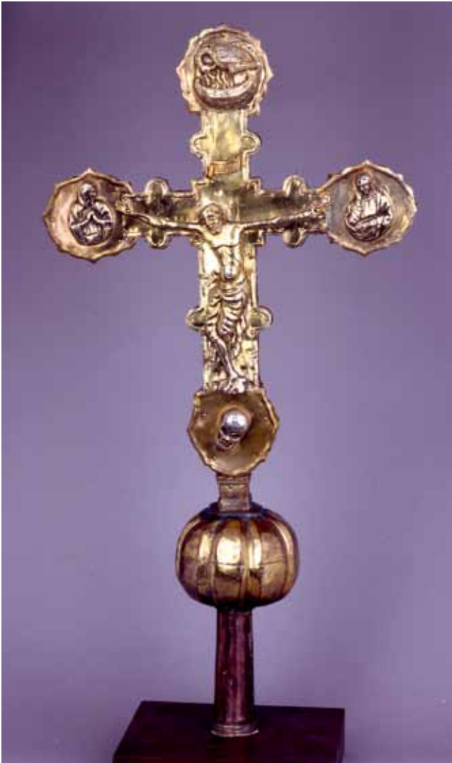
2. Pavao Petrov iz Kotora, ophodni križ iz Božave, avers, Stalna izložba crkvene umjetnosti u Zadru (SICU)

Paulo di Pietro da Cattaro, croce processionale da Bozava, verso, Mostra permanente d'arte sacra a Zara (SICU)