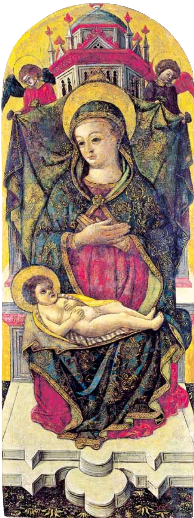
6. Petar Jordanić, Bogorodica s Djetetom , Tkon, župna crkva Petar Jordanić, Madonna col Bambino , Tkon, chiesa parrocchiale