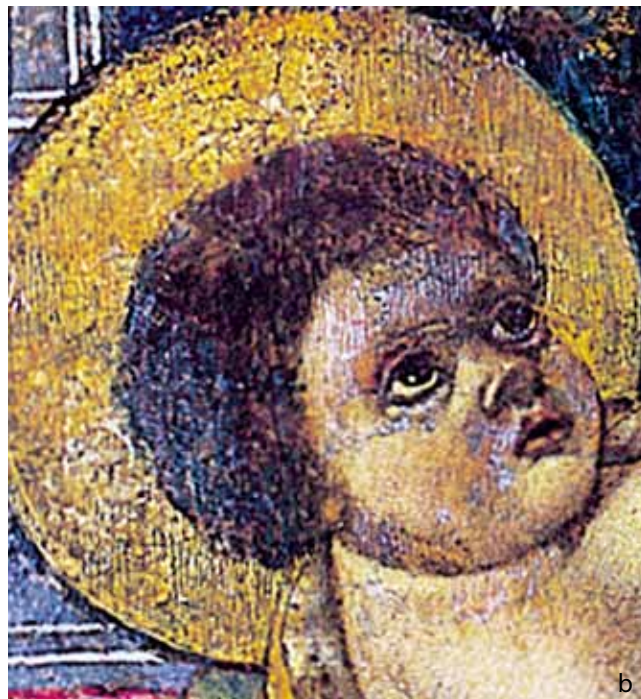
10. Petar Jordanić (?), Bogorodica s Djetetom (detalj), London, The Courtauld Institute of Art (a); Petar Jordanić, Bogorodica s Djetetom (detalj), Tkon, župna crkva (b)

Petar Jordanić (?), Madonna col Bambino (dettaglio), London, The Courtauld Institute of Art (a); Petar Jordanić , Madonna col Bambino (dettaglio), Tkon, chiesa parrocchiale (b)