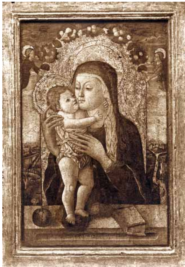
4. Petar Jordanić (?), Bogorodica s Djetetom , stara fotografija

Petar Jordanić (?), Madonna col Bambino, vecchia fotografia