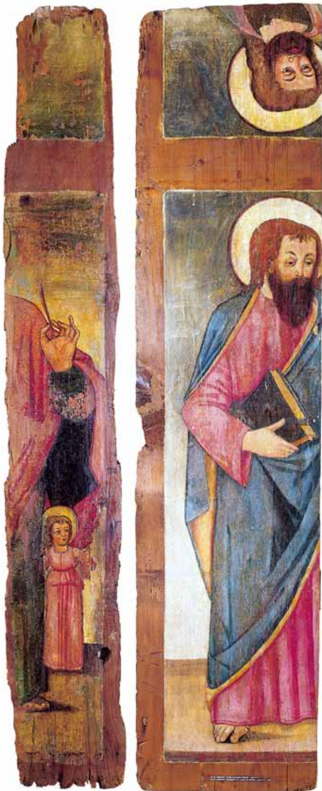
7. Petar Jordanić, Frammenti oslikanog stropa , Zadar, Stalna izložba crkvene umjetnosti

Petar Jordanić, Frammenti di soffitto dipinto , Zara, Mostra permanente d'arte sacra