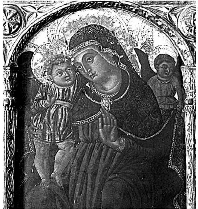
9. Petar Jordanić, Poliptih iz crkve Sv. Marije u Zadru (detalj), stara fotografija

Petar Jordanić, Polittico dalla chiesa di Sta Maria a Zara (dettaglio) , vecchia fotografia