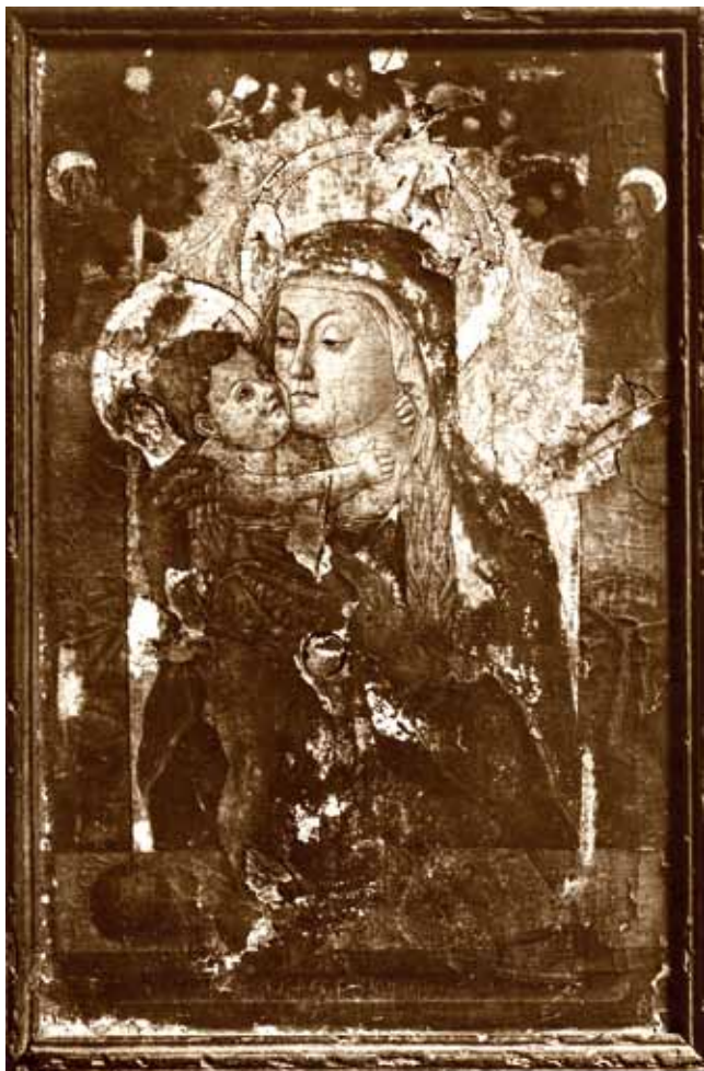
3. Petar Jordanić (?), Bogorodica s Djetetom , stara fotografija

Osobito je intrigantan zapis na poledini fotografije pod brojem 53346, one za koju pretpostavljamo da je