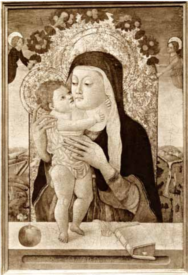
2. Petar Jordanić (?), Bogorodica s Djetetom , stara fotografija (izvor: Università di Bologna, Fondazione Federico Zeri, Fototeca Zeri, INVN 53344)

Petar Jordanić (?), Madonna col Bambino, vecchia fotografia