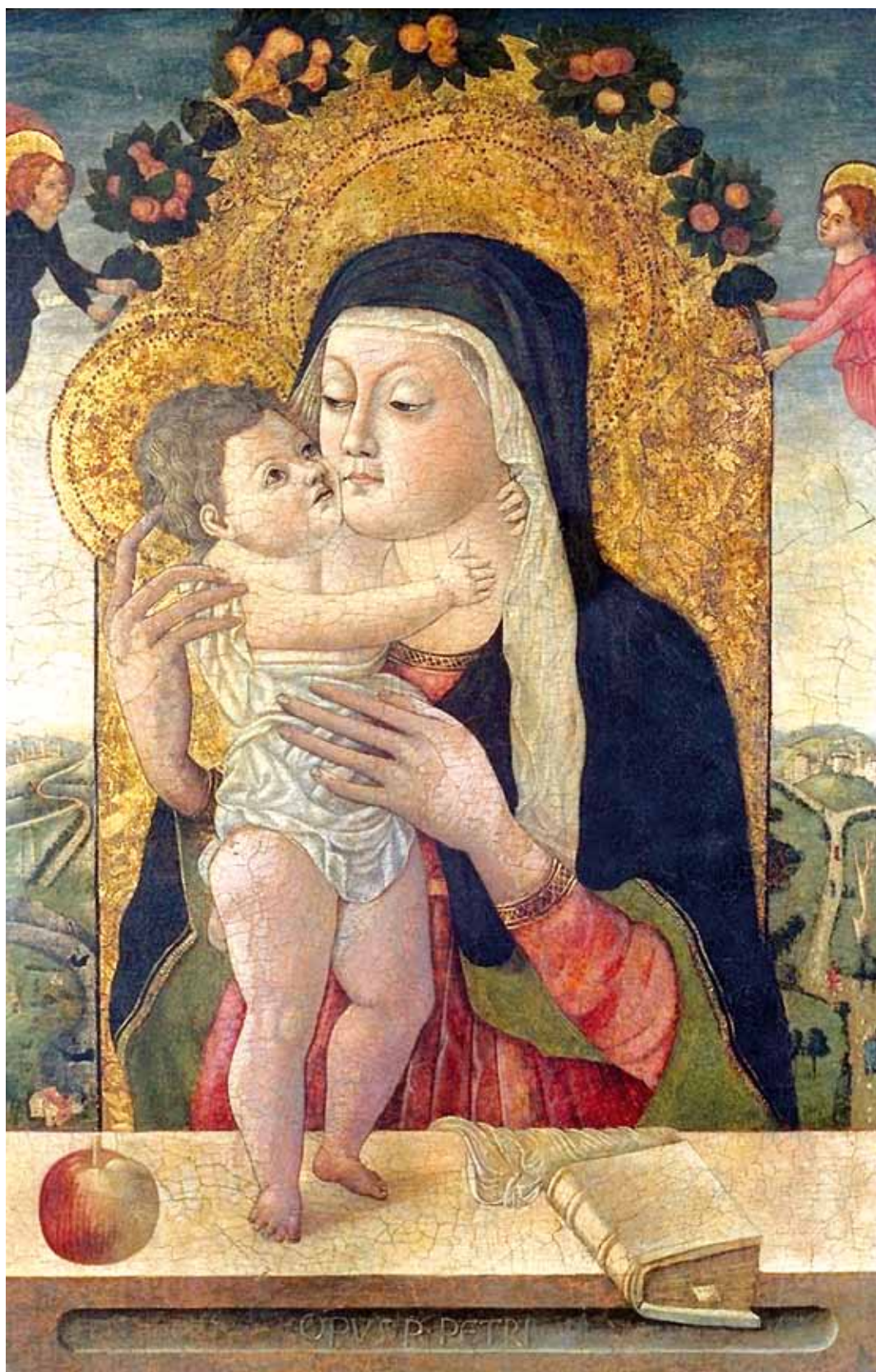
1. Petar Jordanić (?), Bogorodica s Djetetom , London, The Courtauld Institute of Art Petar Jordanić (?), Madonna col Bambino , London, The Courtauld Institute of Art