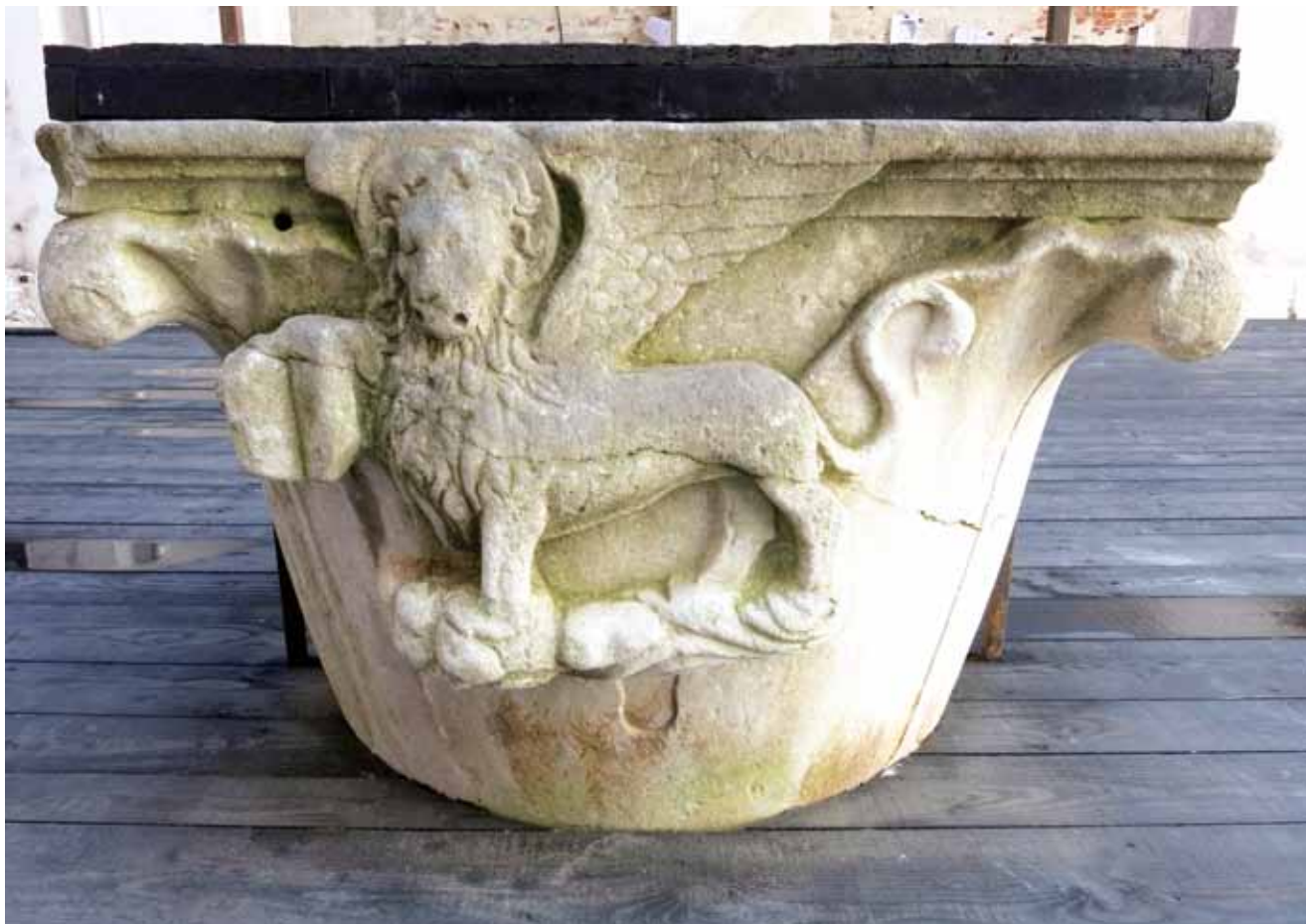
3. Kruna zdenca iz dvorišta Kneževe palače u Zadru

Zadarskim narudžbama od botege Marka Andrijića treba dodati i krunu zdenca koja se sačuvala u unutrašnjem dvorištu Kneževe palače. Kruna je kružnoga tipa koji u gornjem dijelu prelazi u kvadrat, završen klasičnom profilacijom oslonjenom na istaknute povijene vrhove ugaonih listova, i predstavlja tipološki obrazac izveden iz forme kapitela, ustaljen od sredine 14. do sredine 16. stoljeća. 16