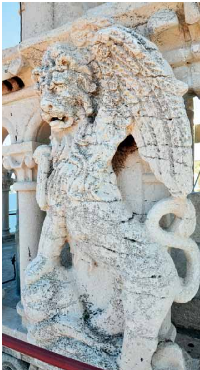
4. Lav Sv. Marka s ograde zvonika korčulanske katedrale Leone di san Marco dal recinto di campanile della cattedrale di Curzola