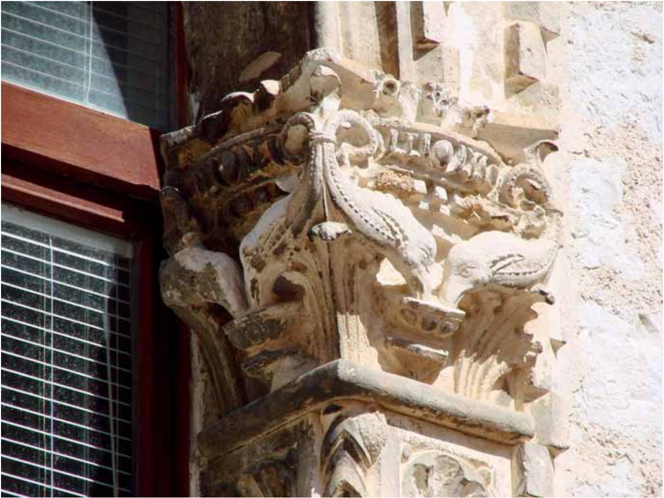
2. Kapitel istočnoga doprozornika Andrijićeve monofore kuće Nassis u Zadru (foto: L. Borić) Capitello di stipite orientale della monofora di Andrijić sulla casa di Nassis

se razlikuju od zadarskih i korčulanskih, budući da iz kantarosa među dupinskim glavama izrasta cvijet, ehin je lišen ovula i dentikula, a drukčije je oblikovan i cvijet abaka. Tijela paških dupina ponešto su zdepastija, uz manju napetost leđne sinusoide, obrisne linije čela lošije su oblikovane, kao i detalji očiju i krljušti. Navedeno prisnažuje slutnju G. Nikšića o znatnijem udjelu Andrijićevih suradnika pri izradi paških kapitela. 10 No, premda se morfološke karakteristike dupina na kapitelima doista mogu dovesti u vezu sa sličnim Andrijićevim primjerima, likovi zadarskih putta doimaju se kvalitetnijima od poznatih nam Andrijićevih figura. Kako je već prije navedeno, osim u impostaciji tijela i nesigurnu držanju vrpce girlande, njihova se lica donekle razlikuju od onih korčulanskih kipova Navještenja, ponajviše u pravilnijem oblikovanju volumena obraza, čela, očiju, nosa i usta, pa se može pretpostaviti majstorovo sazrijevanje ili pak suradnja