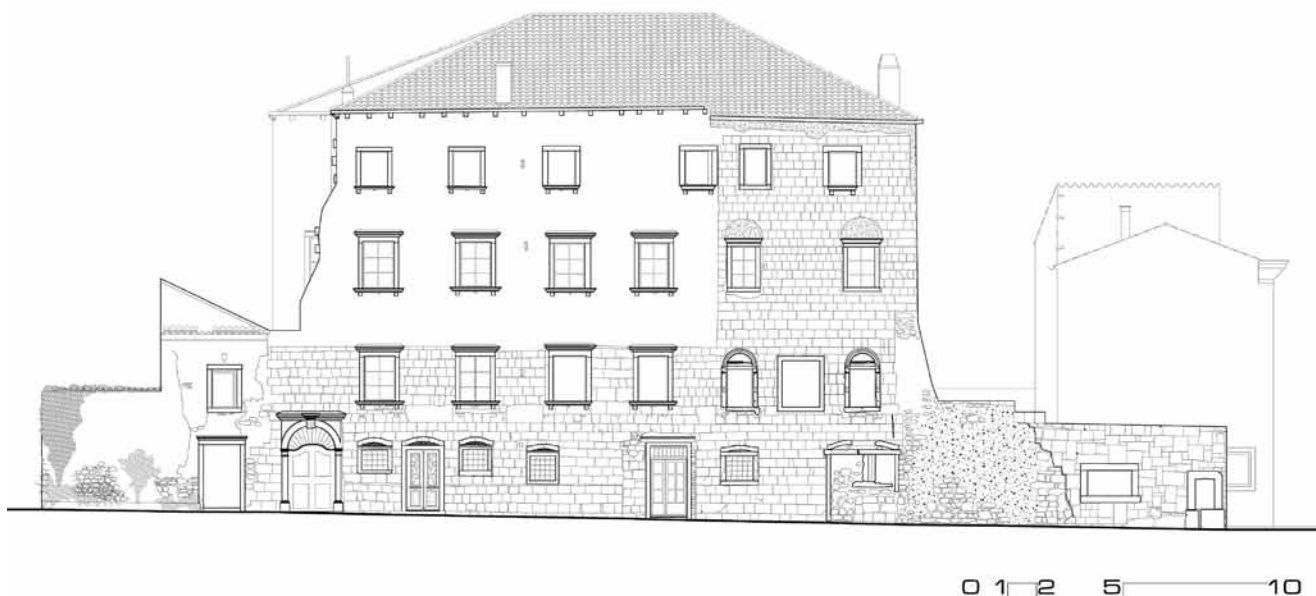
1. Sjeverno pročelje kuće Moise, snimak postojećeg stanja nakon konzervatorskih istraživanja

Riječ je o novom tipu stambenih građevina, gradskim kućama creskog plemstva koje gradi lokalna radionica formirana na izgradnji zborne crkve Sv. Marije Snježne. Tu su cresku klesarsku radionicu definirali Jasenka Gudelj i Laris Borić 13 analizom arhivskih dokumenata tragom ranijih autora. 14 Navedeni autori ističu niz imena majstora koji se u arhivskim dokumentima spominju kao magistri, muratori i lapicide , a u prvom redu su to članovi obitelji Marangon (Marangonich) i Giovanni da Bergamo, graditelj biskupske palače u Osoru. Gianna Duda Marinelli identificirala je protomagistra creske zborne crkve, Francesca Marangonicha ( Francesco magistro de la ditta fabbrica ), 15 što usvajaju i recentniji tekstovi o renesansnom graditeljstvu i kiparstvu na Kvarneru, u kojima se majstor Francesco ističe kao vodeći majstor creske kamenoklesarske radionice koja je bila aktivna i na ostalim kvarnerskim otocima. Marijan