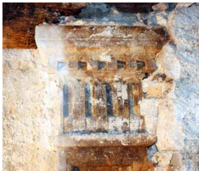
13. Stupac trijema utopljen u recentniji zid, stanje nakon uklanjanja žbuke

Pillar of the porch enveloped by a later wall, situation after the removal of the plaster