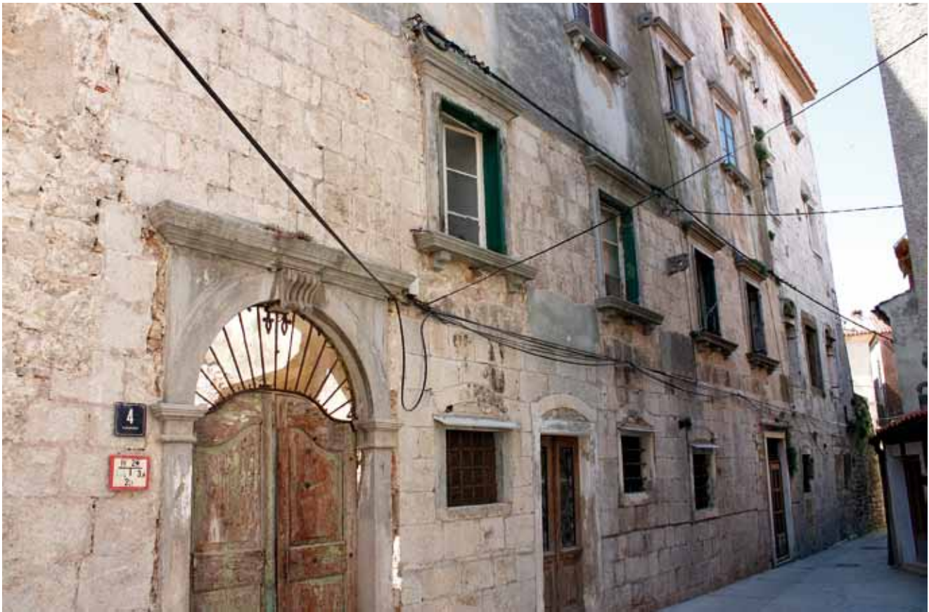
2. Sjeverno pročelje kuće Moise nakon konzervatorskih istraživanja The north front of the Moise house after the conservation works

Bradanović opisuje rad majstora Franje na Krku, a potom i na Rabu, navodeći da je „punu recepciju renesansnog stila u gradu Krku omogućio tek dolazak radionice okupljene oko majstora Franje, ranije formirane na susjednim osorskim i creskim gradilištima.” 16 Predrag Marković poistovjećuje creskog graditelja i klesara Francesca Marangona s istoimenim majstorom koji se uz Giovannija da Bergama spominje na gradnjama Maura Codussija u Veneciji i zaključuje da je riječ o arhivski potvrđenu lombardskom kamenoklesaru koji se doselio na Cres, unijevši prepoznatljive motive lombardsko-venetske rane renesanse na kvarnerske otoke. 17