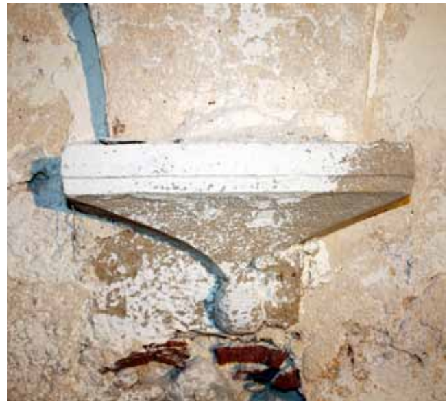
5. Svod prizemlja, peta susvodnice Vault on the ground floor, the springing of the vault rib

Na prvom austrijskome katastarskom planu iz 1821. godine, uz zapadno pročelje kuće smješteno je veliko ograđeno dvorište koje na planu iz 1873. godine biva prepolovljeno izgradnjom novije stambene građevine i stubišta, 33 a poslije potpuno anulirano izgradnjom prizemne gospodarske građevine. Već je na prvome katastarskom planu kuća razdijeljena u dvije nejednake katastarske čestice, od kojih zapadna odgovara dijelu kuće na čijim su pročeljima uglavnom zadržani renesansni arhitektonski elementi, a istočna čestica dijelu kuće koji