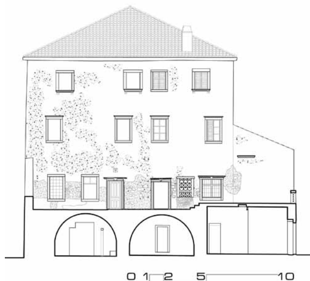
9. Zapadno pročelje kuće Moise - presjek kroz zapadno dvorište, snimak postojećeg stanja nakon konzervatorskih istraživanja

Prvi i drugi kat ponavljaju jednaku tlocrtnu shemu s trima prostorijama okrenutima prema sjevernome reprezentativnom pročelju (sl. 7). Te su prostorije razdijeljene nosivim zidovima, a nosivi zid proteže se i u pravcu istok – zapad, odjeljujući sjeverni i južni dio kuće. Budući da je nosivi zid izostavljen između središnje sjeverne prostorije i južnog dijela kuće na prvome i drugom katu, zaključuje se da je tlocrt bio koncipiran prema dobro poznatu principu središnje dvorane i četiriju bočnih prostorija ( ‘Quattro stanze, un salon’ ). Istražnim radovima ustanovljeno je da su na obama katovima povijesne komunikacije među prostorijama postavljene na istim pozicijama: središnja dvorana komunicira s bočnim sjevernim prostorijama aksijalno postavljenim vratima pomaknutim prema središtu kuće, a bočne prostorije međusobno komuniciraju vratima na istim