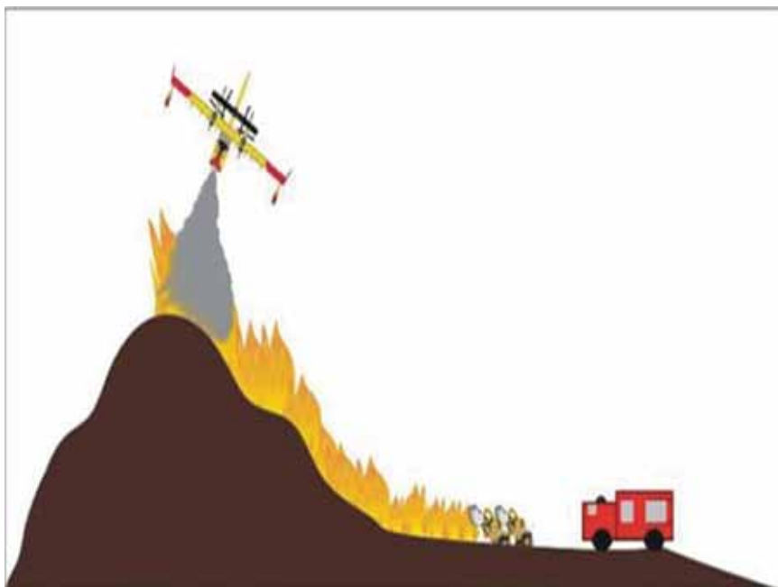
Slika 3. Potpora zemaljskim snagama na nepristupačnom području