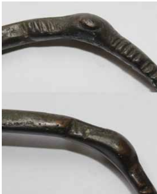
Sl. / Fig. 1: Detalj prednje i stražnje strane glave narukvice 1 / Details of the front and back of the head of bracelet 1

Nalazi iz razdoblja bjelobrdske kulture na vinkovačkom području nisu nepoznata. Prvi spomen potječe od J. Brunšmida, koji u opisu položaja i nalaza južne nekropole rimskih Cibala spominje i nalaze ulomaka dviju narukvica od tri pletene žice. 8 Nažalost, ovaj podatak nikad kasnije nije potvrđen, odnosno istraživanja na navedenim pozicijama posljednjih godina pokazuju izrazito rimski karakter navedenog nalazišta. 9 Na užem području grada ističe se dobro definiran lokalitet bjelobrdske kulture, a riječ je, naravno, o crkvi i groblju na položaju Meraja. Uz ostatke ranoromaničke crkve, datirane oko 1100. godine, tijekom arheoloških istraživanja 1965. godine istraženo je i 11 grobova priložima datiranih iz III. faze bjelobrdske kulture. 10 Tijekom arheoloških istraživanja 1997. i 1998. godine na istom