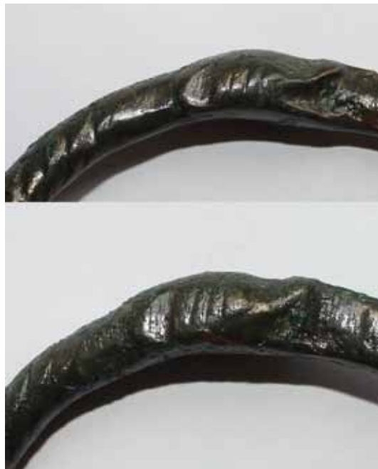
Sl. / Fig. 2: Detalj prednje i stražnje strane glave narukvice 2 / Details of the front and back of the head of bracelet 2

Finds from the period of the Bijelo Brdo Culture are not unknown in the territory of Vinkovci. They were first brought up by J. Brunšmid, who mentioned the discovery of fragments of two bracelets made of three plaited wires in his description of the location of, and finds from, the southern necropolis of Roman Cibalae. 8 Unfortunately, this information has never been confirmed, and the exploration of the cited positions made in recent years demonstrates that the site has a pronounced Roman character. 9 In the central area of the town, a well-defined site of the Bijelo Brdo Culture stands out in the area of the church and cemetery of Meraja. In addition to the remains of an Early Romanesque church dated to around 1100, the archaeological excavation of 1965 encompassed 11 graves dated, on the basis of discovered grave goods, to phase III of the Bijelo Brdo