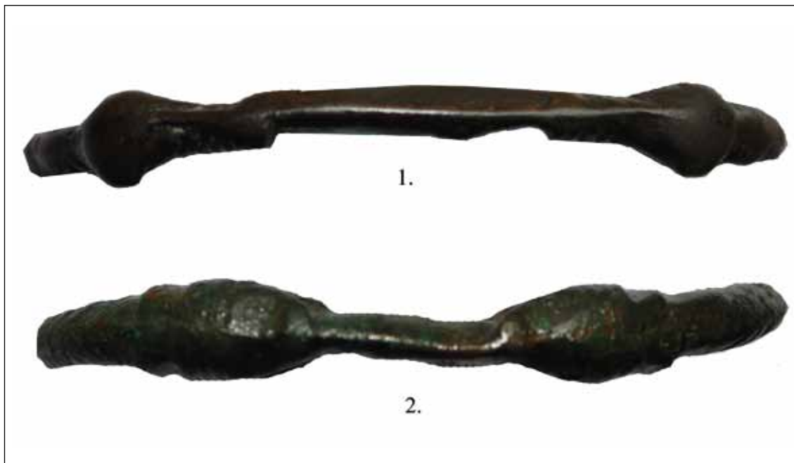
Sl. / Fig. 3: Pogled odozgo na narukvice 1 i 2 / View from above of bracelets 1 and 2

lokalitetu otkriveno je još 5 bjelobrdskih grobova. 11 Istovremeno s ovim grobljem, nalazima nasebinske keramike tijekom zaštitnih arheoloških istraživanja u današnjoj Dugoj ulici na kućnim brojevima 40, 46 i 51, potvrđeno je i naselje. 12 Na širem području grada kao bjelobrdski lokalitet navodi se još i »Crkvište« na Borincima, 13 koje je nedavno revidirano, s mogućnošću pripadnosti ovog lokaliteta i bjelobrdskom horizontu. 14