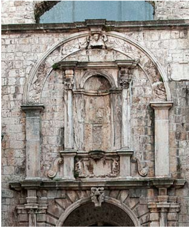
Niša nad glavnim ulazom u Korčulu

nišama. Na vrhu luk ima podebljanje s donje strane koje upućuje na to da je unutrašnjost polukupole bila ukrašena motivom školjke. Središnji dio čela luka veće je debljine te je na taj način naglašen kao zaglavni kamen, a urezi koji se tu vide oblikuju usta, brkove i bradu te upućuju na ukras u obliku muške glave. Na lijevom kraju luka vidi se pasica širine 2 cm koja ga je uokvirivala sa svih strana. Ukras same plohe luka je nečitljiv. Profilacija kapitela i baze također nije sačuvana. Kako kapitel ne prelazi bočno unutarnju vertikalnu liniju niše, izgleda da ni čeonu nije bio izbačen. Na bočnim pilastrima ipak se mogu nazrijeti ukrasi. Tako su u gornjem dijelu vanjskog lijevog pilastra sačuvani dijelovi ovala od glatke trake s kopčom i tragovi još triju ovala ispod njega. Na desnom unutarnjem pilastru, na samom dnu, vidi se rozeta, a iznad nje se naziru vitice s cvjetovima. S obje strane ranoromaničkog mramornog ulomka, koji se nalazi iznad niše, položene su simetrično dvije volute S-oblika. Na dnu desne volute nazire se ukras rozete. Po sredini obje volute uočava se zadebljanje, koje vjerojatno predstavlja mali ukras koji nalazimo npr. na volutama kapitela trijema Sorkočevićeva ljetnikovca u Gružu. Žbukano područje, koje se u visini od 10 cm proteže na vrhu cijele kompozicije, vjerojatno je položaj završnog vijenca.