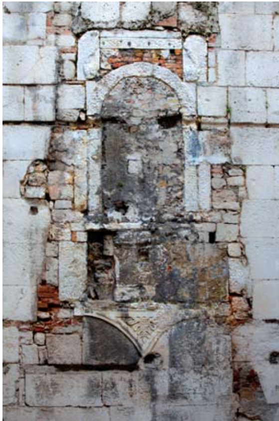
Niša na sjevernom zidu obrambenog dvorišta zapadnih vrata Dioklecijanove palače

Mramorni ulomak iznad niše dekoriran viticama prepoznaje kao ranoromanički mramorni pilastar iz 11. stoljeća, koji je vjerojatno pripadao oltarnoj pregradi u crkvi sv. Teodora, a desno od njega uočava i mali mramorni fragment sa starokršćanskim križem. 7 Iznad same niše, s donje strane jednog antičkog bloka, vidi se mali otvor polukružnog oblika koji predstavlja vrh uskog antičkog otvora koji je nekada osvjetljavao antičko stubište položeno s druge strane istog zida. Prilikom izgradnje dućana, uz taj zid temeljito su otklesani ukrasi čeonih ploha kamenog okvira niše, osim trokutastog ukrasa ispod nje sa smokvinim listom te spomenutog ranoromaničkog mramornog pilastra iznad nje. Međutim, pažljivim proučavanjem i dodatnom obradom fotografija, mogu se uočiti ukrasi gotovo svih kamenih elemenata koji daju dovoljno. Zazidana niša nalazi se točno u osi sjevernog zida obrambenog dvorišta i u njoj je vjerojatno stajao kip, a ispod nje se nalazi oštećena ploča na kojoj je bio natpis ili reljef. Za usporedbu, takva se slična kompozicija može vidjeti u Korčuli nad glavnim ulazom u grad s unutarnje strane.