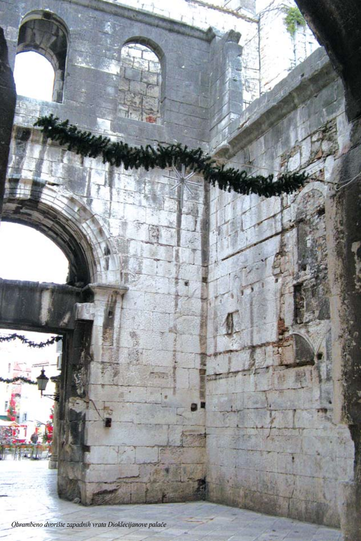
Obrambeno dvorište zapadnih vrata Dioklecijanove palače