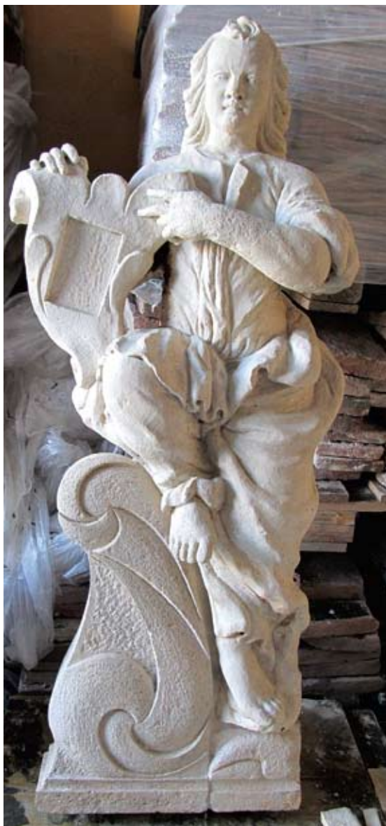
Skulptura anđela s južnog portala nakon spajanja

Spajanje razdvojenih dijelova skulptura anđela i Boga Oca, kao i dijelova vaza obavljeno je povezivanjem rebrastim šipkama od inoksa, promjera 5 mm, uz lijepljenje ljepilom epoxy. 9 Inoks je pogodan materijal u spajanju dijelova umjetnina jer je vrlo otporan na utjecaje atmosferilija. Površine su prije nanošenja ljepila temeljito očišćene kako bi se osiguralo što učinkovitije lijepljenje.