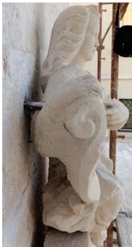
Korodirani željezni nosač skulpture