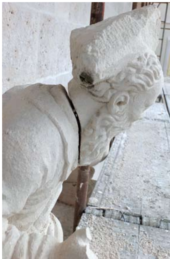
Oštećenje skulpture Boga Oca

od prirodne patine 6 koja predstavlja njegovu prirodnu zaštitu od utjecaja atmosferilija. Razlikujemo primarnu i sekundarnu patinu koje se razlikuju po načinu nastanka. Primarna patina nastaje otapanjem soli u kamenolomskoj vlazi, dok sekundarna patina nastaje djelovanjem ugljičnog dioksida iz kiše što otapa vapnenac i pretvara ga u topljivi hidrokarbonat, koji potom neposredno ispod epiderme kristalizira u pornom prostoru.