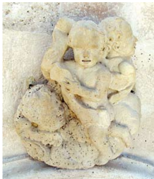
Grupa anđela iznad rozete nakon konzervatorsko-restauratorskog postupka

Na velikoj vazi koja se nalazi s južne strane skulpture Boga Oca, rekonstruiran je gornji dio, tučak, izradom gipsanog otisaka sa vaze koja se nalazi sa zapadne strane skulpture Boga Oca.