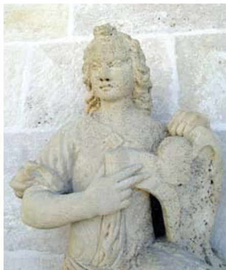
Skulpture anđela iznad sjevernog i južnog portala nakon konzervatorsko-restauratorskog postupka