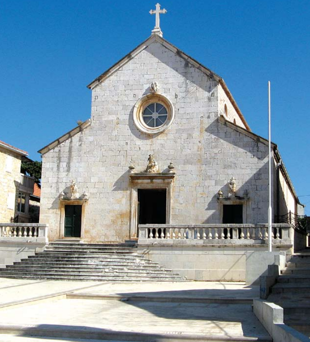
Zapadno pročelje župne crkve sv. Petra