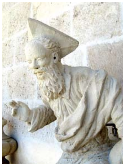
Skulptura Boga Oca nakon konzervatorsko-restauratorskog postupka