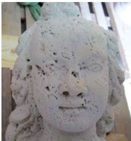
Škrapavost površine kamena