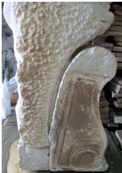
Poleđina anđela s južnog portala pokrivena skramama. Isklesana voluta je sekundarno upotrebljena

Poleđine skulptura i uvučeni dijelovi reljefa prekriveni su smeđim i crnim skramama koje nastaju taloženjem nečistoća iz okoliša. Skrame predstavljaju strano tijelo na epidermi kamena. Izuzetno je bitno razlikovati nečistoću u obliku skrama na kamenu