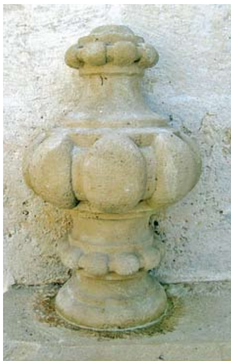
Rekonstruirana oštećenja vaze