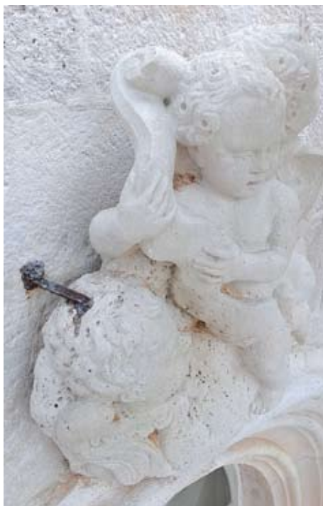
Reljef anđela iznad rozete

Umjetnine smještene na otvorenom prostoru direktno su izložene utjecaju likvidne vlage, kiše. 2 Voda je jedan od osnovnih čimbenika i pratilac gotovo svih degradacijskih procesa na kamenu, a njezino štetno djelovanje očituje se nizom raznolikih procesa propadanja kamena i drugih materijala u njemu integriranih. Na njezino primanje,