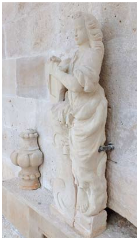
Skulptura anđela iznad južnog, bočnog portala

Glavni portal crkve sv. Petra ukrašen je skulpturom Boga Oca i dvije veće vaze, a oba bočna portala jednom skulpturom anđela i dvije manje vaze, izradene od bračkog kamena vapnenca. Vaze su oblikovane po uzoru na srebrene uljne svjetiljke s ispupčenjima po trбуhu koje gore u interijeru crkve kao vječno svjetlo.