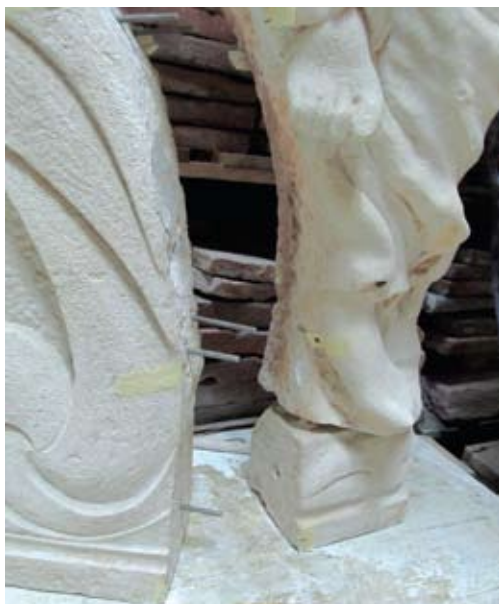
Anđeo s južnog portala, povezivanje dijelova skulpture inoks šipkama