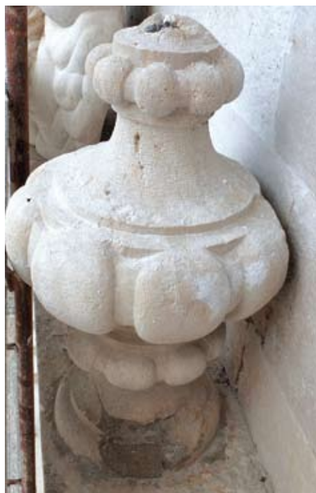
Oštećenja prouzročena ekspanzijom željeznih klinova