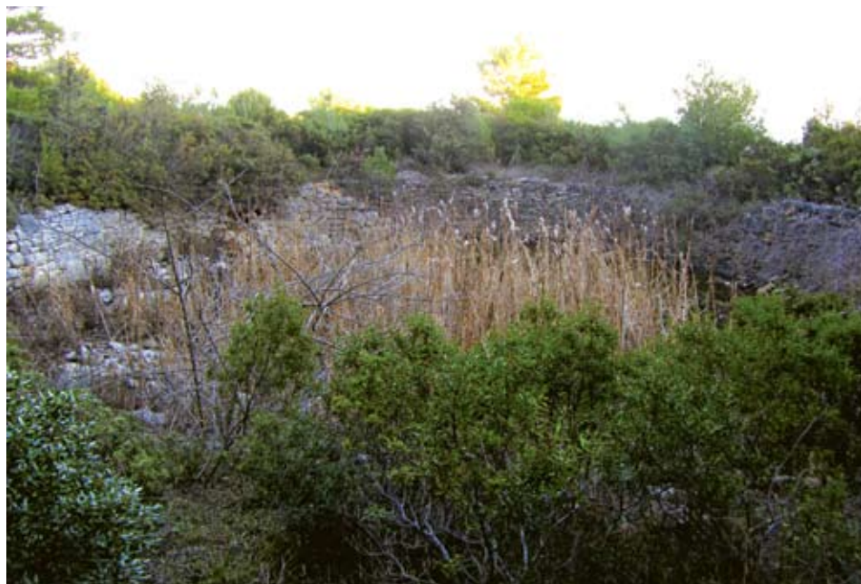
Sl. 9. Prije čišćenja 2013. godine