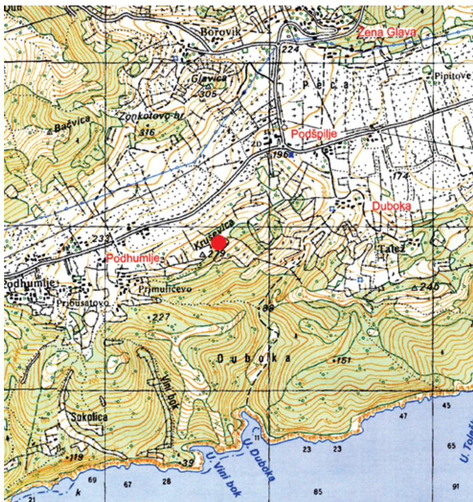
Sl. 3. Položaj Krušovice u odnosu na okolna naselja

i obzidana, a dno joj je pokriveno kamenim pločama pa je s novom funkcijom poprimila i građevinske karakteristike bunara. Do vode se silazi kamenim stubama izgrađenim na južnoj, istočnoj i zapadnoj strani u smjeru pružanja zidova. Činjenica da je lokvi 14 na Krušovici dan poseban katastarski broj (čestica) i da je na katastarskoj karti iz 1834. godine zabilježena plavom bojom, upućuje na to da je ona obzidana prije (ili u vrijeme) izrade austrijskog katastra. Do lokve vode tri puta omeđena suhozidnim ogradama - sa zapada iz Podhumlja, s istoka iz Duboke i sa sjevera odvojak glavnog otočkog puta kojim na Krušovicu prilaze stanovnici Žene Glave. Od lokve do Primulićevo, najbližeg zaseoka Podhumlja, može se stići za pola sata. Nepravilnog je kružnog oblika, duljeg promjera od 15 metara i dubine oko 2,5 metra. Zidovi kojima je obzidana nisu vertikalni, skošeni su prema obodu, a izgrađeni su usuhu od grubo obrađenih kamenih blokova, nizanjem u