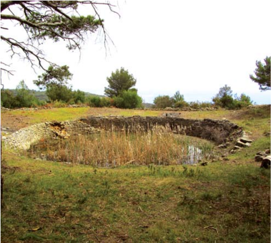
Sl. 4. Krušovica, pogled sa sjevera

horizontalnim redovima. Posebno su dva gornja, završna reda izvedena iz pravilnih velikih blokova položenih tako da gornja ploha završnog prstena tvori kosu krunu, nagnutu prema okolnom terenu. Stube su izgrađene iz velikih blokova te je svaka od njih izvedena iz jednog jedinog komada (sl. 4, sl. 5, sl. 6, sl. 7).