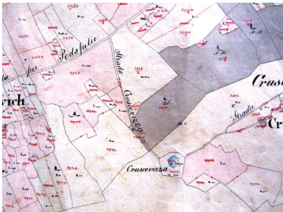
Sl. 2. Krušovica na listu austrijske katastarske izmjere iz 1834. godine (Comisa, Fog. XXIII)

proizvode, austrijska je uprava provela izmjeru zemljišta na čitavom teritoriju Monarhije, čime je uspostavljen prvi stabilni katastar. Na otoku Visu formirane su dvije katastarske općine, Vis i Komiža. Nakon izmjere terena 1834. godine, za područje Komiže izrađen je 31 detaljni list u kojem su ucrtane sve čestice zemlje i čestice građevina u mjerilu 1:2880, a za katastarsku općinu Vis je 1835. godine izrađeno 35 listova. Nakon kartiranja, napravljeni su upisnici čestica zemlje i upisnici čestica zgrada te elaborat porezne procjene. 6 Katastarske karte, upisnici čestica zemlje i čestica zgrada, a naročito operati porezne procjene sadrže dragocjene povijesne podatke o socijalnim, demografskim i ekonomskim prilikama pojedine katastarske općine, odnosno, o načinu života i organizaciji prostora u prvoj polovici XIX. stoljeća.