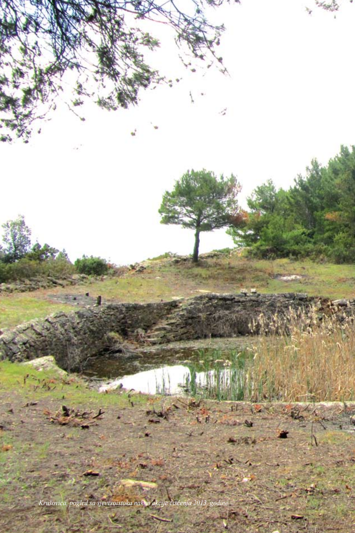
Krušovica, pogled sa sjeveroistoka nakon akcije čišćenja 2013. godine