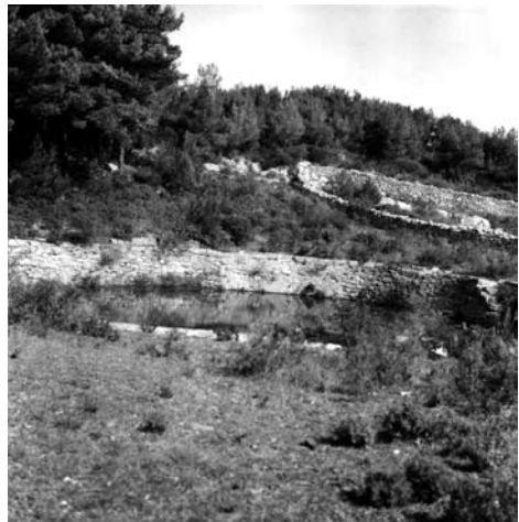
Sl. 8. Stanje 1978. godine