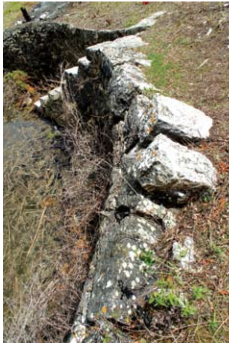
Sl. 6. Kruna zida

tradicijske arhitekture malo toga sačuvano. Zbog promjena načina života i privređivanja, došlo je do napuštanja ruralnih područja te su tradicijske građevine izložene propadanju čime su izgubile izvorne značajke i spomeničku vrijednost.