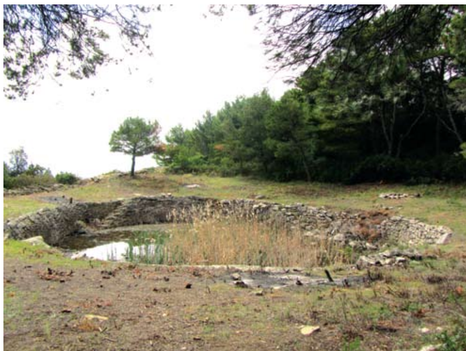
Sl. 10. Krušovica, pogled sa sjeveroistoka nakon akcije čišćenja 2013. godine