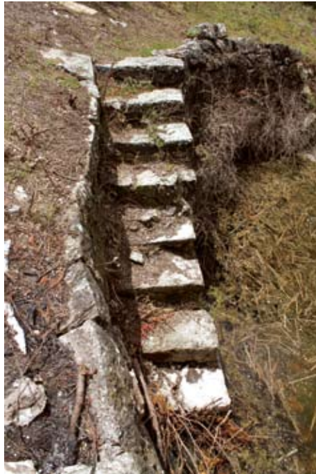
Sl. 5. Stube na južnoj strani

Krušovica je unikatan spomenik tradicijskog graditeljstva na otoku Visu. Svojim nazivom lokva koji se sačuvao u narodu svjedoči o davnoj prošlosti otoka u kojoj je danas zaboravljeno stočarstvo bilo značajna grana privređivanja, a svojim oblikom svjedoči o transformacijama otočke ekonomije polovicom devetnaestog stoljeća u kojima je u novoj funkciji bunara imala značajno mjesto u tradicijskoj kulturi komiških pojora . 15