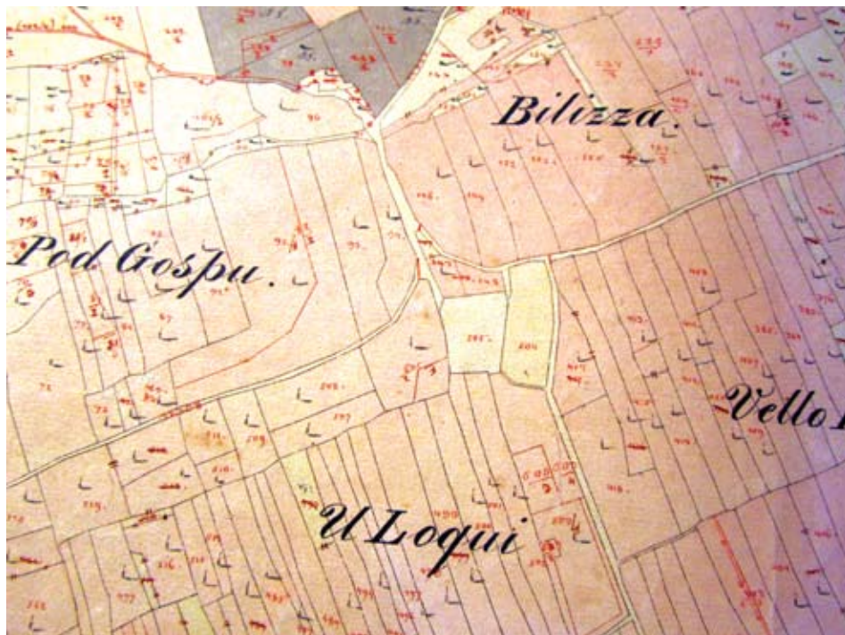
Sl. 1. Lokva u Velom polju na listu austrijske katastarske izmjere iz 1835. godine (Lissa, Fog. XXIII)

U ranom srednjem vijeku stanovnici otoka bavili su se i ribarstvom. Već u XVI. stoljeću ribarstvo je u komiškome prostoru preraslo u najznačajniju grana privređivanja.