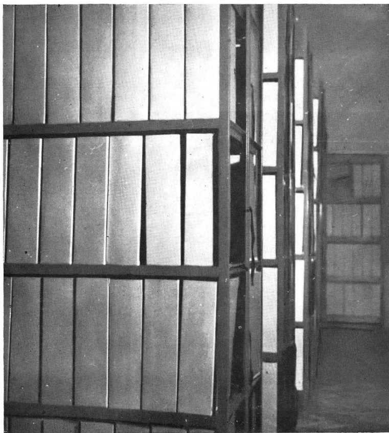
Sl. 2 — Spremište grade

Z. Krnić: O radu Historijskog arhiva u Slavonskom Brodu u 1959. godini