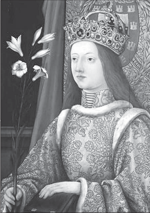
Sl. 1. Leonor Portugalska. Carica nosi krunu sa svoje krunidbe 1452. Na rukonaslonu su prikazani grbovi Austrije i Portugala. Haljina: talijanski baršun s uzorkom šipka. Hans Burgkmair Stariji (1473. - 1531.) – Portraitgalerie, Schloss Ambras, Inv. 4399, Innsbruck