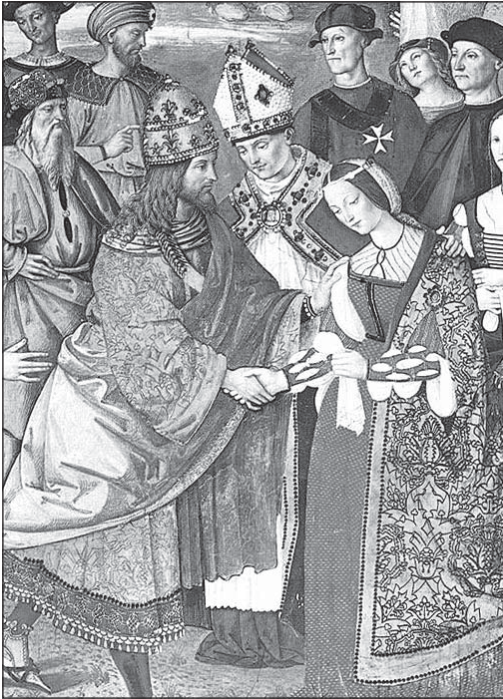
Sl. 3. Enea Silvio Piccolomini predstavlja Friedrichu III. mladenku, Leonor od Portugala. Bernardino di Betto, zvan Pinturicchio (1454. – 1513.) – Ciklus fresaka o životu i djelima Eneja Silvija Piccolominija, kasnijeg pape Pija II., u katedralnoj biblioteci u Sieni, nastao između 1502. i 1507. Pinturicchio je prikazao, uz korištenje odjeće svojeg vremena, vjernu scenu prvog susreta Friedricha i Leonor