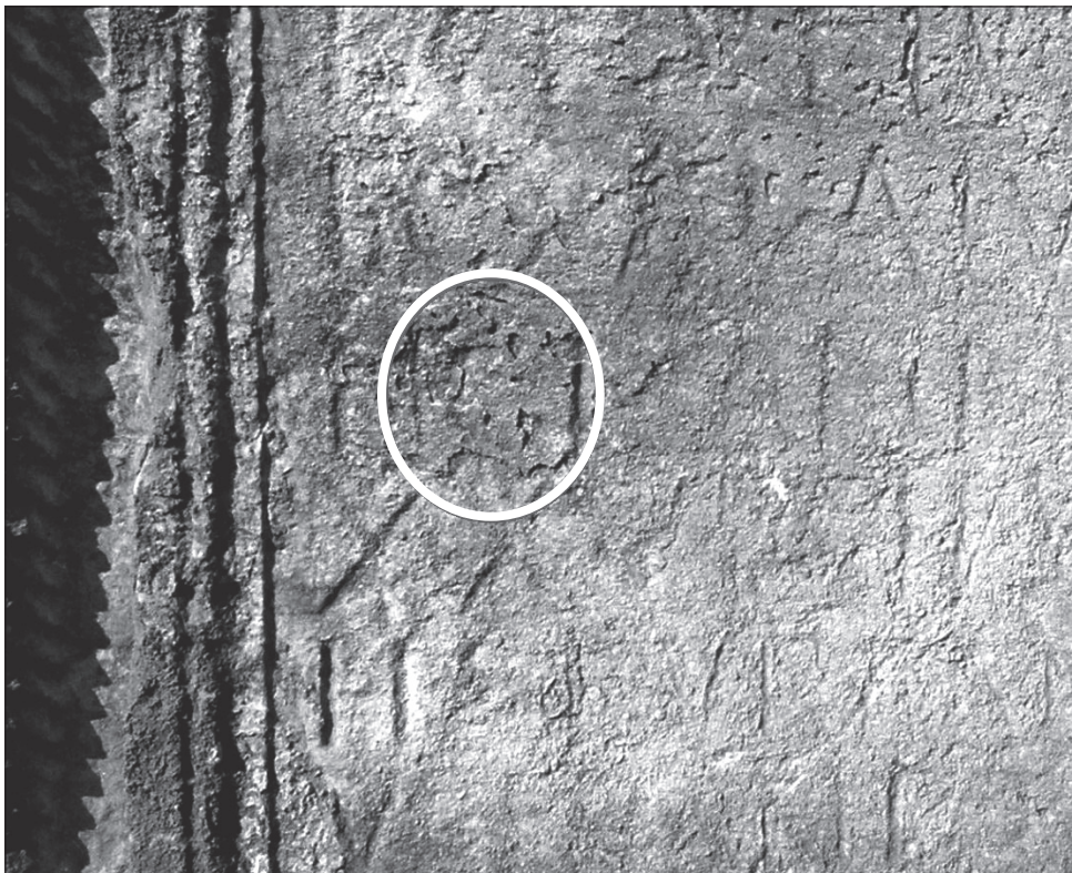
Slika 5. Detalj slova G u 5. retku natpisa