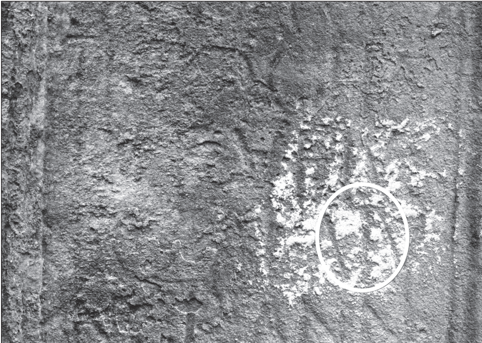
Slika 4. Detalj slova T u 4. retku natpisa