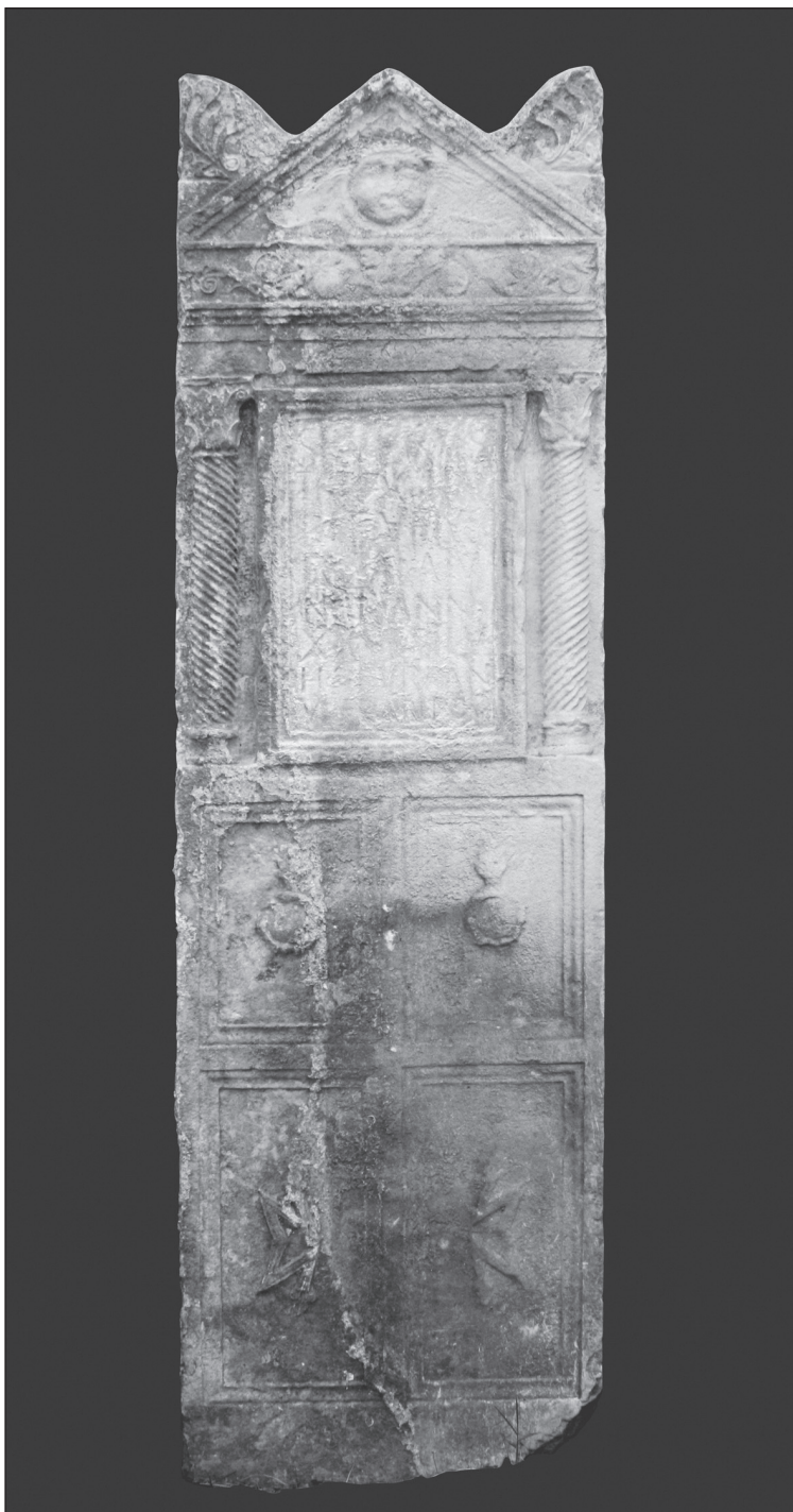
Slika 1. Severova stela iz Dugopolja