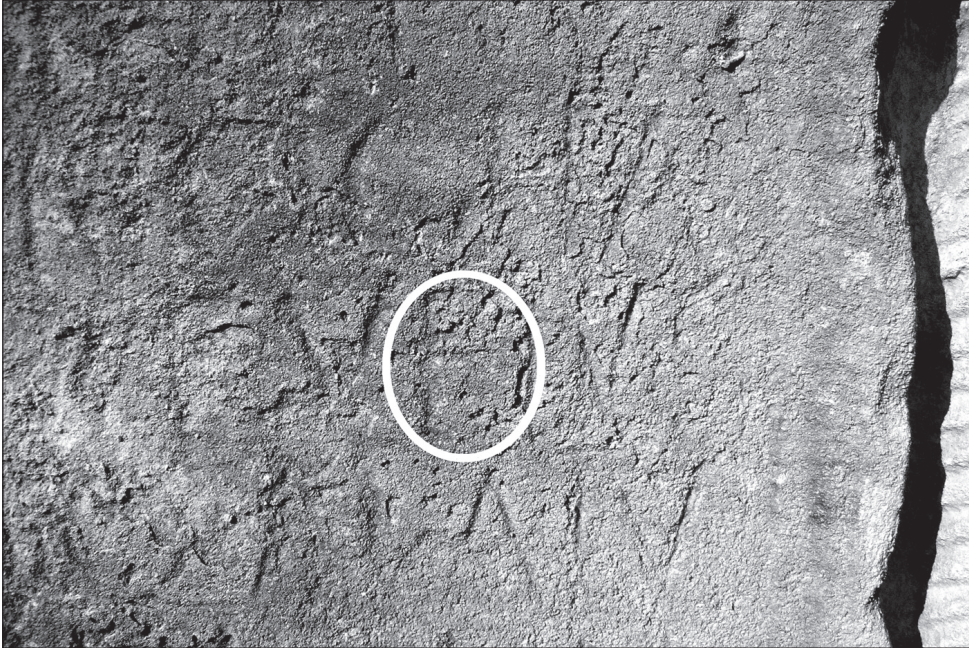
Slika 3. Detalj slova B u 3. retku natpisa