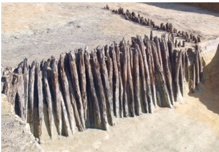
Sl. 3. Istražene oblice u stabilizaciji starije faze "Đurđevačkog" bastiona koprivničke tvrđave.

lom postupno nastaje ratna bastionska tvrđava. O razvoju koprivničkog utvrđenja i razlozima njenog nastanka do sada je također pisano više puta pa će se taj dio preskočiti, 13 a više prostora dat će se rezultatima nedavno provedenih arheoloških iskopavanja na jedinom očuvanom dijelu koprivničke tvrđave - tzv. "bašči", provedenih tijekom 2012. i 2013. godine. 14