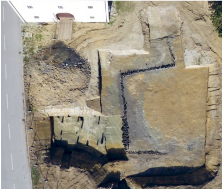
Sl. 4. Pogled iz zraka na istraženu sondu 2013. godine sa starijom fazom "Đurđevačkog" bastiona i drvenim mostom koprivničke tvrđave.

osnovnim tlocrtnim gabaritima. Oblice su primijećene na visini \nabla 137,83 m, pojedine su i bolje (više) očuvane, no kako i prirodna konfiguracija terena pada prema jugu tako se i one nalaze na manjoj apsolutnoj visini: kod jugozapadnog proširenja sonde prosječno se pojavljuju na oko \nabla 137,46 m, a na južnom dijelu na \nabla 136,95 m. Oblice su izrađene od hrastovih grana promjera od 12 do 19 cm, dužine su od 2,2 do 2,5 m, a pri dnu su sve bile zašiljene. Iskopavanjima je prepoznato kako su zabilježene u zdravu zemlju na oko 0,9 m dubine, a položene su pod kutom od 15^\circ . Tlocrtno su se pratile od sjeveroistočnog dijela sonde. Ukupno 51 oblica u dvostrukom nizu dužine 6,91 m proteže se od sjevera prema jugu s otklonom od 12,84^\circ prema zapadu, potom zapadni niz dužine 11,82 m čini 98 oblica otklona pod kutom od 14,15^\circ prema jugu, zatim u dužini od 16,69 m niz od čak 144 oblica ima otklon od 8,01^\circ prema zapadu i na kraju prema vrhu bastiona na istoku u dužini od 6,15 m istražen je niz od 61 oblice s minimalnim otklonom od tek 1,38^\circ . Ukupno je tako dokumentirano čak 354 drvenih oblica starije faze bastiona, od kojih je 44 istraženo u cijelosti od vrha do šiljka (dna).