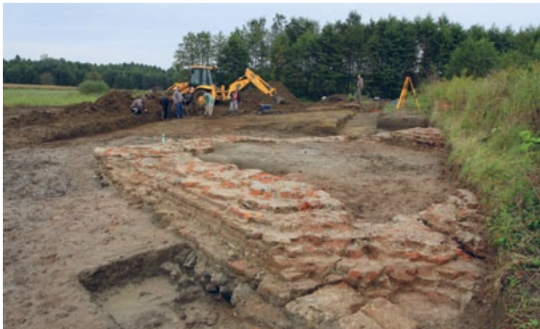
Sl. 5. Tijek arheoloških radova na lokalitetu Gorbonok u Kloštru Podravskom 2014. godine.