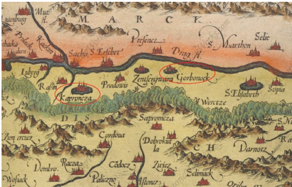
SI. 1. Laziusova karta nastala oko 1595. godine s prikazom Koprivnice i Gorbonoka.