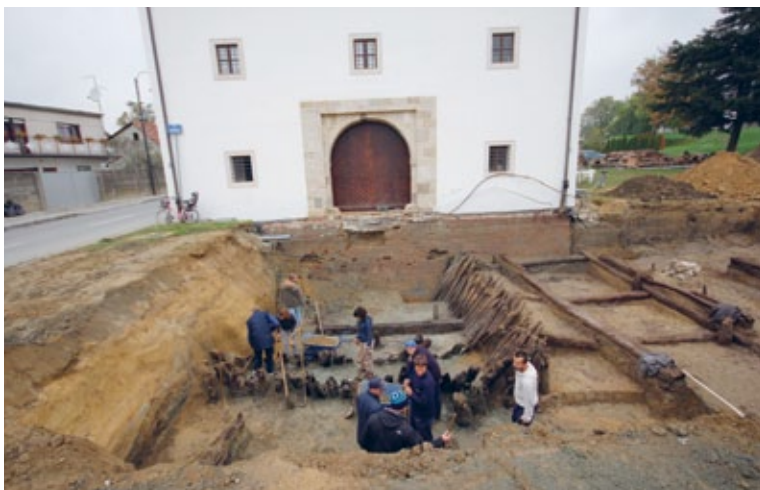
Sl. 2. Arheološka iskopavanja pred koprivničkim južnim Gradskim vratima 2012. godine.