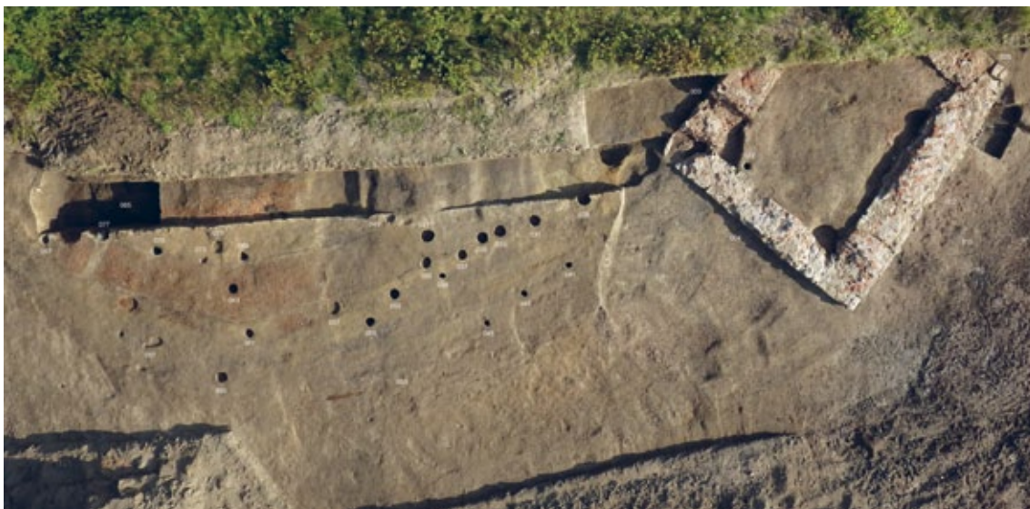
Sl. 6. Pogled iz zraka na istraženi Sektor 1 na Gorbonoku s istraženom zapadnom kulom i polukružnim bedemskim plaštom.

(SJ), a koje se odnose na nepokretne strukture poput zidova, slojeva, ukopa drvenih stupova i nekih drugih drvenih konstrukcija.