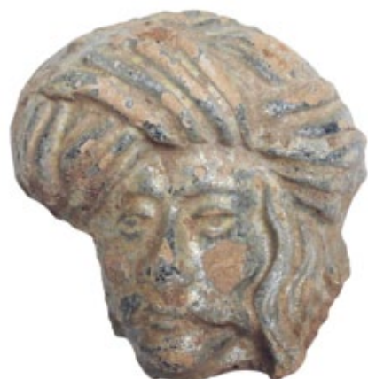
SI. 8. Slučajni površinski nalaz ulomka pećnjaka (6,8 x 5,9 cm) s prikazom glave Osmanlije na Gorbonoku (, 25. 11. 2014.).