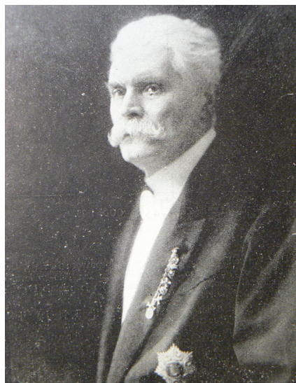
Slika 7. Hermann Helmer, projektant kazališta

Zgrada Hrvatskog narodnog kazališta u Varaždinu vrijedno je arhitektonsko zdanje druge polovice 19. stoljeća. Djelo je Hermanna Gotlieba Helmera (Hamburg, 1849. - Beč, 1919.), jednog od najznačajnijih europskih arhitekata (sl. 7) toga vremena, specijaliziranog za oblikovanje kazališnih zgrada. U svojim je projektima primjenjivao historicističke oblike imitirajući građevne forme renesanse, baroka i rokokoja. Zajedno s arhitektom Fellnerom vodio je u Beču poznatu građevinsku tvrtku koja je na pro-