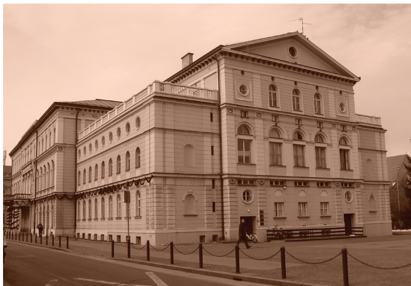
Slika 6. Kazalište s nadogradnjom Aleksandra Freudenreicha

na su tri lučno svedena ulaza u prizemlju, a otvorena dva nova. U prizemlju su otvorena i tri prozora, dok su nekadašnje niše s kipovima na prvom katu providene velikim prozorima kojima su dodana još dva nova. Ponutrica kazališne zgrade preuređena je u toj obnovi novim oblikovanjem donjeg dijela gledališta, kiparskim, štukaterskim, slikarskim i dekoraterskim radovima.