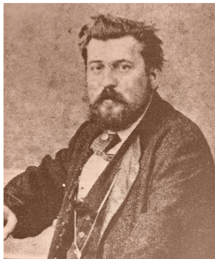
Slika 8. Janko Jambrišak, graditelj kazališta

Zgradu varaždinskog kazališta podigao je po Helmerovom nacrtu najplodniji zagrebački graditelj druge polovice 19. stoljeća (sl. 8) Janko Jambrišak (Karlovac, 1834. -Zagreb, 1892.). U izgradnji kazališta i u opremanju njegove raskošne ponutrice uz njega, gradačkih, bečkih i mariborskih majstora sudjelovali su i neki poznati varaždinski obrtnici od kojih su najpoznatiji Goger, Sohnel, Gortan i Grims. Jambrišak je sagradio brojne zgrade u zagrebačkom Donjem gradu, te ljetnikovce na zagrebačkoj periferiji od kojih je najpoznatiji Okrugljak. Bio je istaknuti član Kluba inžinirah i arhitektah. O njegovom sudjelovanju u izgradnji kazališta svjedoči već spomenuta spomen ploča na ulaznom stubištu.