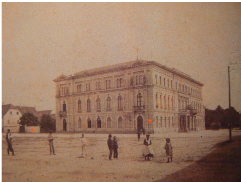
Slika 1. Varaždinsko gradsko kazalište, 1875.

mnazije nalazila kazališna dvorana i kako je izgledala. Danas još postojeća zidana zgrada nekadašnje isusovačke gimnazije pregrađivana je više puta, pa je njezin unutrašnji prostor posve drugačiji nego u vrijeme izgradnje.