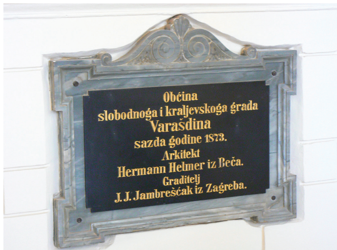
Slika 3. Spomen ploča na ulaznom stubištu kazališta

ali preobilno pozlaćeni. Na pročelju kazališta koje je prekrasno uredio Halleker iz Maribora, nalazi se grb grada Varaždina. Na pročelju diplomatske lože-na desnoj strani tik pozornice-stoji grb Trojedne Kraljevine s hrvatskom krunom. Kazalište ima 34 lože, pred gledalištem nalazi se na prvom katu krasno hladilište (foyer), u zimsko doba zatvoreno, a ljeti otvoreno s velikim balkonom, te s izgledom na šetališnu ulicu. Do toga se hladilišta dolazi glavnim ulazom po širokim marmornim dvorednim skalinama. Na svakoj strani gledališta nalaze se u prizemlju skladišta za dekoracije, a u prvom polukatu garderobe za glumce. Prizemlje pak pred gledalištem zapremaju velike i krasne prostorije kavane, gostionice i kuhinje. Prvu stranu kazališne zgrade prema Kapucinskom trgu u prvom i drugom katu zauzima velika plesna dvorana (sl. 4), prebogato urešena. Do nje na lijevoj strani u prvom katu nalaze se velike prostorije "Kasina", a u drugom katu tri lijepe velike galerije. Do njih su stanovi kazališnog ravnatelja i kućnog nadglednika, te jedan privatni stan".