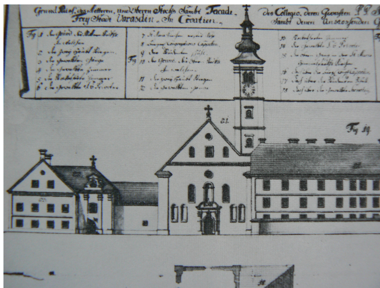
Slika 2. Isusovački kompleks s kapelicom Njemačke kongregacije, 1776.

jućih družina održavale su se u toj dvorani. Prilikom svake predstave morala se improvizirati pozornica za koju su kulise izrađivali sami glumci. Kad su kazališne priredbe u redutoj dvorani postale učestalije, počeli su Varaždinci dvoranu i nazivati kazalištem. I danas postojeća zgrada u Kranjčevićевой ulici broj 4 je i nakon izgradnje nove kazališne zgrade 1873. godine na prostoru nekadašnjeg južnog gradskog grabišta ostala u svijesti ljudi kao kazališna, pa je i nazivana Staro kazalište, a sama se ulica nazivala Starokazališna ulica.