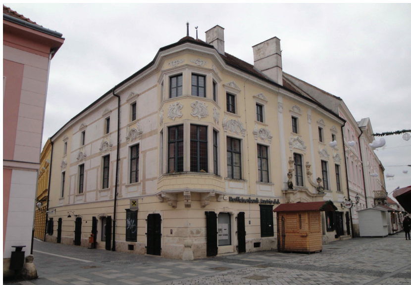
Slika 2. Palača Patačić

Padovca , poznatoga varaždinskog skladatelja i gitarista, iz 18. stoljeća. 8 Njezinim se prostorima trenutno koriste Turistička zajednica grada Varaždina te Turistički informativni centar.