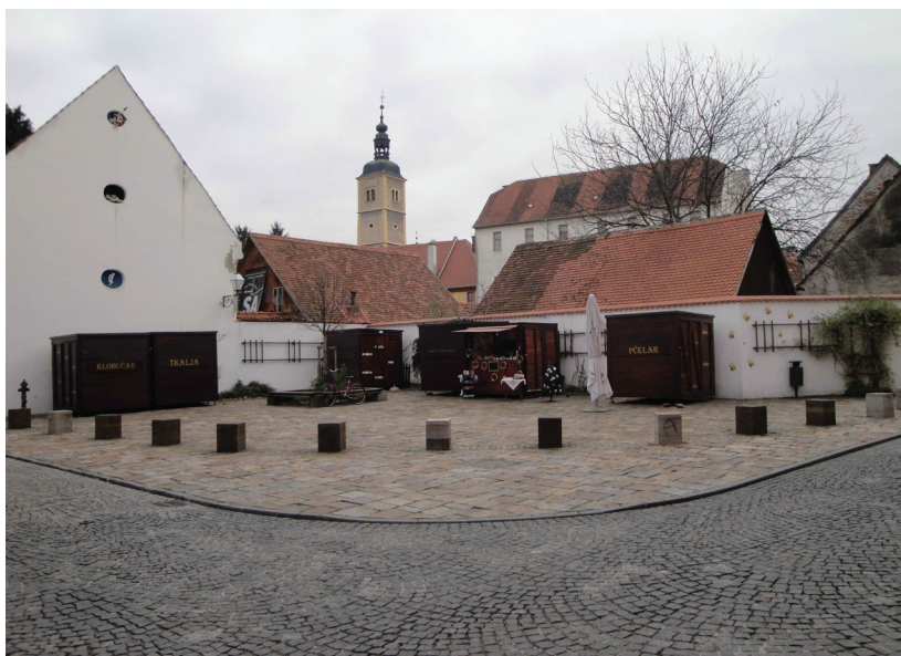
Slika 10. Trg tradicijskih obrta

Sljedeći projekt, koji svakako valja uzeti u obzir kada je riječ o promicanju turizma u gradu, obuhvaćen je idejom prezentiranja Varaždina kao tradicionalnoga obrtničkog i trgovačkog grada. U cilju takva predstavljanja otvoren je Trg tradicijskih obrta nadomak uršulinskoj crkvi. Riječ je o najnovijem trgu u gradu na kojemu se mogu pronaći proizvodi tradicionalnih obrtnika poput klobučara, tkalje ili lončara i doživjeti grad kakav je nekad bio.