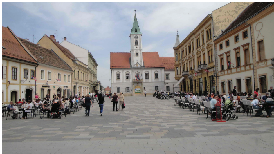
Slika 7. Glavni gradski trg - Korzo

Među najznačajnija šetališta u gradu zasigurno se ubraja Strossmayerovo šetalište s kompleksom Staroga grada te obrambenom ulaznom Kulom-stražarnicom i zgradom Oružarne (Žitnice grofova Celjskih). 30 Svakako valja spomenuti i Šetalište Vatroslava Jagića , zamišljeno u engleskome stilu, te Park Ivana Pavla II. s vodenim motivom - imitacijom rijeke Drave. 31 Posebnu pozornost mami Varaždinsko groblje 32 , utemeljeno 1773., a nastalo prema zamislima Hermana Hallera. Groblje je spomenik parkovne arhitekture, a zaštićeno je i Zakonom o zaštiti spomenika kulture. Puno je aleja, staza i prolaza koji vode do nadgrobničkih spomenika. 1961. na groblju je izgrađena i spomen-kosturnica za antifašističke borce i ostale žrtve fašizma. Nakon sahrane Vatroslava Jagića 1923., bečki su novinari prvi puta opisali ljepotu Varaždinskoga groblja, na kojem su na svoj vječni počinak ispraćena brojna poznata lica varaždinske i hrvatske prošlosti poput Zvonka Milkovića, Franje Koščeca, Miljenka Stančić i Ivana Režeka. Ulicu, koja iz gradske jezgre vodi prema groblju, Varaždinci su nazvali Hallerovom alejom i time Hermanu Halleru odali počast za njegov rad. 33