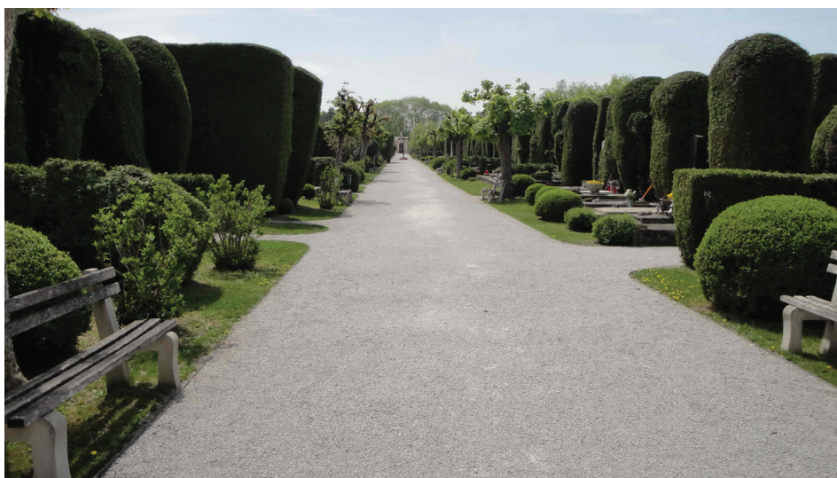
Slika 9. Varaždinsko gradsko groblje