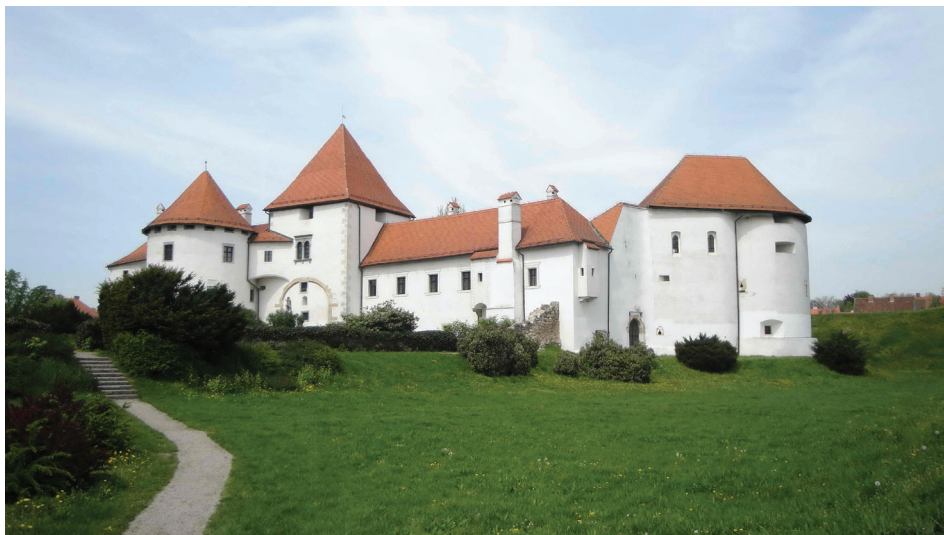
Slika 1. Varaždinska utvrda Stari grad

U arhitekturi grada posebno se ističu brojne palače te vrijedne kuće i vile. Među najznačajnijima je dvokatna palača Patačić , izgrađena u 18. stoljeću, a smatra se najvrjednijom rokoko palačom u Varaždinu i Hrvatskoj. Posebno valja spomenuti i palaču Drašković , u kojoj je zasjedao Hrvatski sabor, palaču Prassinsky-Sermage izgrađenu najvećim dijelom u baroknome te palaču Herczer u kasnobaroknome i klasicističkome stilu, kao i palaču Erdödy-Patačić u stilu marijaterzijanskoga baroka u kojoj je trenutno smještena varaždinska Glazbena škola. 7 Na popisu značajnijih kuća i vila nezaobilazna je kuća Ritz-Friedrich smještena na uglu Trga kralja Tomislava, glavnoga varaždinskog trga, i Franjevačkoga trga. Kuća se ubraja među najznačajnije objekte grada iz 16. stoljeća. Vila Müller-Bedeković , izgrađena nasuprot gradskome perivoju, važan je primjer klasicističke arhitekture sa skladnim stupovima i zavojitim stubama s obje strane objekta. U njoj je trenutno smješten Odjel za djecu i stranu literaturu Gradske knjižnice. U užoj gradskoj jezgri od velike je važnosti i rodna kuća Ivana