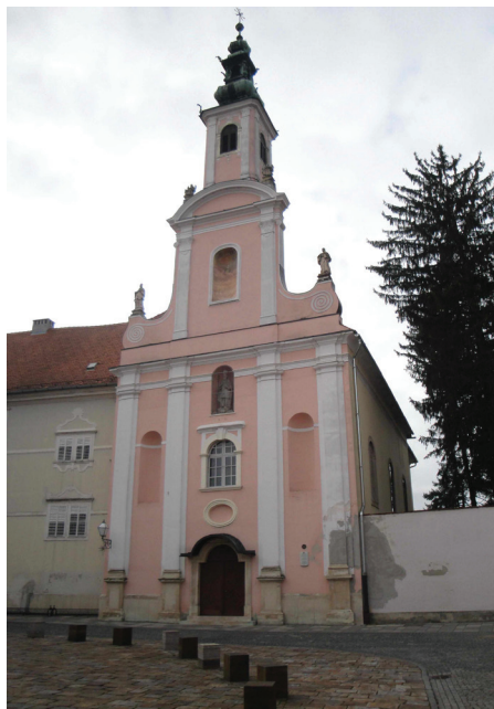
Slika 4. i 5. Varaždinska katedrala i uršulinska crkva Porođenja Isusova

U pregledu kulturnoga značenja grada svakako valja istaknuti važnije varaždinske kulturno-prosvjetne ustanove. Među prvima spominjem Državni arhiv u Varaždinu , osnovan 1950., koji svoju trenutnu djelatnost obavlja na području nekoliko županija (Varaždinska i Međimurska županija, kao i dio Krapinsko-zagorske i Koprivničko-križevačke županije). U arhivu se čuvaju gradski spisi od početka 13. do 20. stoljeća te je prema količini arhivskih spisa i njihovoj vrijednosti riječ o jednome od značajnijih gradskih arhiva u državi. 13