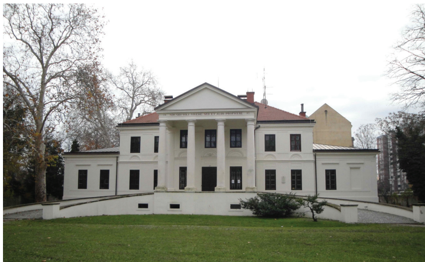
Slika 3. Vila Müller-Bedeković

grada. 10 Nadalje, pavlinska (isusovačka) crkva sv. Marije izgrađena je u 17. stoljeću (1642.-1646.) te je jedna od najznačajnijih sakralnih građevina ranoga baroka u kontinentalnome dijelu Hrvatske. Na pročelju crkve nalazi se kip Madone, vrijedan primjer manirističkoga stila. Svojom veličinom, ljepotom i baroknom opremljenošću crkva je nadilazila sakralne komplekse nekih većih pokrajinskih središta. 11 Katedralom Varaždinske biskupije postala je 1997., a u njoj se svake godine svečano otvara i održava festival barokne glazbe - Varaždinske barokne večeri. Uz crkvu je sagrađen i samostan čijim se prostorima koristi Fakultet organizacije i informatike, a u blizini crkve i samostana nalazi se Biskupski ordinarijat. Potpuni razvoj baroknoga stila u gradu vezuje se uz dolazak uršulinskoga reda te izgradnju crkve i samostanskoga kompleksa u 18. stoljeću u samoj blizini varaždinske utvrde. Naime, u razdoblju od 1716. do 1723. izgrađena je crkva Porođenja Isusova i glavno samostansko krilo. Smatra se da je red uršulinki, uz isusovački i franjevački, najzaslužniji za pojavu i održavanje barokne arhitekture gradske jezgre. 12