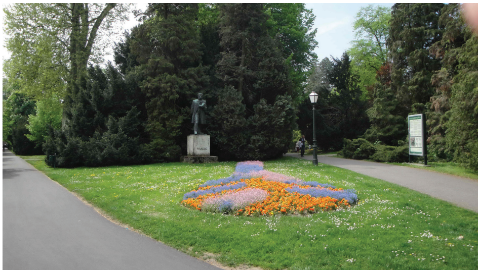
Slika 8. Šetalište Vatroslava Jagića