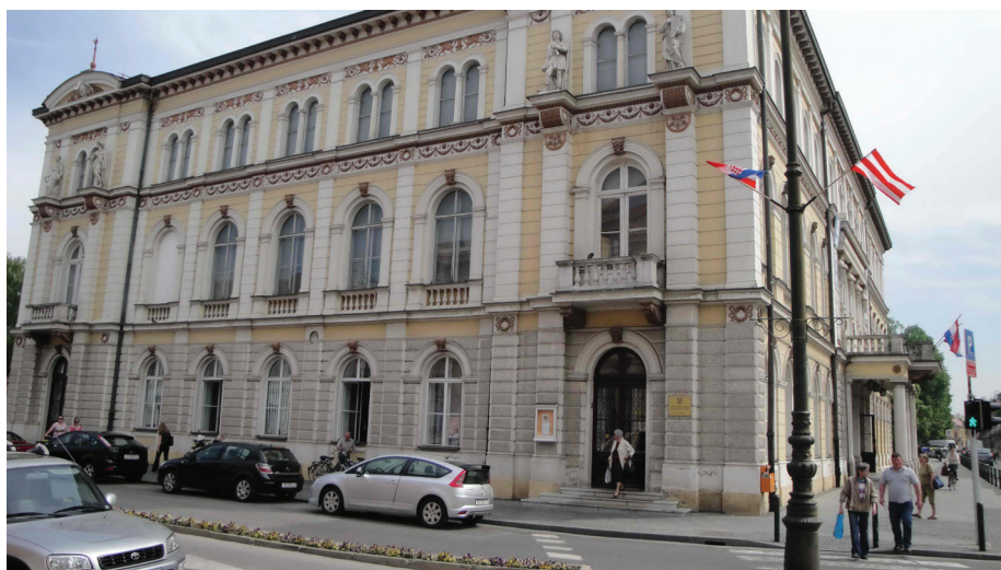
Slika 6. Gradska knjižnica smještena u zgradi kazališta

gradskim lokacijama: Odjel za odrasle (u dijelu zgrade HNK-a), Odjel za djecu, Odjel za mlade i strane literature te Ogranak Banfica. Koliku važnost knjižnica ima, pokazuju podaci o broju članova i posudbi knjiga. Tako su se, primjerice, 2007. knjižnicom koristile 10.932 osobe, a ukupna je posudba iznosila približno 290.000 knjiga i ostale građe. 17 Unazad nekoliko godina knjižnicom se koristi približno 10.800 članova, a pritom se bilježi rast broja posudbe ukupne građe koja iznosi približno 345.000 primjeraka. 18 Osim postojeće građe, knjižnica raspolaže i vrijednim zbirkama poznatih zavičajnih pjesnika Zvonka Milkovića i Gustava Krkleca, zatim zavičajnom zbirkom Varasdiniensia , ilirskom zbirkom te zbirkom Marijana Zuberu, varaždinskoga glazbenog pedagoga. 19