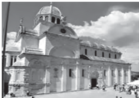
Katedrala sv. Jakova