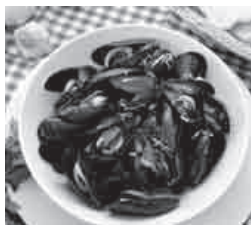
Pidoče na buzaru