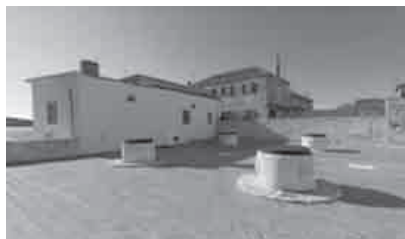
Trg četiri bunara