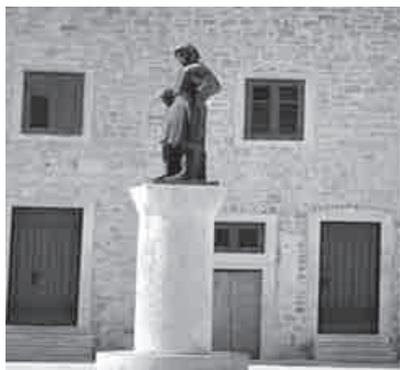
Spomenik Jurju Dalmatincu

Katedrala sv. Jakova, jedina građevina u Europi sagrađena bez korištenja vezivne žbuke i drvenih konstruktivnih elemenata, građena isključivo od običnog bijelog kamena i mramora, nezaobilazna je svakome prolazniku. Gradnja šibenske katedrale bila je iznimno teška. Masivno i veliko kamenje podizalo se pomoću konopa i kolotura, a gradnju su dodatno otežavali teški uvjeti života u gradu, odnosno kuga koja je tada harala.