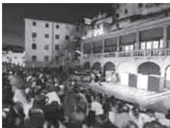
Ljetna pozornica Međunarodnog dječjeg festivala

ZADATAK. Kada je započela gradnja četiriju bunara ako znamo da je godina gradnje četveroznamenkasti broj, znamenka stotica i desetica je jednaka, zbroj svih znamenaka je 15, a zbroj znamenke tisućice i jedinice je broj koji je djeljiv samo brojem 1 i brojem 7?