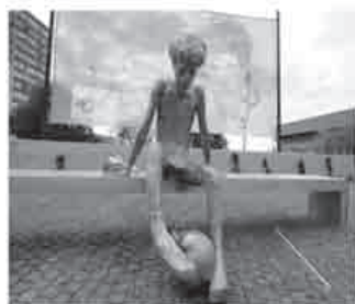
Spomenik Draženu Petroviću

U listopadu 1964. godine u gradu Šibeniku rodio se „košarkaški Mozart” koji je svoju igru pretvarao u umjetnost. Svi ga znate, a riječ je o jednom i neponovljivom Draženu Petroviću. Svoje sretno i bezbrižno djetinjstvo proveo je na Baldekinu, igrajući sa svojim bratom i prijateljima košarku. Svojom upornošću i talentom stekao je iznimno poštovanje svojih suigrača, trenera, mnogobrojnih navijača iz cijeloga svijeta. Spada u red najvećih hrvatskih sportaša svih vremena.