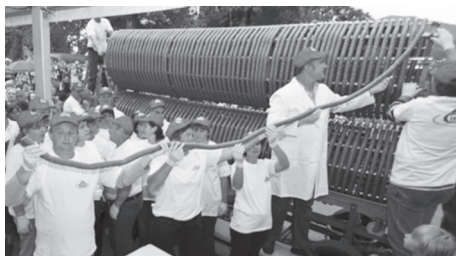
Slika 2. Ivanečki jeger 2008. godine

Najstariji zapisani spomen Ivanca nalazi se u povelji koju je 22. lipnja 1396. godine izdao Ivan Paližan Mlađi stanovnicima „slobodne vile Svetog Ivana”. Ivan Paližan Mlađi bio je član viteškog reda ivanovaca koji su u narodu poznatiji pod nazivom malteški vitezovi . Podigavši kapelu Svetog Ivana Krstitelja (po kojoj je Ivanec dobio ime), ivanovci su ostavili neizbrisiv trag u cijeloj ivanečkoj povijesti. U spomen na taj događaj svake se godine na blagdan Sv. Ivana Krstitelja proslavlja Dan općine Ivanec.