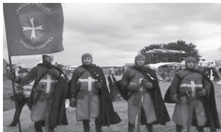
Slika 3. Ivanečki vitezovi

Ivančani nastavljaju tradiciju i danas. Tako je osnovana udruga „Vitezovi ivanovci” za čije su odabrane članove izrađene odore s opremom i oružjem prema povijesnim činjenicama. Uzimajući u obzir vremensko razdoblje od 11. do 15. stoljeća, izrađene su dvije vrste replika srednjovjekovnih odora: crni plašt i borbeno tunika s bijelim malteškim križem te crni plašt i crvena tunika s bijelim klasičnim križem. Vitezovi su opremljeni željeznim štitom, kožnatim remenom i različitim oružjem.