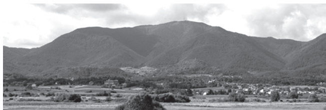
Slika 1. Pogled na Ivanščicu s ivanečke strane

U tablici su prikazane visine nekih hrvatskih planina i gora.