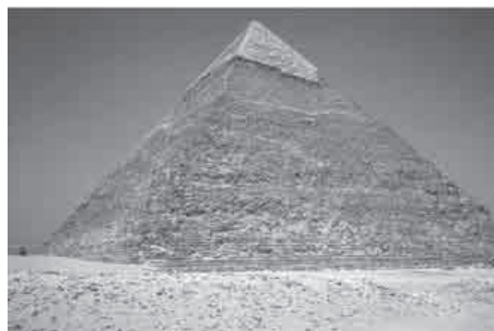
Slika 4. Velika ili Keopsova piramida

Zadatak 3. Keopsova piramida je pravilna četverostrana uspravna piramida čija je baza kvadrat sa stranicom duljine 233 metra. Koliku površinu prekriva baza Keopsove piramide? Koliki je njezin volumen danas?