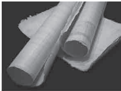
Slika 6. Papirus

Zadatak 6. Dva svitka papirusa, kada se razmotaju, zajedno su duga 15 metara. Kolika bi bila duljina trake papirusa kada bismo spojili 7 takvih svitaka?