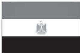
Slika 1. Zastava Arapske Republike Egipat

Na ovom vas putovanju vodimo u Egipat, točnije, u Gizu. Giza ili Gizeh je grad smješten na zapadnoj obali Nila, 20 km jugozapadno od centralnog Kaira, glavnog grada Egipta. Giza je najpoznatija po visoravni Giza gdje se nalaze neki od najimpresivnijih drevnih spomenika na svijetu: piramide, velika sfera i drugi povijesni spomenici.