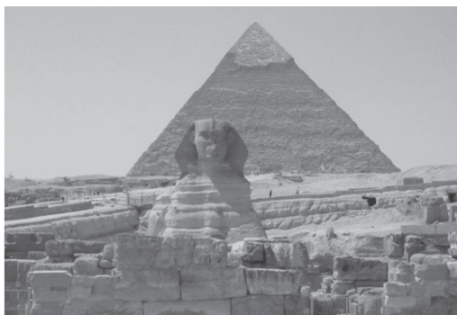
Slika 5. Velika sfinga faraona Kefrena čuva piramide u Gizi

Zadatak 4. Sfingino lice, mjereno od uha do uha, ima širinu 4.2 metra. Izmjerite širinu svojeg lica (od uha do uha) te izračunajte koliko je puta lice sfinge šire od vašega.