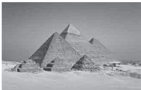
Slika 3. Piramide kraj Gize: jedno od sedam antičkih svjetskih čuda

Zadatak 2. Arheolozi su u jednoj od piramida pronašli veliku prostoriju zatranu pijeskom. Budući da su sumnjali da bi upravo u toj prostoriji mogli pronaći veliko blago, prionuli su na posao te su procijenili da će 10 arheologa taj posao obavljati 15 dana. Nakon 3 dana odlučili su ubrzati kako bi prostoriju očistili za ukupno 11 dana. Koliko im se još arheologa treba priključiti?