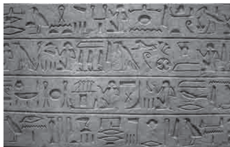
Slika 7. Hijeroglifi na kamenoj ploči

tekstove kao što su povijesni opisi, pjesme, pravni i znanstveni dokumenti te religijske molitve i rituali. Međutim, za svakodnevnu upotrebu razvijen je pojednostavljen oblik slikovnih simbola pogodnih za pisanje na papirus.