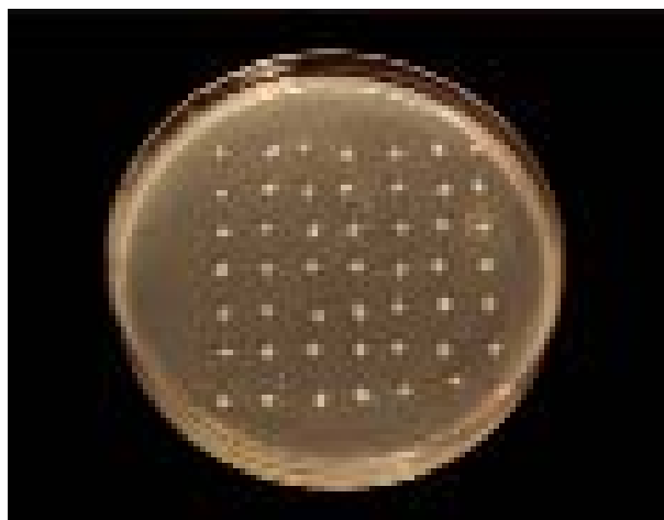
Slika 1. Rast 49 izolata vrste Candida albicans na kontrolnoj podlozi

sustava. U 210 kliničkih izolata iz dišnog sustava tipizirano je 28 biotipova, a 4 najučestalija biotipa (355, 345, 305, 155) činila su 58,0 % svih biotipova vrste C. albicans iz dišnog sustava. U 135 kliničkih izolata iz spolnomokračnog sustava tipizirano je 26 biotipova, a 4 najučestalija (355, 345, 305, 105) činila su 50,3 % svih biotipova ovog kvasca iz spolnomokračnog sustava. U 58 kliničkih izolata iz kardiovaskularnog sustava tipizirano je 15 biotipova, a 4 najučestalija (355, 155, 105, 305) činila su 67,3 % svih biotipova vrste C. albicans iz ovog sustava. U 36 kliničkih izolata iz središnjeg živčanog sustava tipizirano je 15 biotipova a 4 najučestalija (355, 345, 155, 357) činila su 58,3 % svih biotipova ove vrste iz središnjeg živčanog sustava. U 113 kliničkih izolata iz obrisaka kože tipizirano