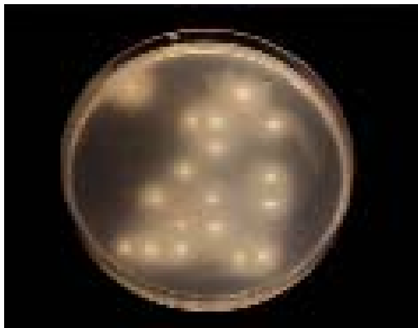
Slika 3. Rast 18 izolata vrste Candida albicans na podlozi za dokaz lučenja proteinaze