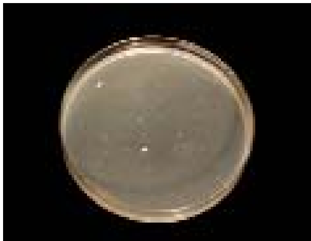
Slika 4. Rast 2 izolata vrste Candida albicans na podlozi za ispitivanje osjetljivosti na 5-fluorocitozin