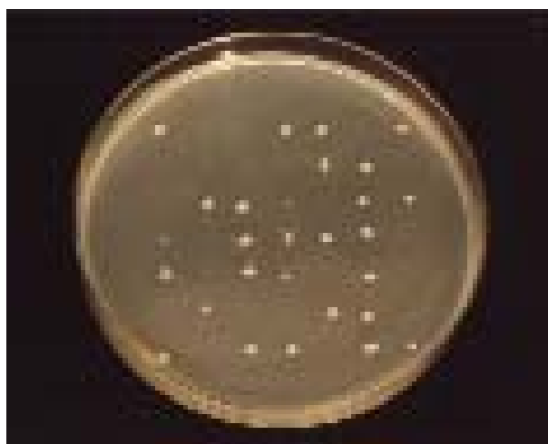
Slika 2. Rast 27 izolata vrste Candida albicans na podlozi za dokaz tolerancije pH vrijednosti od 1,4

Figure 1. Growth of 49 isolates of Candida albicans on control plate