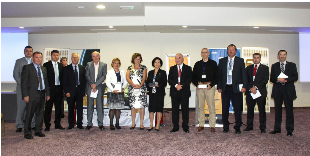
Dobitnici priznanja prigodom 50 godina djelovanja GOME

Fakultet kemijskog inženjerstva i tehnologije Sveučilišta u Zagrebu Fakultet strojarstva i brodogradnje Sveučilišta u Zagrebu.