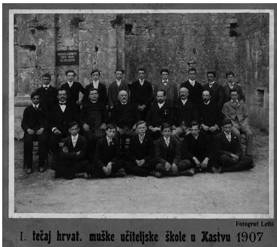
Sl. 3. Prvi naraštaj Učiteljske škole u Kastvu