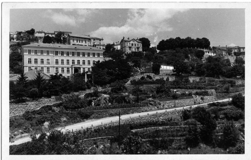
Sl. 6. Nova Učiteljska škola kralja Aleksandra