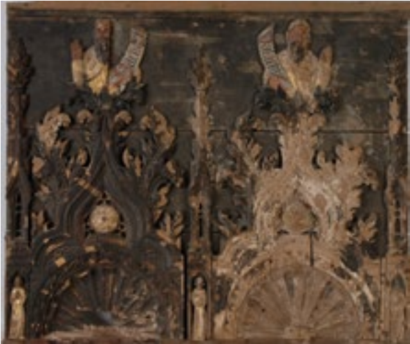
20. Reljef s prorocima Zaharijom i Malahijom prije konzervatorsko-restauratorskih radova. Relief with prophets Zechariah and Malachi, before conservation