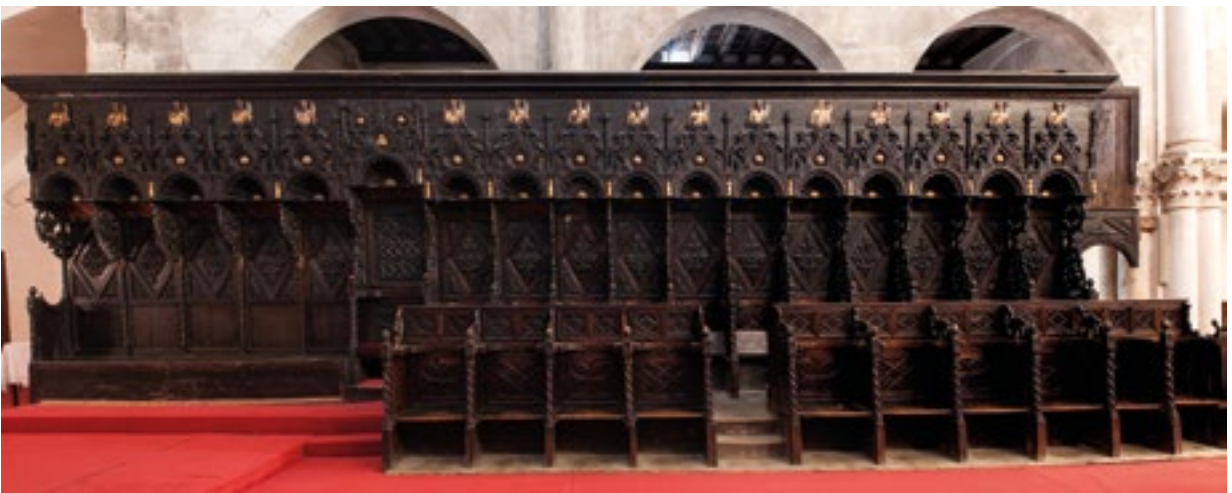
3. Južno krilo. The southern wing

ninama. Majstor Matej u Zadru je ugovarao i izvodio poslove za nadbiskupiju, ali i za druge naručitelje, što može dijelom objasniti dugotrajnost izrade klupa. 12 Čini se da Kaptol nije bio osobito zabrinut Matejevim nepoštivanjem rokova, jer je nekoliko godina poslije, 1426. godine, nadbiskup Blaž Molin od njega naručio raspelo uz koje je trebala stajati Bogorodica i sv. Ivan evanđelist te dvanaestorica apostola, za visoku ogradu prezbitarija – letner – po uzoru na baziliku sv. Marka u Veneciji. 13 Figure je oslikao slikar Ivan Petrov iz Milana, nastanjen u Zadru. 14 Na osnovi te arhivski potvrđene suradnje, pretpostavlja se da je i korske klupe polikromirao isti majstor. 15 Tu pretpostavku potkrepljuje činjenica da je Ivan Petrov bio najbolji slikar koji je u to vrijeme djelovao u Zadru te je zato morao biti prvi odabir za izvođenje tako važnih polikromatorskih radova. Konzervatorsko-restauratorska