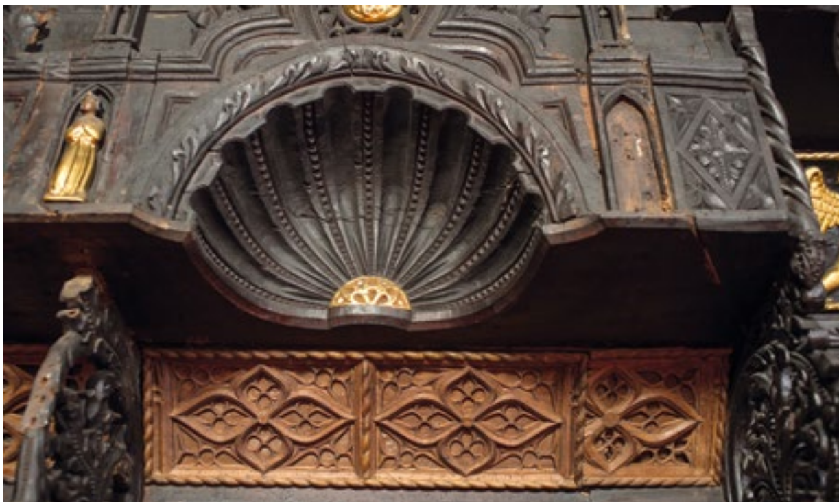
17. Detalj proširenih sjedala pokraj nadbiskupova sjedala. Detail of the extended seats next to the Archbishop's seat

prema laboratorijskim istraživanjima, u prvoj i drugoj repolikromiji nalazi kredno-tutkalna osnova s bolonjskom kredom (gipsom). U prvoj repolikromiji ustanovljena je još cinkova bijela, a moguće i kromna žuta iz polimenta. U drugoj repolikromiji detektiran je cinober kao dio polimenta za pozlatu. 35 S obzirom na prisutnost cinkova bjelila, a možda i kromove žute, taj oslik nije mogao nastati prije kraja 18. stoljeća. Moguće je da je izveden u sklopu velike obnove svetišta i klupa na samom kraju stoljeća.