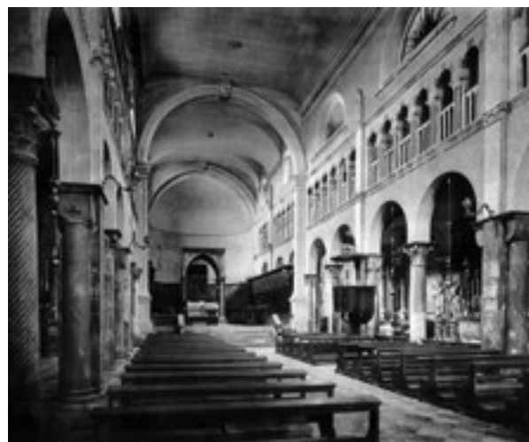
19. Crkva prije rekonstrukcije (Ć. M. IVEKOVIĆ, Građevinski i umjetnički spomenici Dalmacije I. Zadar, Beč, 1928., sl 6). The church prior to the reconstruction (from: Ć. M. IVEKOVIĆ, Građevinski i umjetnički spomenici Dalmacije I, Zadar, Beč, 1928, image 6)

Marcocchijevoj obnovi možemo pripisati brojne popravke rezbarije, osobito zamjene oštećenih vrhova lišća