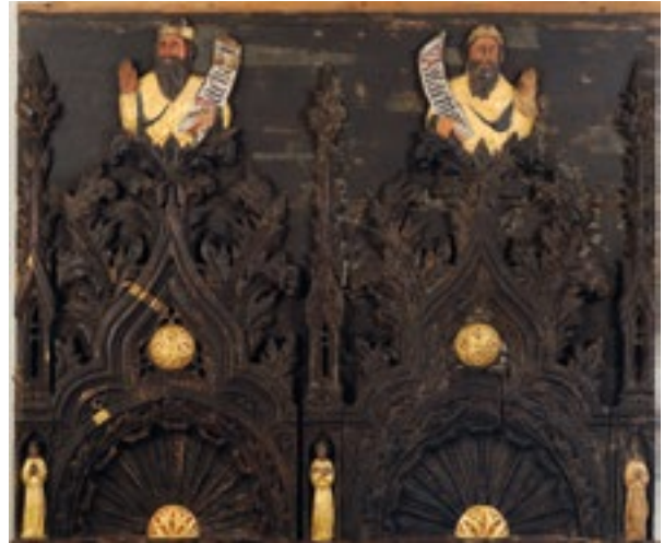
21. Reljef s prorocima Zaharijom i Malahijom nakon konzervatorsko-restauratorskih radova. Relief with prophets Zechariah and Malachi, after conservation

klupe nisu znatnije oštećene. Pregledavajući fotografije iz različitih vremena, zamjećujemo da su dijelovi figura i ornamentike tijekom 20. stoljeća nestali. 43