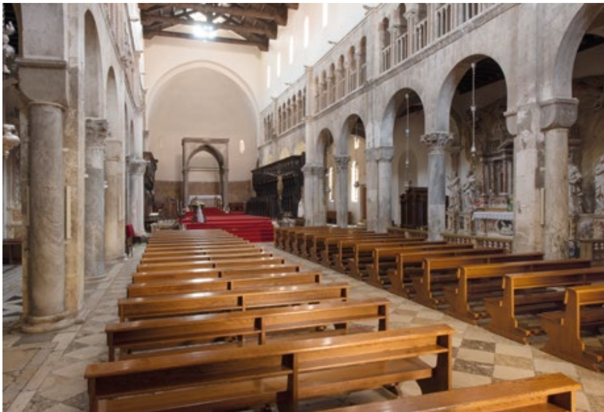
1. Prezbiterij s korskim klupama danas. The presbytery with the choir stalls, present-day

za nadbiskupovo sjedalo. U ugovoru je napomena da će u vrijeme Matejeva boravka u Zadru, zbog rada na koru, za njega i njegovu obitelj biti osiguran smještaj u kanoničkoj kući. Posao je trebao biti završen za osamnaest mjeseci, a ugovorom je dogovoreno da će se novac isplatiti u tri navrata, na početku posla, kad bude završena polovica te nakon završetka posla.