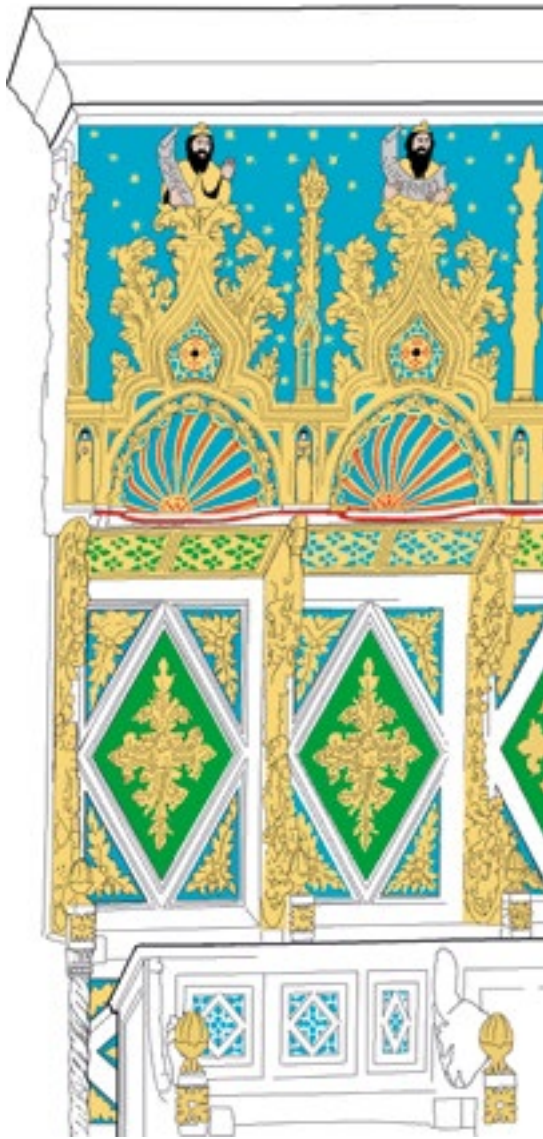
14. Rekonstrukcije mogućeg izgleda polikromije (crtež izradila K. Škarić).

Reconstruction of the possible appearance of the polychromy (drawing by K. Škarić)