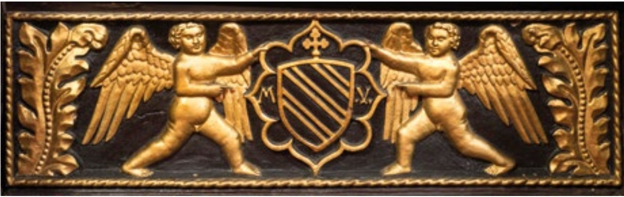
7. Grb nadbiskupa Maffeja Valaressa na nadbiskupovu sjedalu.

The coat of arms of Archbishop Maffeo Vallaresso on the Archbishop's seat