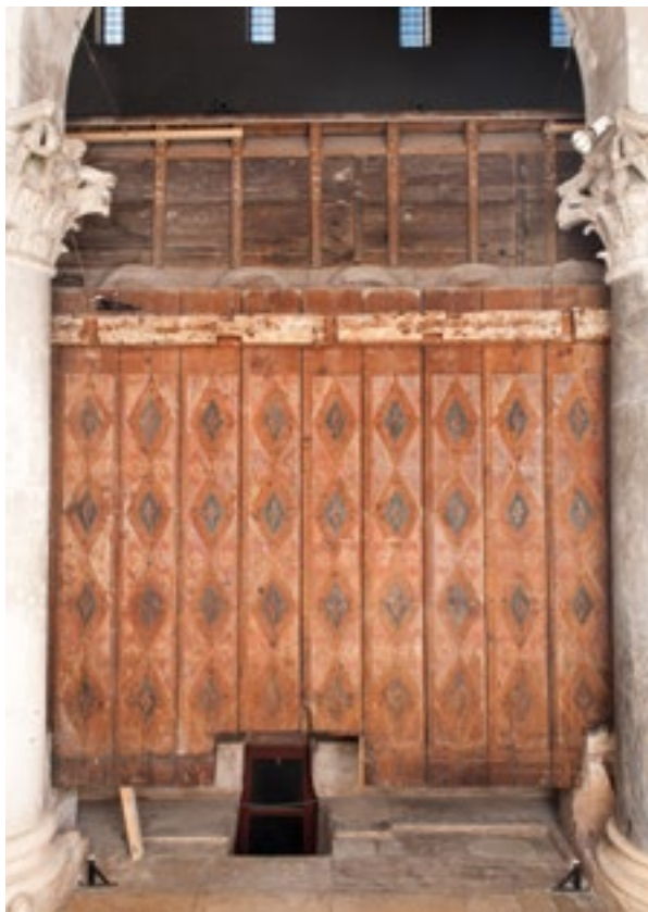
12. Poledina sjevernog krila. Rear side of the northern wing