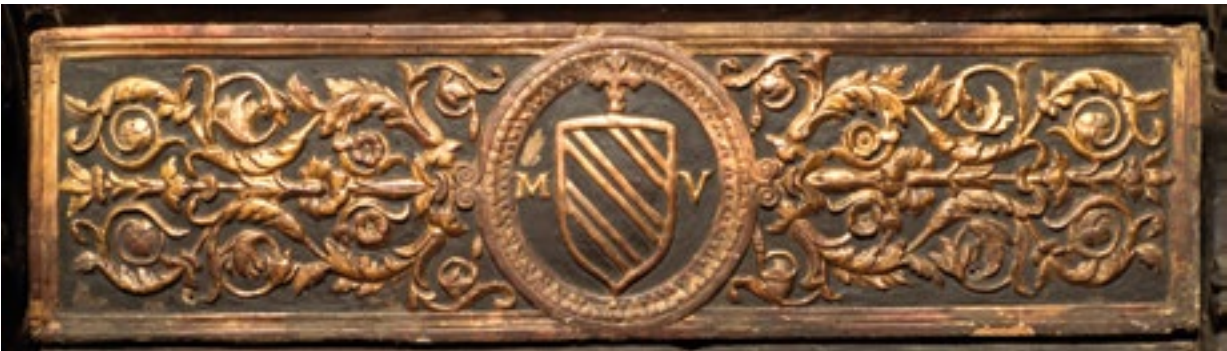
8. Grb nadbiskupa Maffeja Valaressa na kneževu sjedalu.

The coat of arms of Archbishop Maffeo Vallaresso on the Archbishop's seat