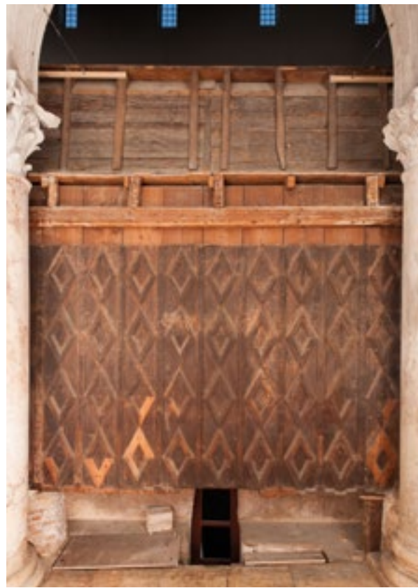
13. Poledina južnog krila. Rear side of the southern wing

caj prilikom uporabe. Velike ravne plohe gornjeg dijela gornjih sjedala bile su obojene svijetlomodro i ukrašene zvjezdicama. Na školjkama su kombinirane svijetlomodra i pozlata, a dijamantni ukras i donji porub bio je jarkocrven. Istovjetna jarkocrvena nalazila se i drugdje na klupama, primjerice na obrubu grba na kneževu sjedalu. 22 Prema tragovima pozlate na više vegetabilnih ornamenata te na fijalama u gornjem dijelu, moguće je da je sav istovrsni ukras bio pozlaćen. Ipak, s obzirom na slabu sačuvanost pozlate, to je nemoguće sa sigurnošću utvrditi.