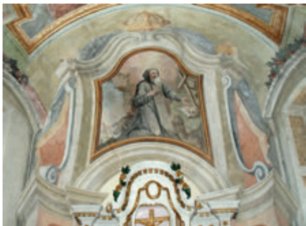
3. Antun Archer (pripisano), Sv. Antun Pustinjak, atika glavnoga oltara, zadnje desetljeće 18. st., župna crkva sv. Antuna Pustinjaka, Slavetić (snimila J. Nestić, 2014.).

Antun Archer (attributed to), St. Anthony the Hermit, the main altar attic, in the 1790s, the parish church of St. Anthony the Hermit, Slavetić (photo by J. Nestić, 2014)