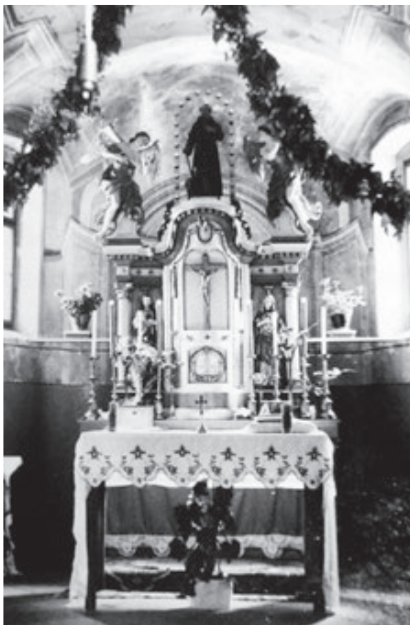
15. Svetište župne crkve sv. Antuna Pustinjaka u Slavetiću, stanje 1970. godine. Preuzeto iz: KOŠČAK, ANĐELKO; BALOBAN, JOSIP; BALOBAN, STJEPAN 2011. Župa svetoga Antuna Pustinjaka u Slavetiću: prigodom proslave 350. obljetnice župe (1661.–2011.), Zagreb, 44.

Sanctuary of the parish church of St. Anthony the Hermit, condition in 1970 (cited from: ANĐELKO KOŠČAK, JOSIP BALOBAN, STJEPAN BALOBAN, Župa svetoga Antuna Pustinjaka u Slavetiću. Prigodom proslave 350. obljetnice župe (1661–2011), Jastrebarsko, 2011, 44)