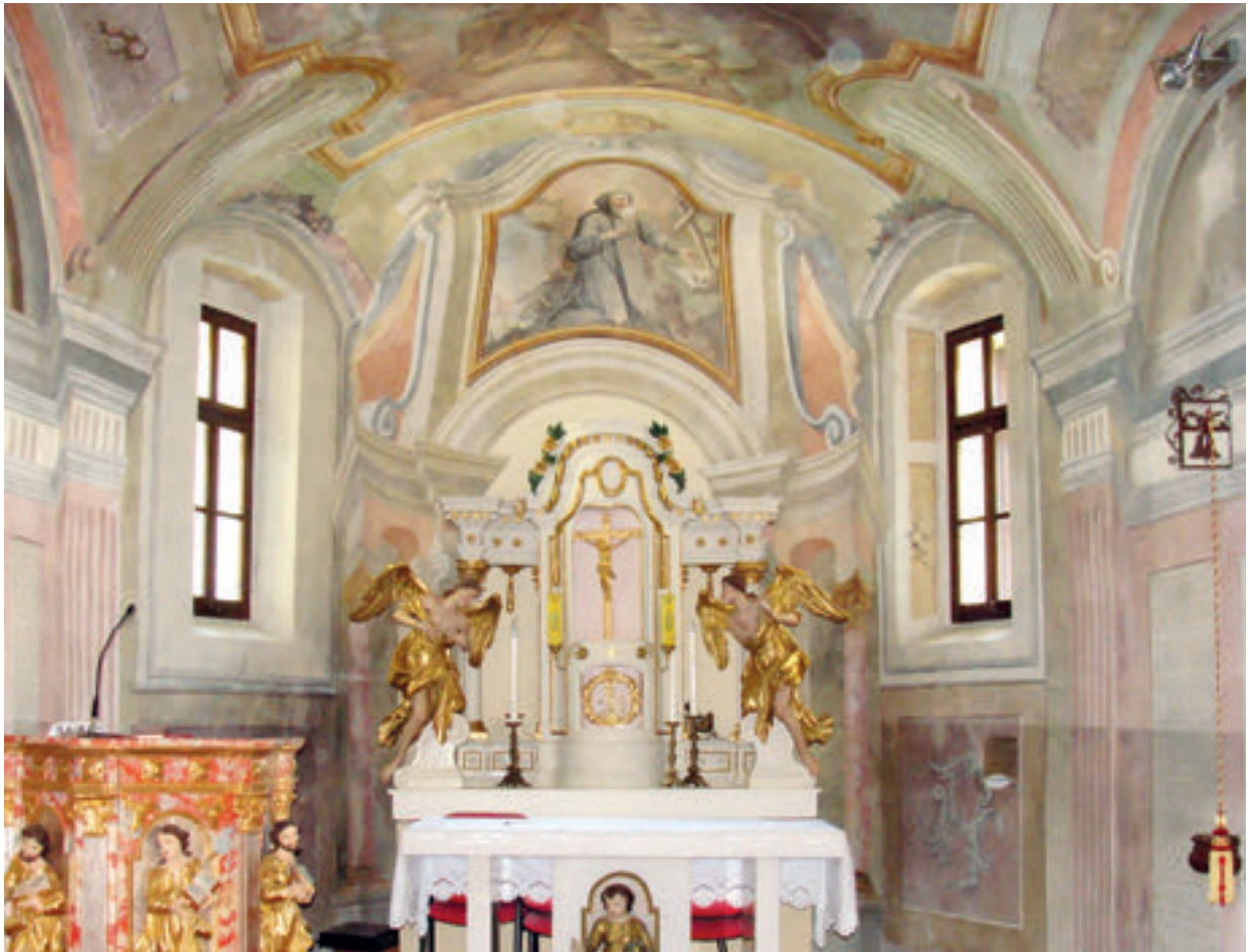
1. Svetište župne crkve sv. Antuna pustinjaka u Slavetiću. Sanctuary of the parish church of St. Anthony the Hermit in Slavetić

je, povisuje i prošupljuje (sl. 1). Na središnjem dijelu zaključnoga zida naslikan je retabl oltara, čiji se tanki i vitki stupovi uzdižu bočno od menze, skladno vizualno rubecći drveni tabernakul oltar. Stupovi nose gređe koje je izrazito blisko upravo onome s tabernakul oltara – srodno je profilirano, s polukružno povijenim segmentom u sredini. Nad gređem se uzdiže visoka atika koju gotovo u cijelosti ispunjava iluzionirana slika s prikazom sv. Antuna pustinjaka (opata), u sivom monaškom habitu s kukuljicom na glavi, poklekutoga unutar pustinjačkoga pejzaža. Na stijeni njemu slijeva nalaze se otvorena Knjiga, drveni križ i lubanja, a iza njega zdesna nalazi se svinja, koja simbolizira demone požude i proždrljivosti te je znak svečeve pobjede nad kušnjama i grijehom, kao i njegove uloge zaštitnika stoke. 5 Na vrhu atike je zlatna kruna ispod koje se bočnim stranama atike razastire tkanina svečanoga zastora. Vizualna uklopljenost drvenog tabernakul oltara s iluzioniranim retablom očituje se ne samo u njegovim odmjerenim dimenzijama spram oslika nego i u oblikovnim karakteristikama, u kojima oslik prepoznajemo kao svojevrsni slikani okvir drvenom oltaru. Bitno je pritom naznačiti da je izvorno oltarna menza bila udaljena od začelnoga zida pa se oko oltara moglo obilaziti. 6 Bez