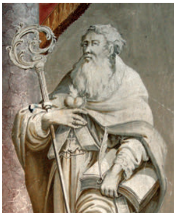
6. Antun Archer (pripisano), Sv. Augustin, glavni oltar, 1792., župna crkva sv. Ivana Krstitelja, Zagreb.

Antun Archer (attributed to), St. Anthony the Hermit, the main altar, in the 1790s, the parish church of St. Anthony the Hermit, Slavetić