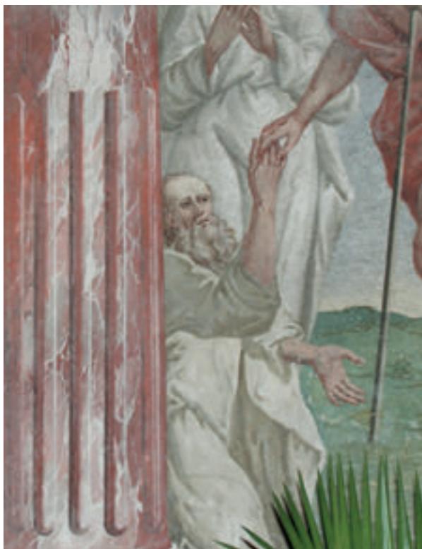
9. Antun Archer (pripisano), Krist u limbu (detalj), 1787., kapela sv. Križa, župna crkva sv. Ivana Krstitelja, Zagreb.

Antun Archer (attributed to), Christ in Limbo (detail), 1787, the Holy Cross Chapel, the parish church of St. John the Baptist, Zagreb