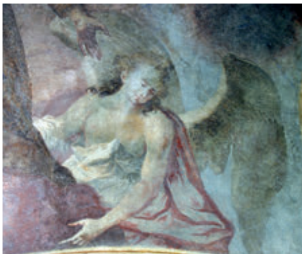
11. Antun Archer (pripisano), anđeo sa svodnoga oslika svetišta, zadnje desetljeće 18. st., župna crkva sv. Antuna Pustinjaka, Slavetić.

Antun Archer (attributed to), an angel from the painted vault of the sanctuary, in the 1790s, the parish church of St. Anthony the Hermit, Slavetić