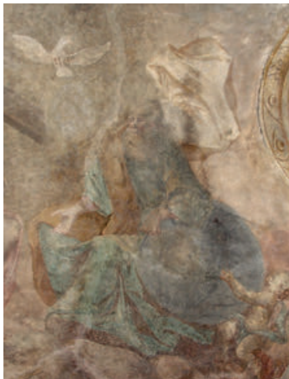
10. Antun Archer (pripisano), Bog Otac (detalj), zadnje desetljeće 18. st., župna crkva sv. Antuna Pustinjaka, Slavetić.

Antun Archer (attributed to), Christ in Limbo (detail), 1787, the Holy Cross Chapel, the parish church of St. John the Baptist, Zagreb