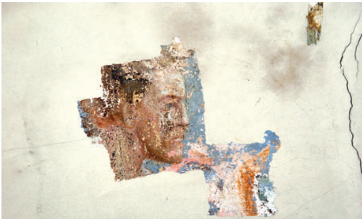
14. Zvonimir Wyroubal (?), segment zidnoga oslika na svodu svetišta, 1929. (?), župna crkva sv. Antuna Pustinjaka, Slavetić (snimila J. Nestić, 2014.).

Zvonimir Wyroubal (?), a portion of the vault painting in the sanctuary, 1929 (?), the parish church of St. Anthony the Hermit, Slavetić (photo by J. Nestić, 2010)