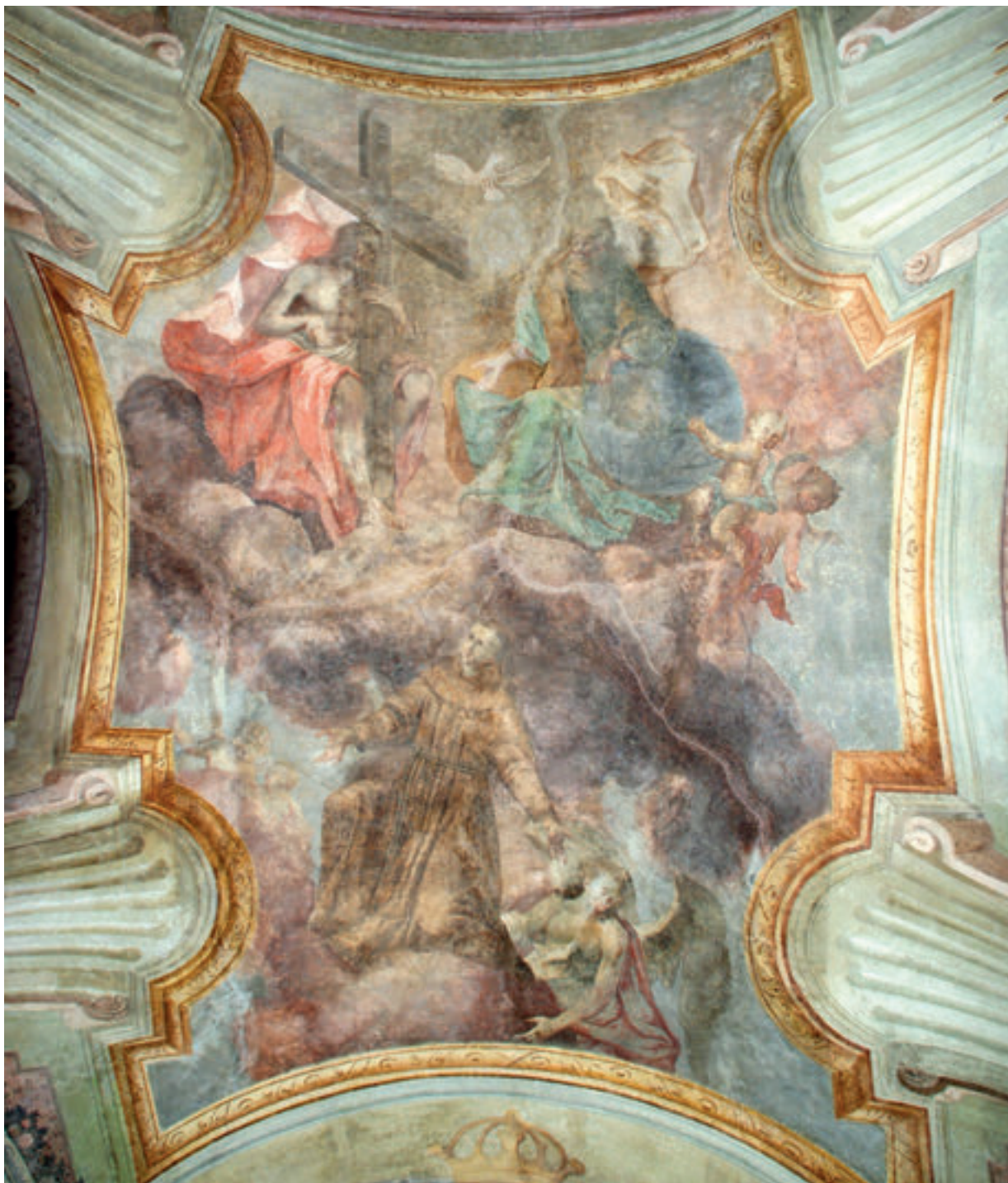
2. Antun Archer (pripisano), Sv. Antun Padovanski u slavi i Presveto Trojstvo, zadnje desetljeće 18. st., župna crkva sv. Antuna Pustinjaka, Slavetić.

Antun Archer (attributed to), St. Anthony of Padua in Glory and the Most Holy Trinity, in the 1790s, the parish church of St. Anthony the Hermit, Slavetić