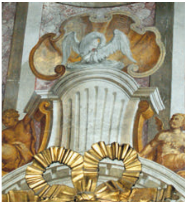
7. Antun Archer (pripisano), detalj atike glavnoga oltara u kapeli sv. Križa, 1787., župna crkva sv. Ivana Krstitelja, Zagreb.

Antun Archer (attributed to), detail of the main altar attic in the Holy Cross Chapel, 1787, the parish church of St. John the Baptist, Zagreb