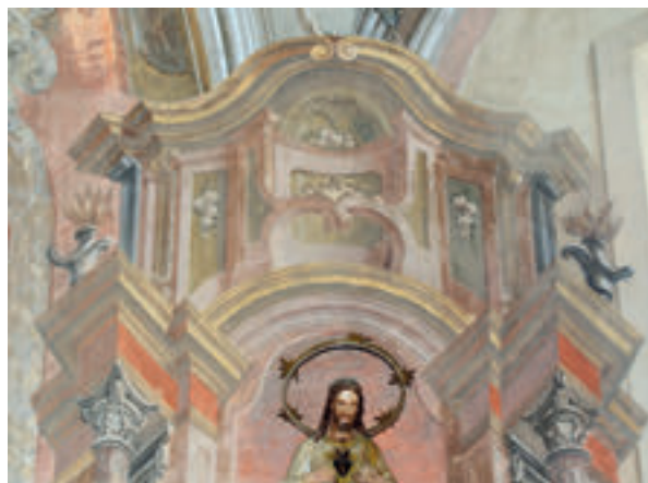
4. Antun Archer (pripisano), atika Oltara Presvetog Srca Isusova (izvorno Oltar sv. Barbare), zadnja četvrtina 18. st., župna crkva sv. Nikole, Hrašćina.

Antun Archer (attributed to), St. Anthony the Hermit, the main altar attic, in the 1790s, the parish church of St. Anthony the Hermit, Slavetić