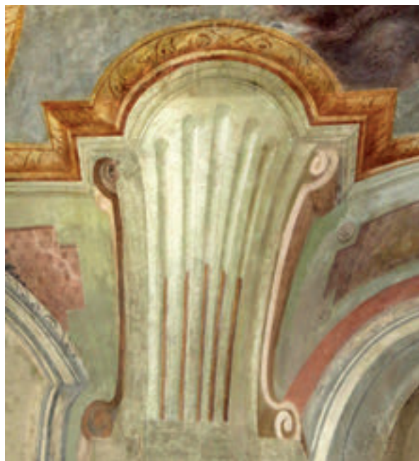
8. Antun Archer (pripisano), detalj iluzionirane arhitekture svodnoga oslika, zadnje desetljeće 18. st., župna crkva sv. Antuna Pustinjaka, Slavetić (snimila J. Nestić, 2014.).

Antun Archer (attributed to), detail of the main altar attic in the Holy Cross Chapel, 1787, the parish church of St. John the Baptist, Zagreb (photo by J. Nestić, 2012)