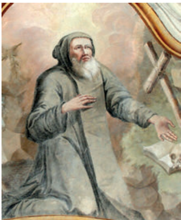
5. Antun Archer (pripisano), Sv. Antun Pustinjak, glavni oltar, zadnje desetljeće 18. st., župna crkva sv. Antuna Pustinjaka, Slavetić.

Antun Archer (attributed to), attic of the Altar of the Most Holy Heart of Jesus (originally St. Barbara's Altar), in the 1790s, the parish church of St. Nicholas, Hrašćina