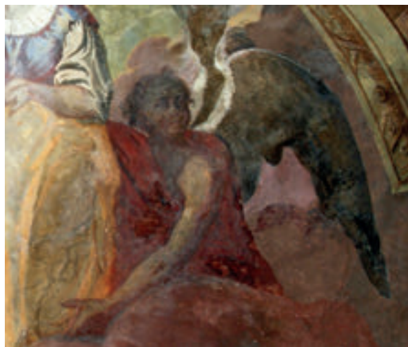
12. Antun Archer (pripisano), anđeo sa svodnoga oslika kapele sv. Izidora, unutar zadnja dva desetljeća 18. st., župna crkva sv. Nikole, Hrašćina.

Antun Archer (attributed to), an angel from the painted vault of the sanctuary, in the 1790s, the parish church of St. Anthony the Hermit, Slavetić