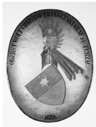
Grb Frankopana, HPM/PMH 22710

Od najranijih faza svoga razvoja složen postupak kreiranja, izrade i evidencije grbova bio je podložan stabilnom sustavu vrlo strogih, razrađenih i hermetičkih pravila . Unatoč činjenici da su se u konkretnim slučajevima mogle uočiti svojevrstne razlike u primjeni heraldičke teorije i njezinim praktičnim rješenjima - posebice s obzirom na različite tipove društvenih odnosa (staleških i klasnih, rodnih i generacijskih) unutar različitih zajednica ili kulturnih podneblja - sustav heraldičkih pravila može se u osnovi držati univerzalnim i nepromjenljivim još od srednjovjekovnog vremena do najnovijeg doba. Zbog toga se, na primjer, prema nakitu iznad štita mogu razlikovati grbovi visokog plemstva od onih nižega plemićkog statusa, grbovi plemića od građanskih grbova, kao i grbovi crkvenih osoba od grbova svjetovnih osoba; prema obliku štita razlikuju se grbovi žena i muškaraca, kao i grbovi bračnoga para, ili izvanbračnih sinova; prema posebnim dodacima u desnom gornjem uglu štita razlikuju se stariji i mlađi sinovi istoga oca, seniora i vazala, itd. Međutim, u hrvatskoj se heraldici češće može naići na slučajeve koji ne podliježu ustaljenim pravilima zapadnoeuropske heraldike. Tako je, na primjer, bila uvriježena praksa da isti grb ima nekoliko različitih (najčešće, ali ne i nužno) srodnih obitelji, da se ne provode dosljedno pravila o slaganju heraldičkih boja i metala, da se grbovi neudanih žena i udovica gotovo nikada ne razlikuju oblikom štita od grbova muškaraca, a