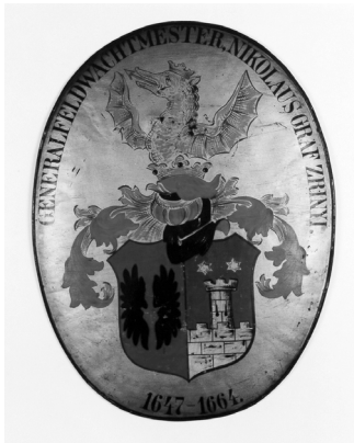
Grb Zrinski

Celjskih, Jan Vitovac, isticao grb identičan grbu svoga seniora, tijekom ga je vremena postupno varirao i konačno potpuno zamijenio bitno različitom vlastitom heraldičkom varijantom. 9