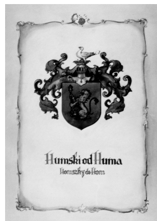
Grb Humski od Huma, HPM/PMH 23608

pretpostaviti da je još poneki od brojnih posjednika sutinsko-poznanovečkog vlastelinstva tijekom njegove duge prošlosti bio heraldički predstavljen u ovoj privatnoj dvorskoj «kolekciji». No, ne ulazeći sada u različite pojedinosti sadržaja, stila i povijesti naše male zbirke, ovdje nam je namjera prvenstveno naglasiti činjenicu da se u dvorcu Poznanovec čuvala i prenosila među generacijama rodbinski vezanih, ali i međusobno potpuno stranih obitelji, njegova specifična heraldička «genealogija» - povijest njegovih gospodara ispričana simboličkom grbova. Po svemu sudeći, ona je bila utemeljena oko polovice XIX. st. (možda baš) u vrijeme dok je Poznanovec bio u posjedu Sermagea, a proširena je novim primjercima početkom 20. st. kada su ondje živjeli čla-