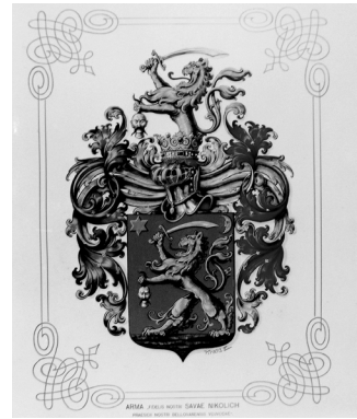
Grb Nikolić Podrinjski, HPM/PMH 24338