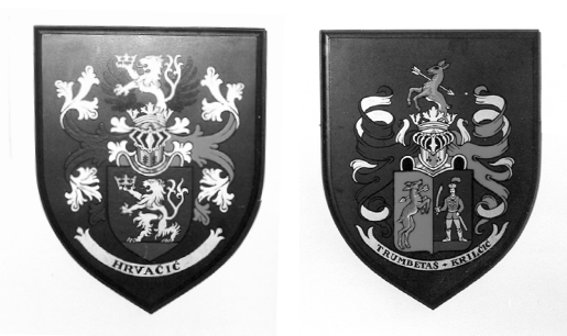
Grbovi turopoljskih plemića, Muzej Turopolja Velika Gorica