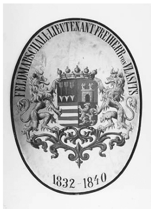
Grb Vlašić, HPM/PMH 22805