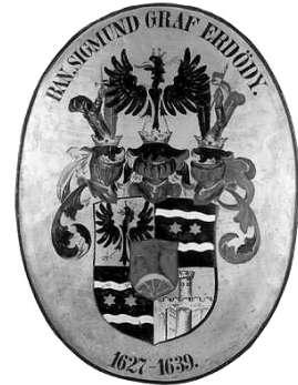
Grb Erdödy, HPM/PMH 22802

Ponešto se od opisanoga razlikuje primjer grba Martina Imbriševića, bojnika u 1. pograničnoj banskoj regimenti, koji je 1853. g. odlikovan Ordenom Željezne krune III. stupnja i plemićkom titulom, a sve to zbog zapaženog sudjelovanja u potrazi za izgubljenim ugarskim kraljevskim insignijama u okolici brda Aaliona. Elementi njegova plemićkoga grba - od precizno determiniranog planinskog ambijenta, preko oruđa za kopanje - lopate i pijuka - do ugarske krune smještene u konkretno pejzažno okruženje, nedvosmisleno evociraju događaj iz života njegova nositelja zbog