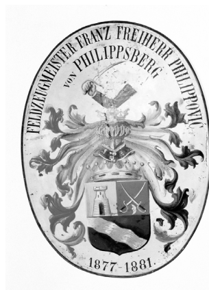
Grb Filipović, HPM/PMH 22872