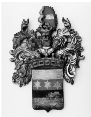
Grb Mamula, HPM/PMH 7302