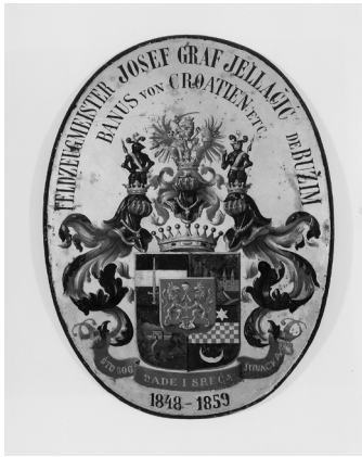
Grb Jelačić, HPM/PMH 22712

dioba grbova s obzirom na generacijske razlike unutar obitelji javlja se samo sporadično. 12 Jedan od bitnih razloga ovoj pojavi leži u činjenici da na području hrvatskih zemalja nije djelovao niti jedan heraldički ured, osim Heraldичke komisije u Zadru koja je osnovana tek početkom 19. st. kao legitimni regulator heraldičke prakse na teritoriju Dalmacije tijekom druge austrijske uprave (1814.-1918. g) 13 .