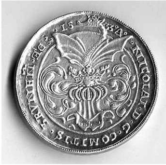
Talir Nikole III. Zrinskog iskovan u Gvozdanskom 1533. g., lice.