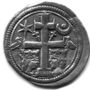
Banski denar Henrika Gisingovca (1269.-1270.), naličje.