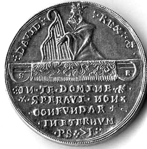
Talir Nikole III. Zrinskog iskovan u Gvozdanskom 1533. g., naličje.