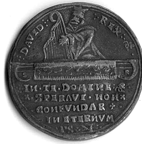
Talir Nikole III. Zrinskog iskovan u Gvozdanskom 1533. g., naličje.