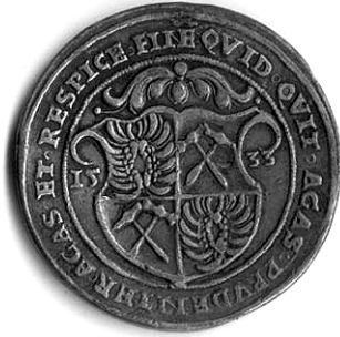
Talir Nikole III. Zrinskog iskovan u Gvozdanskom 1533. g., lice.