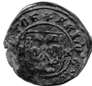
Krajcara Jana Vitovca, iskovana u Krapini 1459. g., naličje.