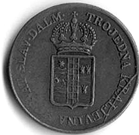
Josip Jelačić: 1 križar iz 1849. g., kovan u Zagrebu, lice.