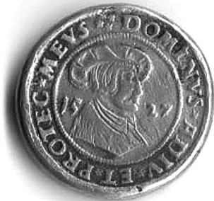
Groš debeljak Nikole III. Zrinskog iskovan u Gvozdanskom 1527. g., lice.