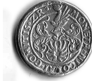
Groš debeljak Nikole III. Zrinskog iskovan u Gvozdanskom 1527. g., naličje.