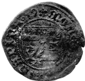
Krajcara Jana Vitovca, iskovana u Krapini 1459. g., lice.