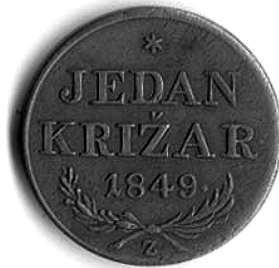
Josip Jelačić: 1 križar iz 1849. g., kovan u Zagrebu, naličje.