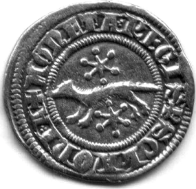
Banski denar Henrika Gisingovca (1269.-1270.), lice.