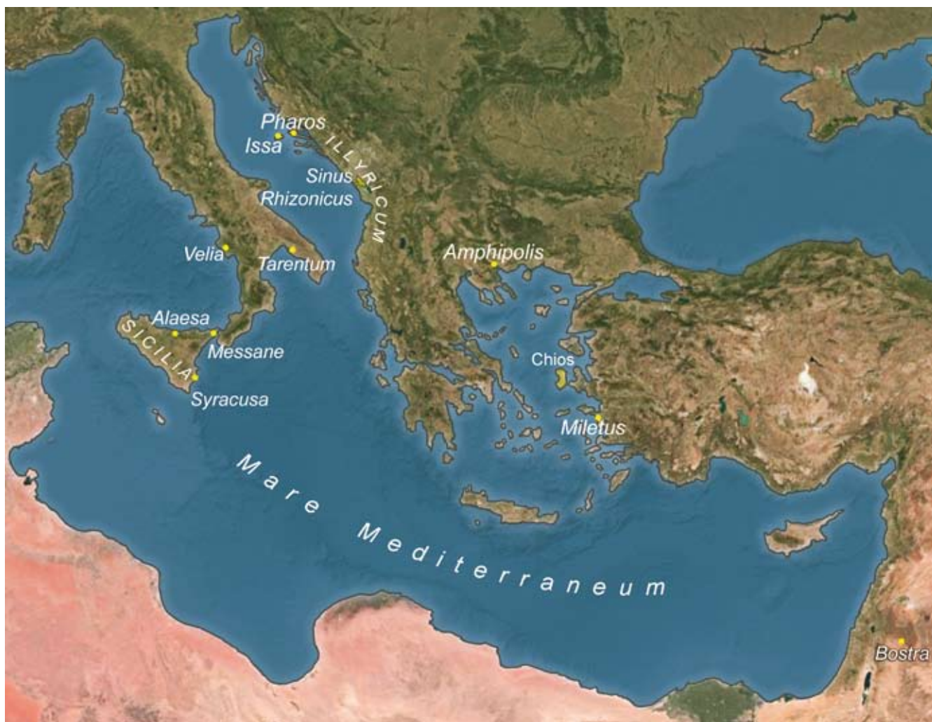
Karta rasprostranjenosti kovnica grčkoga i rimskoga provincijalnog novca nađenog na Vlaškoj njivi Map showing the distribution of the mints of the Greek coins and the Roman Provincial coins found at Vlaška njiva

Što se tiče novca grada Mileta, jedinu paralelu isejskom nalazu možemo naći u primjerku srebrnog novca Mileta iz Salone. 40 Brončani novac Mileta nešto mlađi od viškog primjerka nađen je na drugoj strani Jadrana, u Anconi. 41