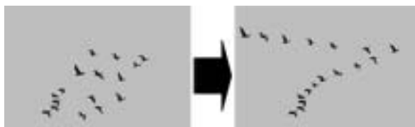
Slika 2. „Priroda nam pokazuje put“ Figure 2 „Nature shows us the way“

Johan Elvnert, također iz Opće uprave za istraživanje EK, u svojem je izlaganju o istoj temi naglasio da je uspješna primjena STP-a usko vezana za inovativne ideje i hrabre poteze. U tome, istraživači i znanstvenici, zajedno s industrijom, vlasnicima šuma i javnim sektorom moraju nastupiti zajedno kako bi otvorili put koji vodi ostvarivanju Vizije 2030 . J. Elvnert navodi da funkcionalni inovacijski sustav, akcijski plan za stratešku komunikaciju te aktivnosti na području obrazovanja i edukacije moraju podržavati težnje STP-a i pretočiti viziju budućnosti u stvarnost - kako bi svi mi profitirali. Na slikovit način – uz slogan Priroda nam pokazuje put (sl. 2) - pozvao je sve zainteresirane da dosljednim i usmjerenim pristupom, koji ovisi o zajedničkoj angažiranosti i pokretačkoj sili, osiguraju budućnost europskoga šumarskog sektora, a ekonomski će se učinci osjetiti na nacionalnoj i europskoj razini, kao i privatni sektor, ali profitirat će se i u smislu doprinosa društvu i okolišu.