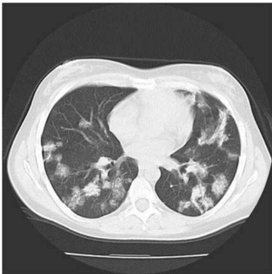
Slika 2. HRCT pluća bolesnice s non-Hodgkin limfomom, dijabetesom i plućnom tuberkulozom. Vide se nesegmentalne multikavitarnе lezije u donjem režnju.

Figure 1. Conventional radiological image with lung infiltrates and destruction in the left upper lobe