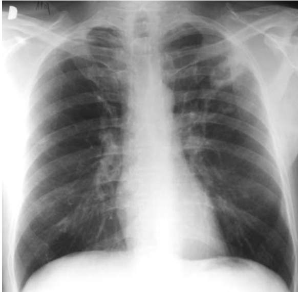
Slika 1. Konvencionalni radiološki slikovni prikaz pluća s infiltratom i destrukcijom u lijevom gornjem režnju

Uobičajena lokalizacija parenhimskih infiltrata i destrukcije su apikalni i posteriorni segmenti gornjih plućnih