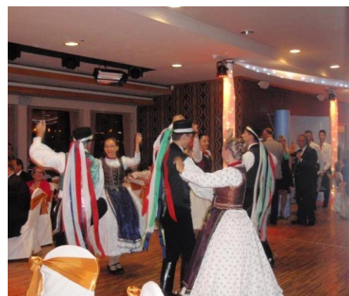
„Kalocsa –folklor« za vrijeme večernjeg krstarenja Dunavom (Budimpešta, 07.09.2014.) / "Kalocsa - folklor" during an evening cruise on the Danube (Budapest, 07.09.2014.)