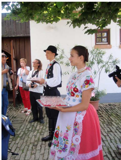
Tradicionalna prijaznost domaćina za vrijeme održavanja 56. i FIJET WORLD CONGRESSA / The traditional friendliness of the host for the time of 56th FIJET World Congress