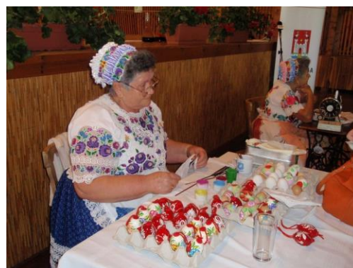
Oslikavanja jaja je kulturna tradicija u mađarskim selima blizu Pečuha / Painting eggs is a cultural tradition in the Hungarian villages near Pecs