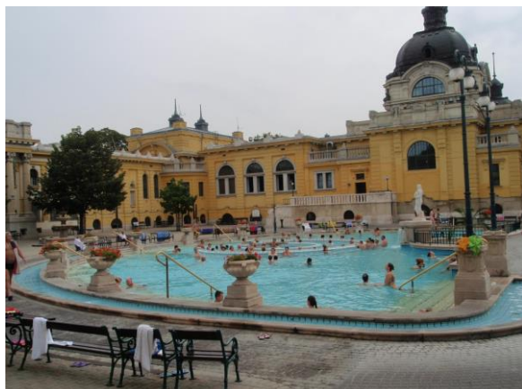
Čuveno termalno kupalište Szechnyi u Budimpešti / The famous thermal baths in Budapest Szechnyi