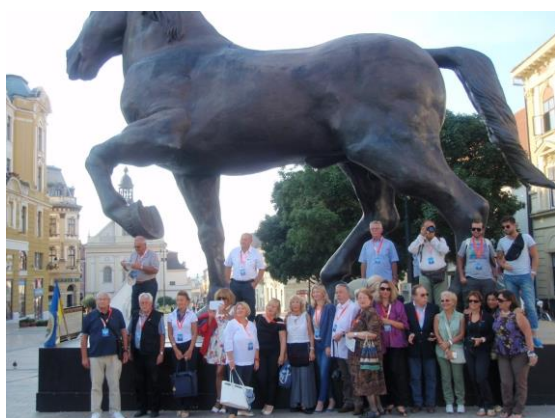
Delegacija FIJET CROATIA na glavnom trgu (Pečuh, 08.09.2014) / FIJET CROATIA Delegation on the main square (Pécs, 08.09.2014)