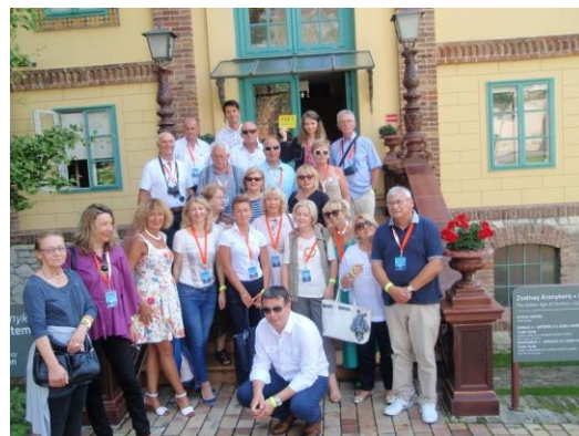
Fotografija za uspomenu delegacije FIJET – CROATIA (Pečuh, 9.11.2014.) / Photo souvenir -delegation FIJET - CROATIA (Pécs, 09.11.2014.)