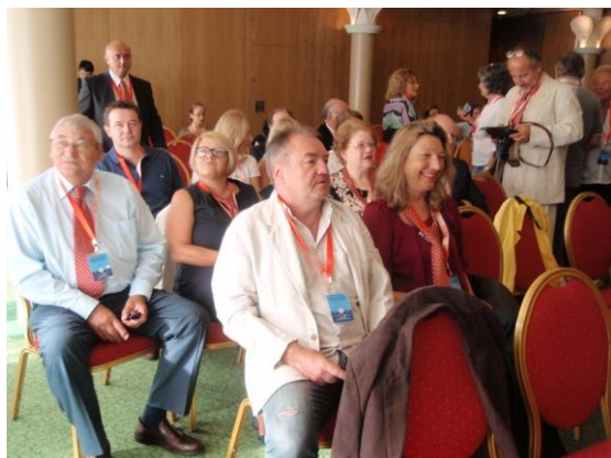
Sudionici 56og FIJET WORLD CONGRESSA pred početak plenarne Skupštine FIJET-a ( Budimpešta, 06.09.2014) / Participants of the 56 th FIJET World Congress before the Plenary Assembly (Budapest, 09.06.2014)