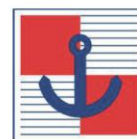
Hrvatski hidrografski institut, Split

products. Settlements with greatest populations on the island include Pag, Novalja and Poveljana. A bridge over Ljubačka Doors connects Pag with the continent.