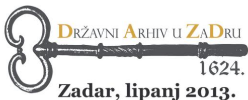
Državni arhiv u Zadru