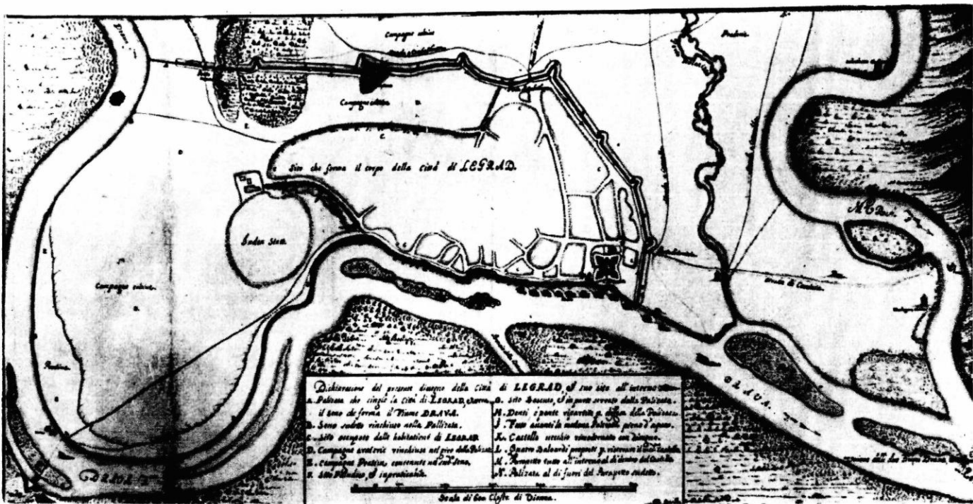
Sl. 3. Plan tvrđave Legrad iz zadnje četvrtine 17. stoljeća.